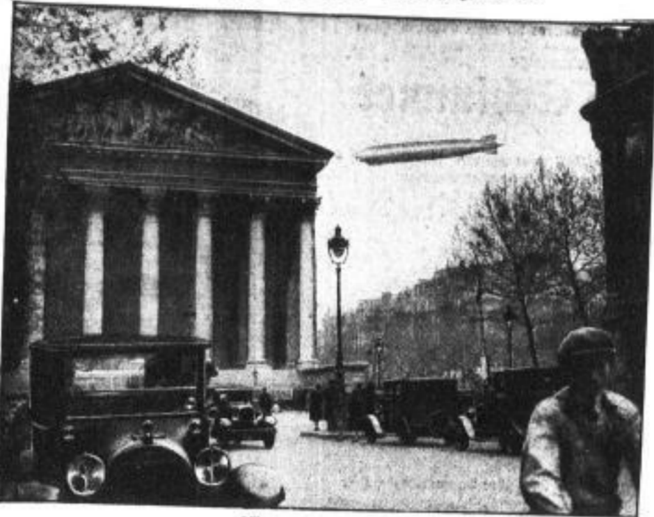
Das Luftschiff über der Straße St-Madeleine, dem Mittelpunkt der Pariser Boulevards, J