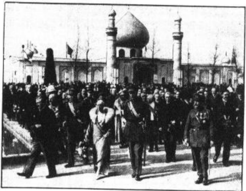
König und Königin von Belgien betreten in Begleitung des Dekommissars des Ausstellungsgeländes die Antwerpener Weltausstellung 1930 wurde im Beisein einer ungeheuren Menschenmenge von dem belgischen Königpaar eröffnet.