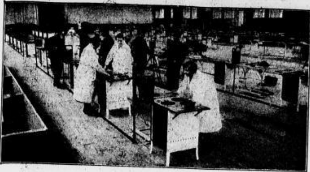
Die Anstellung der Kochherde Im Rahmen der heute beginnenden Reichsgastwirtsmesse in Berlin wird in einer der Ausstellungshallen am Kaiserdamm ein siebenköpfiges Gericht von Männern und Frauen verhandelt. (Siehe auch den Bericht im allgemeinen Teil der heutigen Ausgabe)