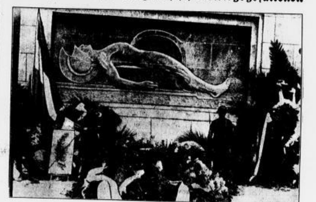
In Athen ist dieser Tage ein Denkmal für die Kriegesgefallenen Griechenlands enthüllt worden.