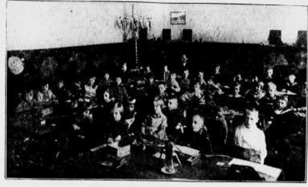
Kreisel in der Dresdner Versuchshöhle