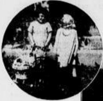
Schwarz und blond Kleine Frankenmädchen