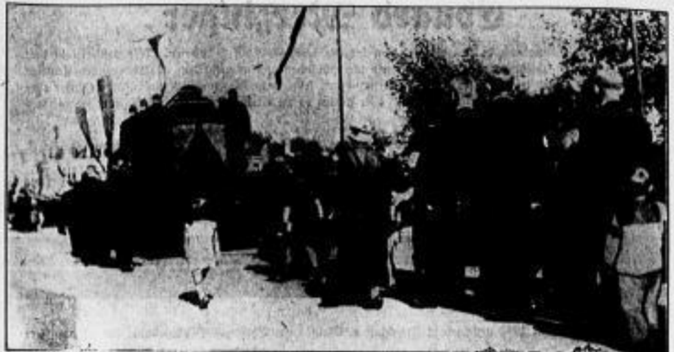
In Jatu fand, wie berichtet, die Besehung des ideologischen Großindustriellen Batas statt, der bei einem Flugzeugunglück ums Leben kam.

seiner Verteidiger gegen Scherheitsleistung von 10000 Mark wieder auf freien Fuß gesetzt worden. Wegen des ausbleiben mit dem Prinzen zusammenhängenden Dr. K. I. n. i. g. hat sich das Gericht keine Entscheidung über eine Haftentlassung bis Anfang der Woche vorbehalten.