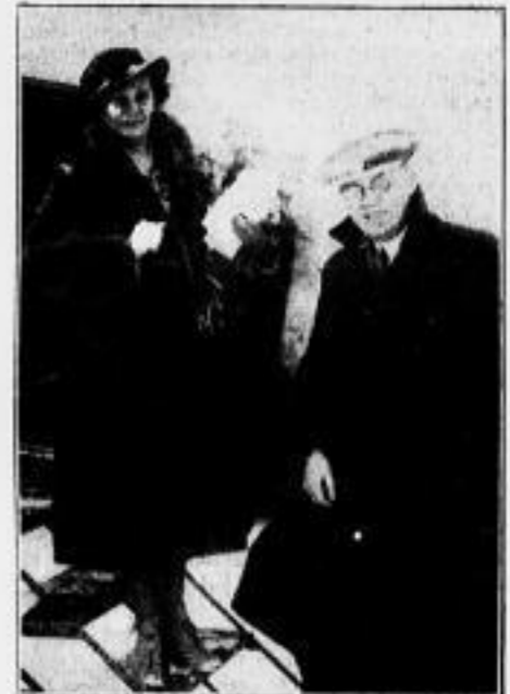
12 000-Kilometer-Reise zur Saar