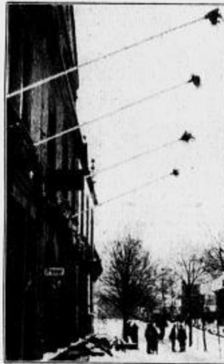
Das Flaggensort bekanntlich durch einen Erlass der Regierungskommission verboten. Aber die Saarländer haben sich zu helfen gewußt: überall sind schon die Fahnenstangen angebracht, die mit Tauwergeln geschmückt sind.