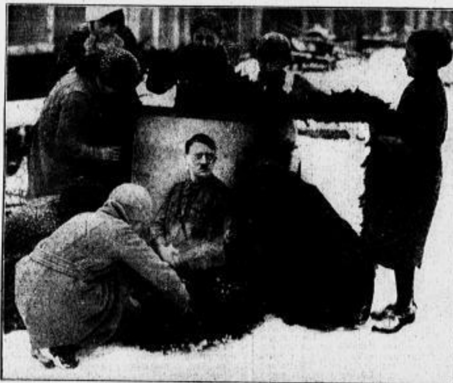
Vorbereitungen zu den Siegesfeiern: Kinder in dem Grenzort Berns im Kreise Saar-Louis beim Schmücken eines Bildes des Führers.