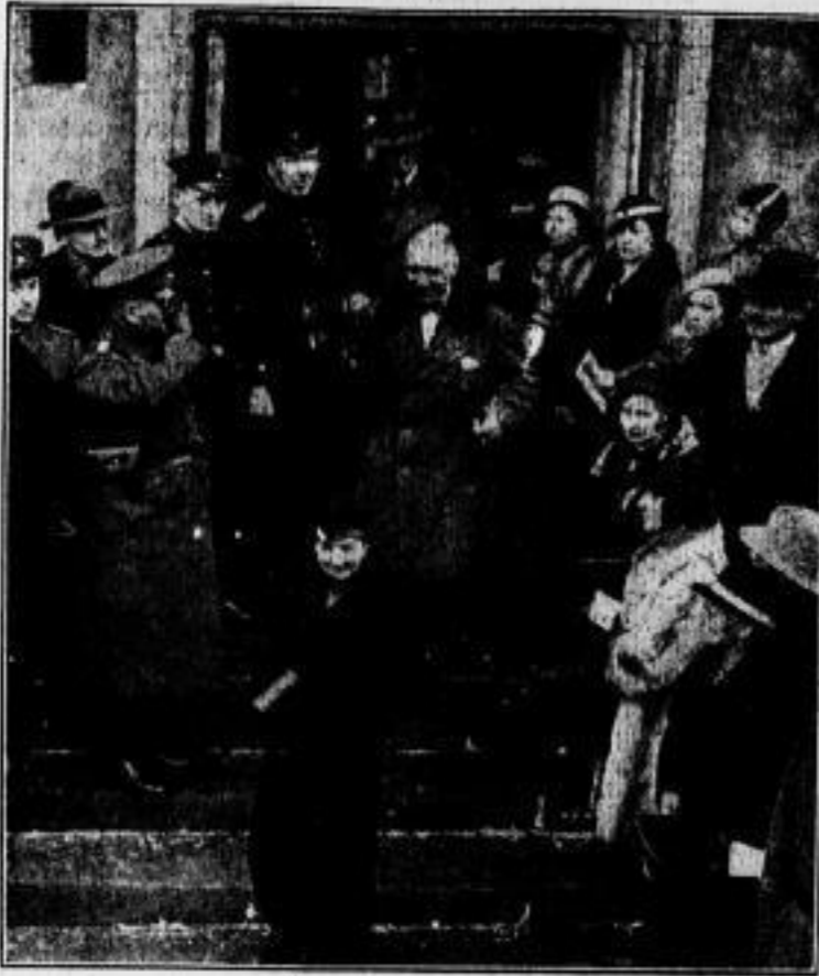
Gesandter v. Papen und Frau v. Papen verließen nach der Abstimmung ihr Stimmlokal.