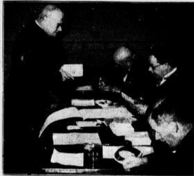
Der bekannte Vorkämpfer der Saardeutschen und Großindustrielle Noehling im Stimmlokal.