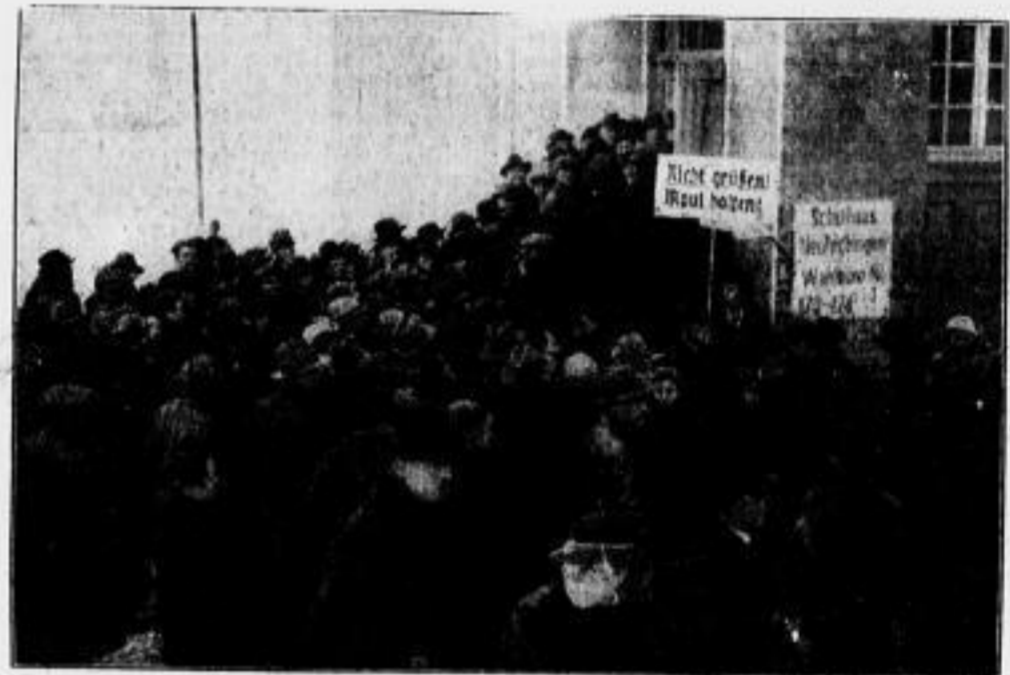
Riesiger Andrang zu den Stimmlokalen Weitere Bilder finden sich auf Seite 3