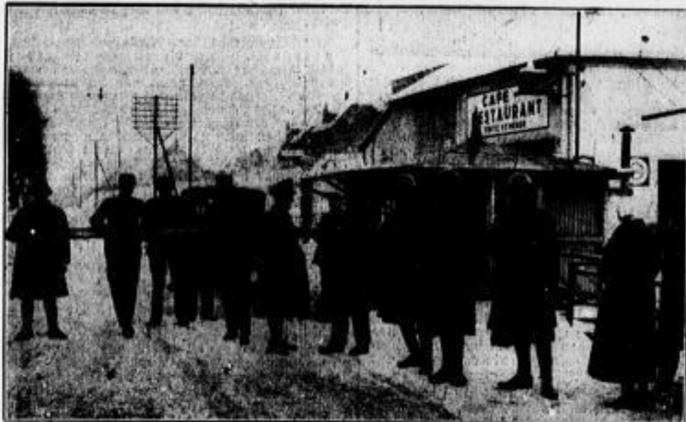
Die internationalen Polizeitruppen waren vom frühen Morgen an in höchster Bereitschaft; eingeleitet wurden sie aber nirgends. Das Bild zeigt holländische Truppen an der Grenze bei Jüvelbrücken.