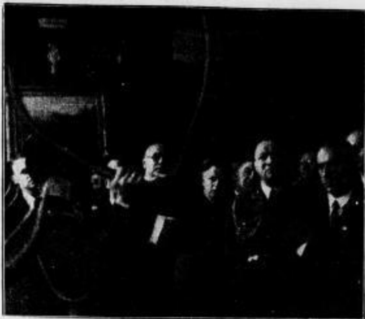
Der Oberforstmeister zeigt dem Landesjägermeister das beste Geweih seit 1925

Dem Deutschen Wald und seinen Tieren mißt man eine ganz andere Bedeutung als in früheren Zeiten zu, die oftmals Raubbau an diesen hohen volkswirtschaftlichen Werten trieben. Wald und Wild sind nach nationalsozialistischer Weltanschauung und Wirtschaftsauffassung fast barbare Klagen einquäler, das unter sachverständiger Pflege entwickelt und erhalten werden muß. Ebenso wie kein Baum unnütz geschlagen werden oder überaltert darf, ist auch der Wildbestand nach Umfang und Qualität auf das genaueste zu überwachen und, wo es angeht, zu hegen. Vor allem muß keine Stärke auf einem den wertvollen Wild, dem unschätzblichen Reichtum gehalten werden.