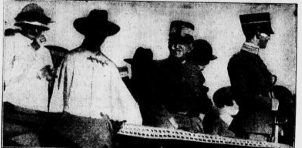
Vor zehn Jahren: der damalige Negus von Abessinien, Haile Selassie, leitet Kaiser Karl...