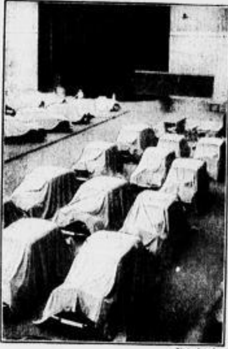
Die Wagen in Erwartung der Erläuterung