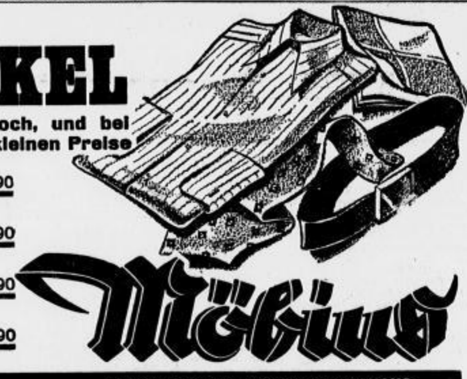
DAS DEUTSCHE TEXTIL-SPEZIALHAUS