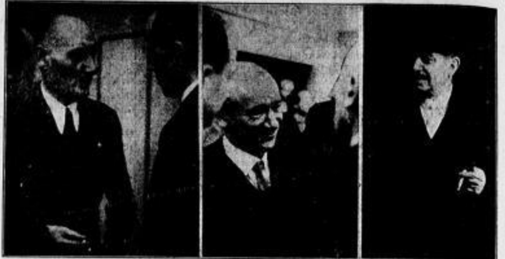
"Schmappschiffe" aus den Wandbesitzungen des Völkerverbandspalastes...