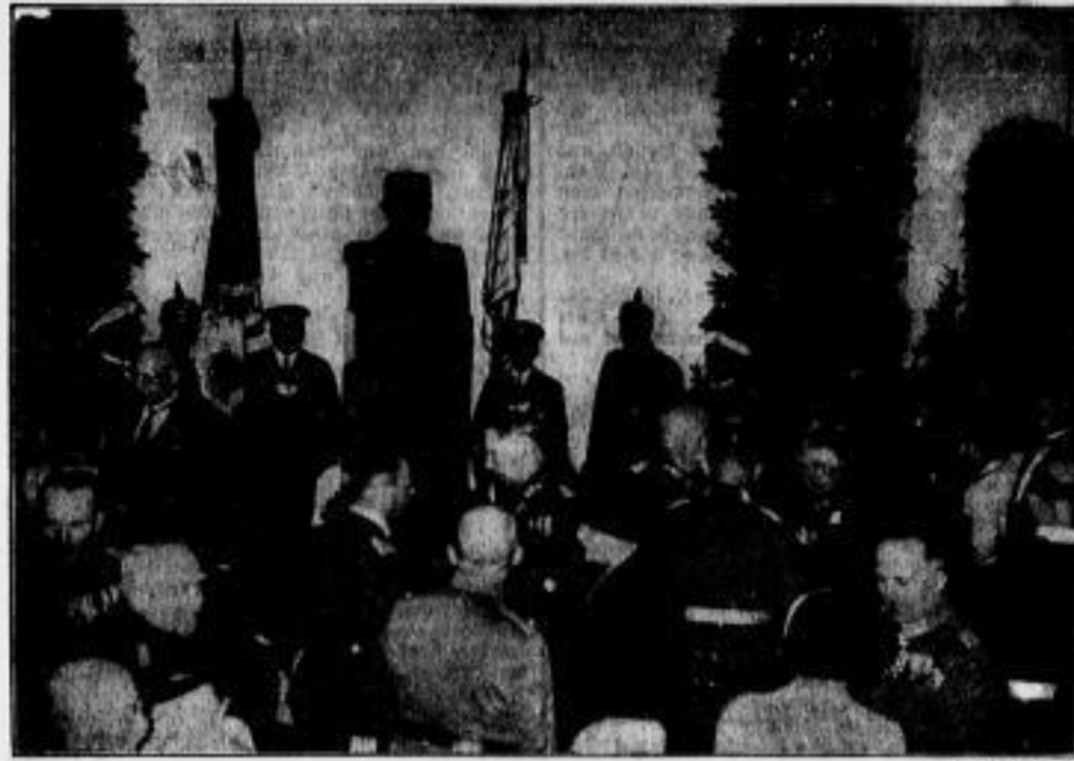
In einer eindrucksvollen Weihstunde wurde am Donnerstagabend in der Audienzhalle des Berliner Zeughauses eine überaus ergötzliche Weihnachtsfeier veranstaltet... General v. Bredow...