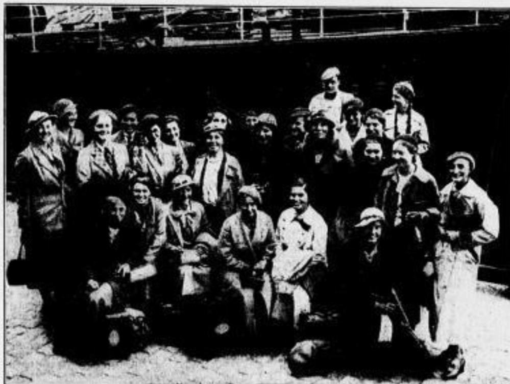
Am Donnerstagabend trafen auf dem Dresdner Hauptbahnhof elf schottische Schülerinnen ein, zusammen mit den elf Dresdner Schülerinnen, die im Wege des Schüleraustauschs bei ihnen zu Gast gewesen waren. — Unter Bild zeigt Gäste und Gastgeber vor dem Dampfer „Stadtpost“, der die jungen Reisenden von England nach Hamburg brachte.