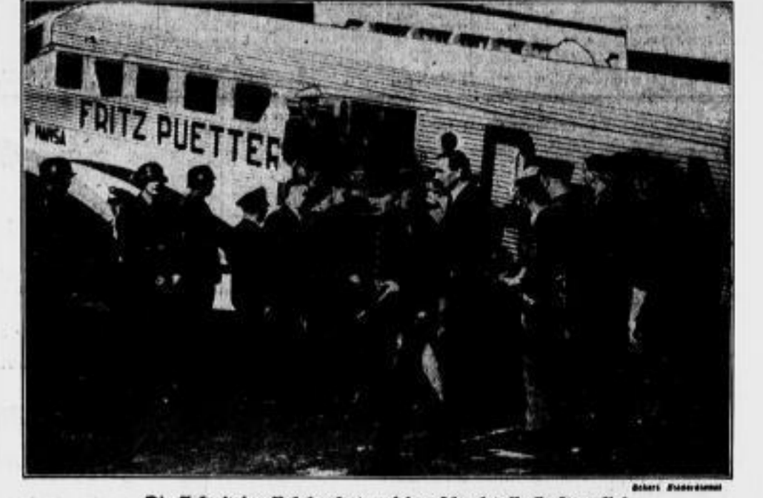
Die Ankunft der Ruhrbergleute auf dem Flugplatz Berlin-Tempelhof

Die Aufräumungsarbeiten an dem eingestürzten Tunnel der Nord-Ost-Bahn sind in den Abendstunden des Mittwoch und in der Nacht erheblich vorgeschritten. Ein großer Teil der Trümmer und sonstigen Trümmer auf der Nordseite der Einsturzungsstelle konnte mit Hilfe von Schmelzapparaten beseitigt werden. Wertvoll ist es vor allem, daß die Pumpen in Ordnung gehalten werden konnten. Wenn Brunnen sind durch das Unglück stillgelegt worden. An ihrer Stelle sind in der Zwischenzeit Feuerwehre und Kreiselpumpen eingesetzt worden, und man war imstande, das Grundwasser einem halben Meter unter der Tunnelsohle, die sich in 14 Meter Tiefe befindet, zu halten. Seit dem späten Nachmittag stand im Mittelpunkt der Aufräumungsarbeiten der Stoßkammer der zwölf Ruhrbergleute, die in der Nacht durch eine Rettungsmannschaft aus Biege-Stein, so erbe bei Hannover verfrachtet wurden. Der Stoßkammer wird von der Schichtsohle in die Trümmer und Schuttmassen vorgefahren. Es muß dabei mit äußerster Vorsicht vorgegangen werden. Der Stoßkammer ist sehr schmal, und es können jeweils nur zwei Mann nebeneinander arbeiten.