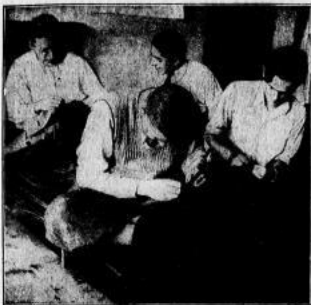
Die künftigen Meister im Schneiderh

Hunderter und aber Hunderte Schüler sind durch die Europäische Modenakademie gegangen, Schüler aus