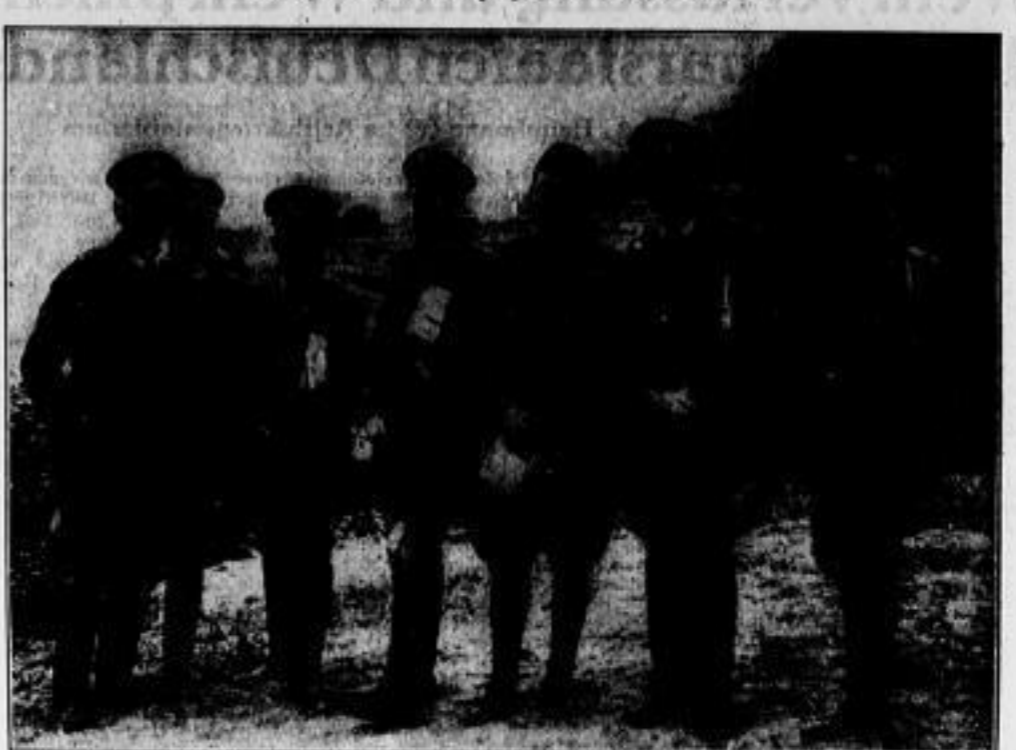
Die diese Tage mit größtem Aufwand durchgeführten italienischen Manöver in der Nähe von Voss sind die Aufgabe, die Schnelligkeit und Schlagkraft der motorisierten Truppe zu prüfen. Die Militärattachés der in Rom akkreditierten Mächte nahmen mit großem Interesse an den Manövern teil.