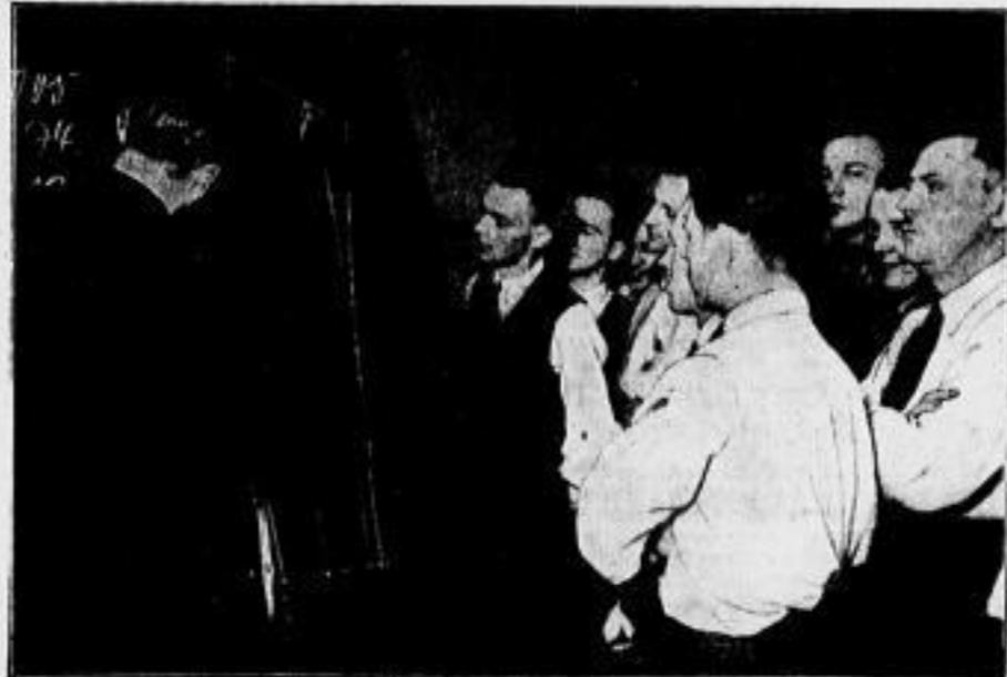
Die Geometrie des Hofs