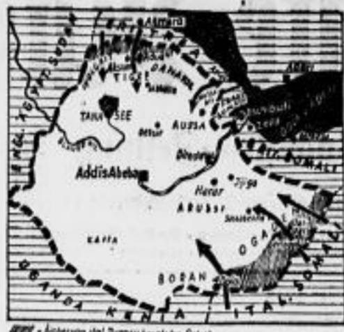
Abessinien nach dem gegenwärtigen Stand. Die Pfeile zeigen die Vorwärtswirksamkeit an.

im Süden über Dolo an der Grenze von Britisch-Somaliland. Auch hier hat man noch nicht davon gehört, daß die Italiener bereits größere Erfolge erzielt hätten. Wie gering der bisher erreichte Geländegewinn im Verhältnis zu der gewaltigen Ausdehnung des Landes überhaupt ist und wie treffend das Wort, daß der Krieg eigentlich noch gar nicht begonnen habe, das zeigt schon ein flüchtiger Blick auf die Karte.