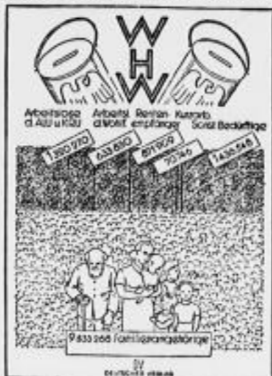
men, doch noch immer leiden Millionen unserer Volksgenossen Not. Das Winterhilfswerk 1935/36 wird dafür sorgen, daß im neuen Deutschland niemand Not leidet, niemand hungert und niemand friert.

Nahzu 10 Millionen Volksgenossen wurden im letzten Winter durch das Winterhilfswerk unterstützt. Die Arbeitslosigkeit hat inzwischen weiter abgenommen.