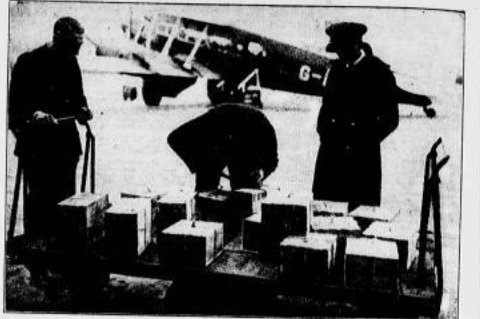
Die Goldbullen im Fliegelsaal von Le Bourget werden plombiert. Aus Frankreich werden, wie berichtet, wieder erhebliche Goldmengen nach dem Ausland befördert.