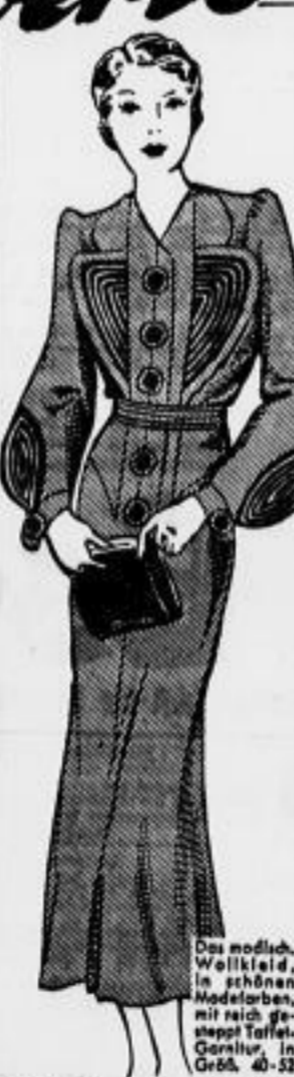
Das modisch, weiche, in schönen, modischen, mit reich gestepptem Taillen, Garnitur, in Größe 40-52 19 75