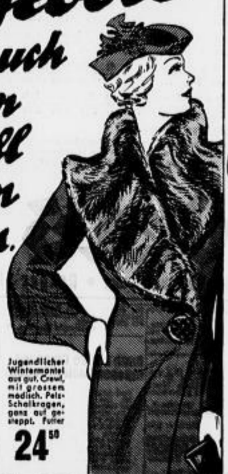
Jugendlicher Wintermantel aus gutem, warmem, modischem, feinem Schellwolle, ganz auf gepu. Futter 24 50

Beachtungswerte Angebote die auch Ihren Beifall finden dürften.