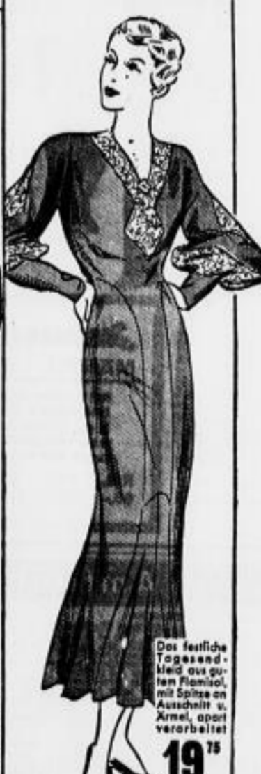
Das feine, Tagesabendkleid aus gutem Material, mit Spitze an Ausschnitt u. Ärmel, apert verarbeitet 19 75