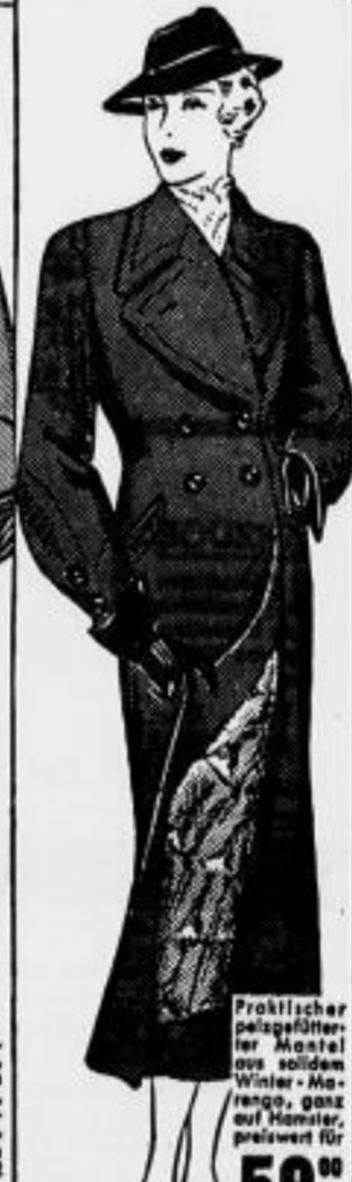
Praktischer pelzgefütterter Mantel aus solidem Winter-Material, ganz auf Garnitur, preiswert für 59 00