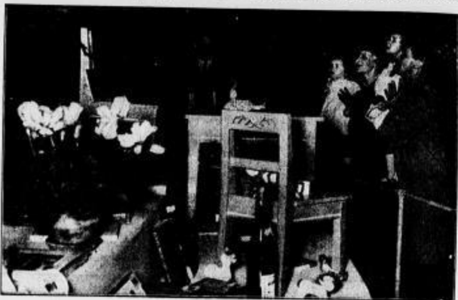
Am Montagmorgen hatte Reichsminister Dr. Goebbels mit seiner Familie dem Weihnachtsschmaus am Ralfertdamm einen Besuch ab