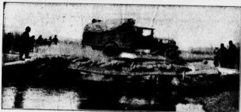
Brücke südlich von Korla. Nach Sven Hedin „Die Stadt des Großen Pferdes“, Mit Genehmigung des Verlags H. W. Brockhaus, Leipzig

Die Ausfälle, die wir beabsichtigten, überforderten sich. Die Spannungen hatten sich so sehr gelockert, umschlingt durch Korla zu kommen? Nun sind wir an der Brücke. Soldaten stehen nicht dort, nur einige zerlumpte Jungen. Die Heiler schaukeln, die Kräftigen schaukeln über die Brücke. Sie hält. Die ganze Kolonne ist glücklich auf dem andern Ufer!