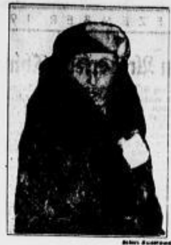
Die Schwester des Königs von England, Prinzessin Victoria, ist, wie berichtet, am 3. Dezember 67 Jahren erreicht.