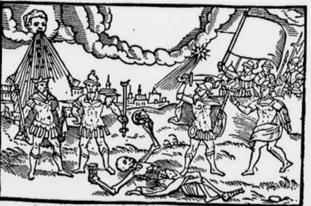
Eine „erschreckliche“ Prophezelung

Die Entwicklung der Zeitschriftenpresse seit jenem ersten Flugblatt läßt sich auf manchem Handgang