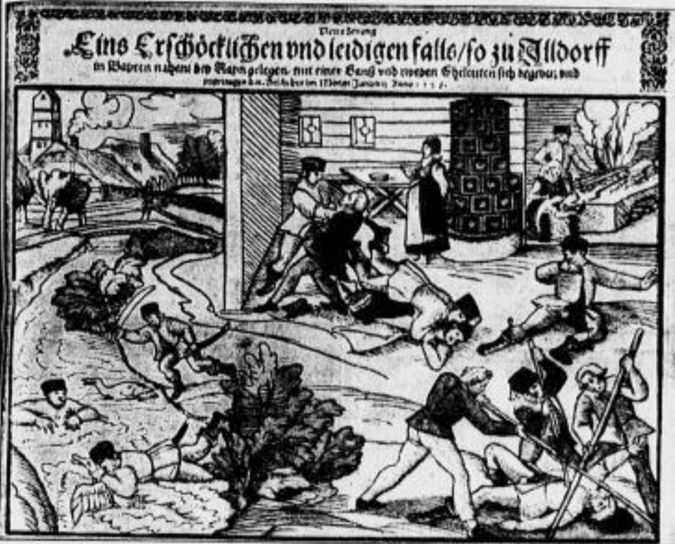
Eins Erschrocklichen und leidigen Falle/so zu Aldorff im Bapern nahert der Stern gezogen, mit einer Band von weissen Schützen sich begibt, und

Reichstags, Fürstentagungen, Städtebundversammlungen, Ritterturniere, Volksfeste treten besonders Gelegenheiten zur Darstellung dieser neuen Zeitungen, von denen das kleine gedruckte Blatt aus dem