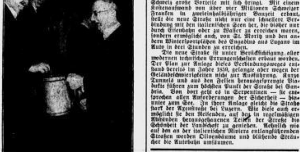
Reichsbankpräsident Dr. Schacht stellte sich bereit am gestrigen Freitag in den Dienst der Winterhilfe und sammelte im Börsegebäude in Berlin.