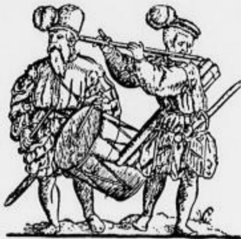
Robrende Reute — die ersten Zeitungsbesitzer Robrende Reute waren es, die nach der Gründung der Buchdruckerkunst die ersten Bilderblätter im Umlauf setzten, und zwar zunächst in Form von Volksliedern. Die Wochenscheine auf unserm Bild stimmen „ein neues Lied der Stadt Galsold“ an.

Geschiedt 1335 zu Eberls Widenbren, Wolln