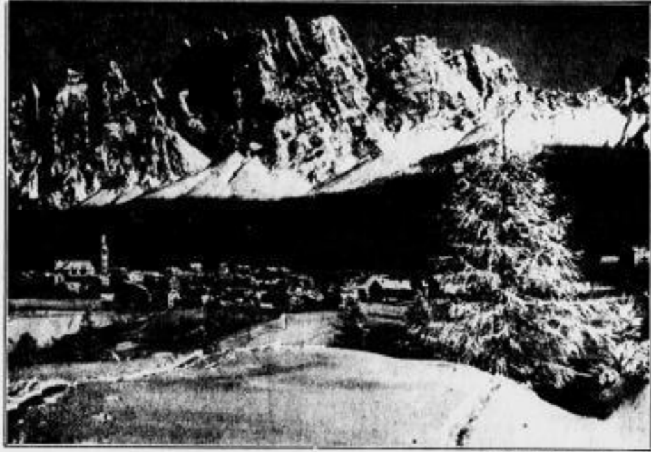
Corona d'Ampezzo im Schnee

Die Glatzer Gebirge haben ihren sportlichen Reiz nicht in der Höhe allein. Und jeder in den Gebirgen und in den Gebirgen hat seine eigene Schönheit. Die Riesengebirge hat die Schneeflocke (1000 Meter), die Glatzer Gebirge hat die Schneeflocke (1000 Meter), die Waldenauer Gebirge hat die Schneeflocke (1000 Meter), die Fichtengebirge hat die Schneeflocke (1000 Meter). Wer sich aber ganz den Riesengebirgen verschrieben hat, wird mit der Bahn hinauf zum höchsten Punkt der Glatzer Gebirge, dem Riesenscharten (1424 Meter), und weiter zum Riesenscharten (1424 Meter) und weiter zum Riesenscharten (1424 Meter) und weiter zum Riesenscharten (1424 Meter).