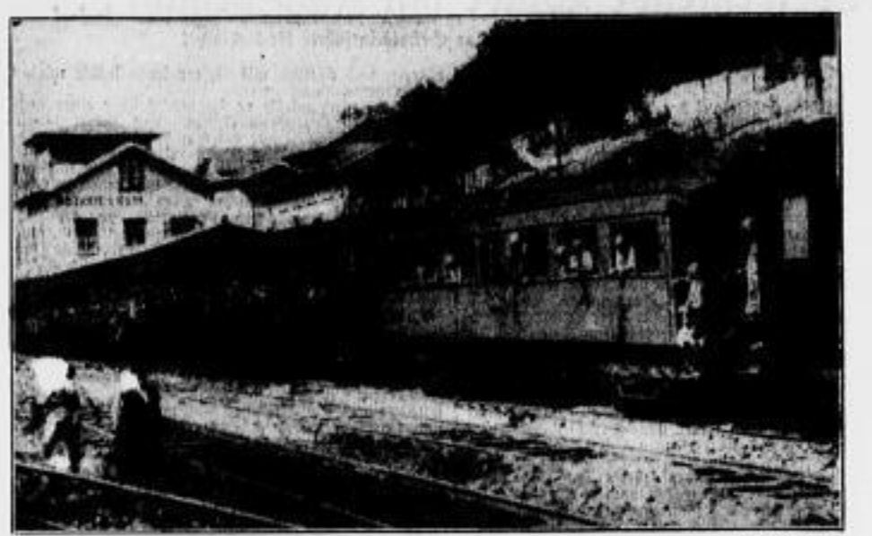
Ein Zug mit republikanischen Truppen kurz vor der Einnahme in das Kufflandgebiet. Die von kommunistischen Partisanen angelegten Schienen Unruhen im Juniern Brasiliens wurden, wie berichtet, durch die republikanischen Truppen niedergeschlagen.