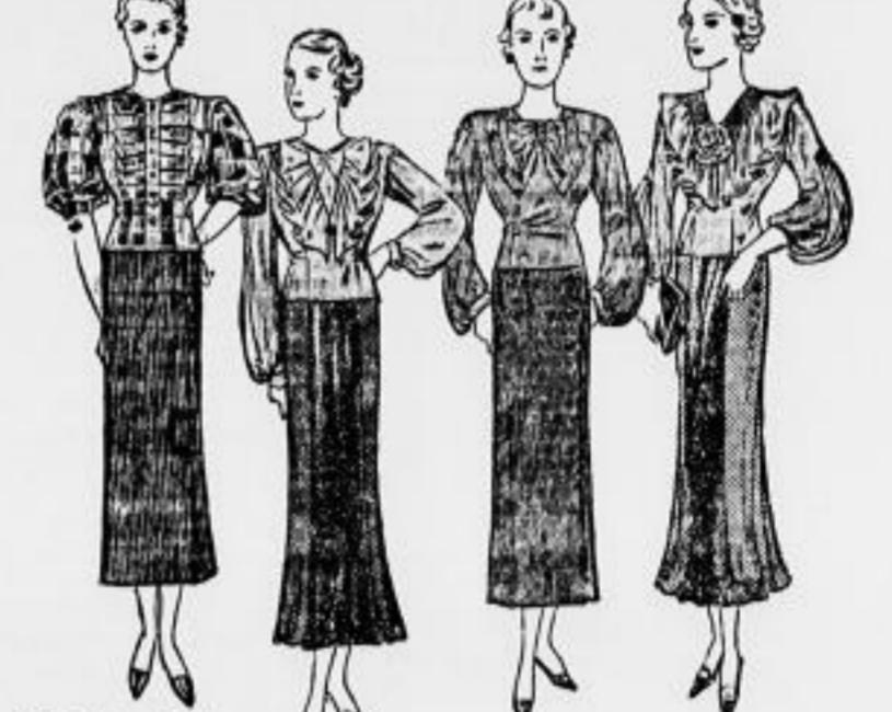
Bluse, dunkel... Bluse, hell... Bluse, grau... Bluse, rot...

Jede unserer entzückenden Damen zeigt eine andere reizende Form und eine neue Farbe