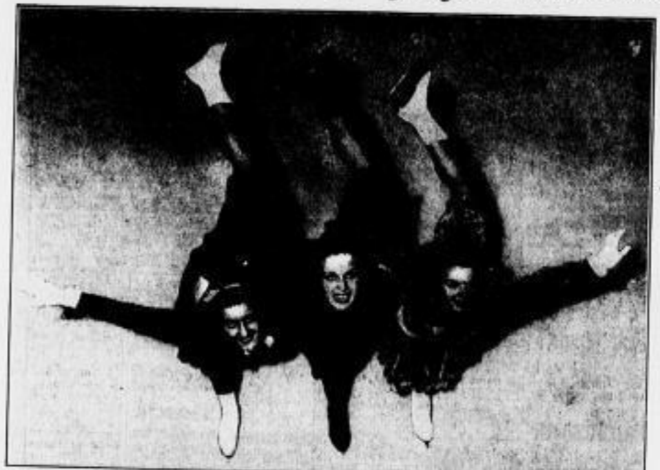
Die amerikanische Teilnehmer an den Olympischen Winterspielen...