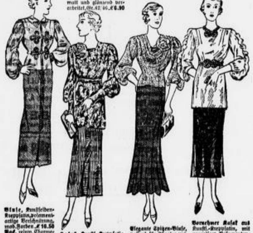
Bluse, dunkel... Bluse, hell... Bluse, grau... Bluse, rot...