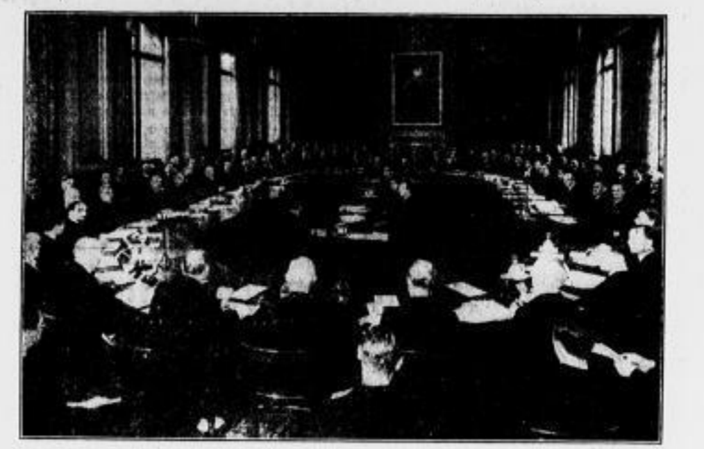
Unter dem Vorsitz Baldwin trat, wie berichtet, am Montag in London die Flottenkonferenz an.