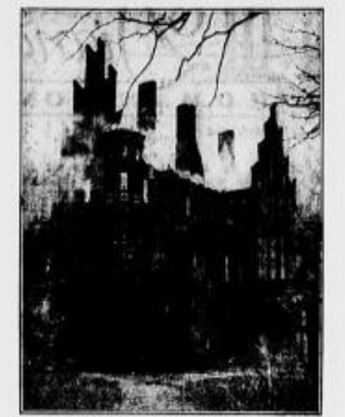
Eine der bedeutendsten historischen Bauten Pommerns, das Schloß Panitzsch im Kreis Saargitz, wurde, wie berichtet, am Dienstag von einem Großfeuer heimgesucht.

Handes und der Gefahr, in der keine Passagiere schwanden, haben dem inprettigen Rieger die Kraft, seine Maschine nach Verletzung zu reparieren und damit seinen Fluggast den Boden zu retten.