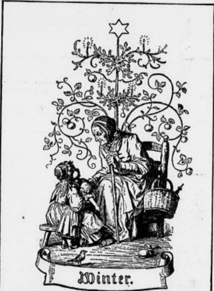
...und in Herz und Haus hinein glänzt der helle Weihnachtsstern."

Daß der Nadelbaum trotz der anfänglichen Ablehnung der Kirche so tief in unserm Bewußtsein und im Volksebewußtsein gefestigt hat, vermerken wir um so mehr, als seine Einführung und Verbreitung in der Zeit der Aufklärung geschah, die nicht eben fruchtbar an neuen religiösen und volkstümlichen Sitten zu nennen ist. Im Zunftlokal des brennenden Baumes legt etwas von der Götteranbetung der nordischen Völker fort, die sich schon in Urzeiten die flammende Weltscheibe