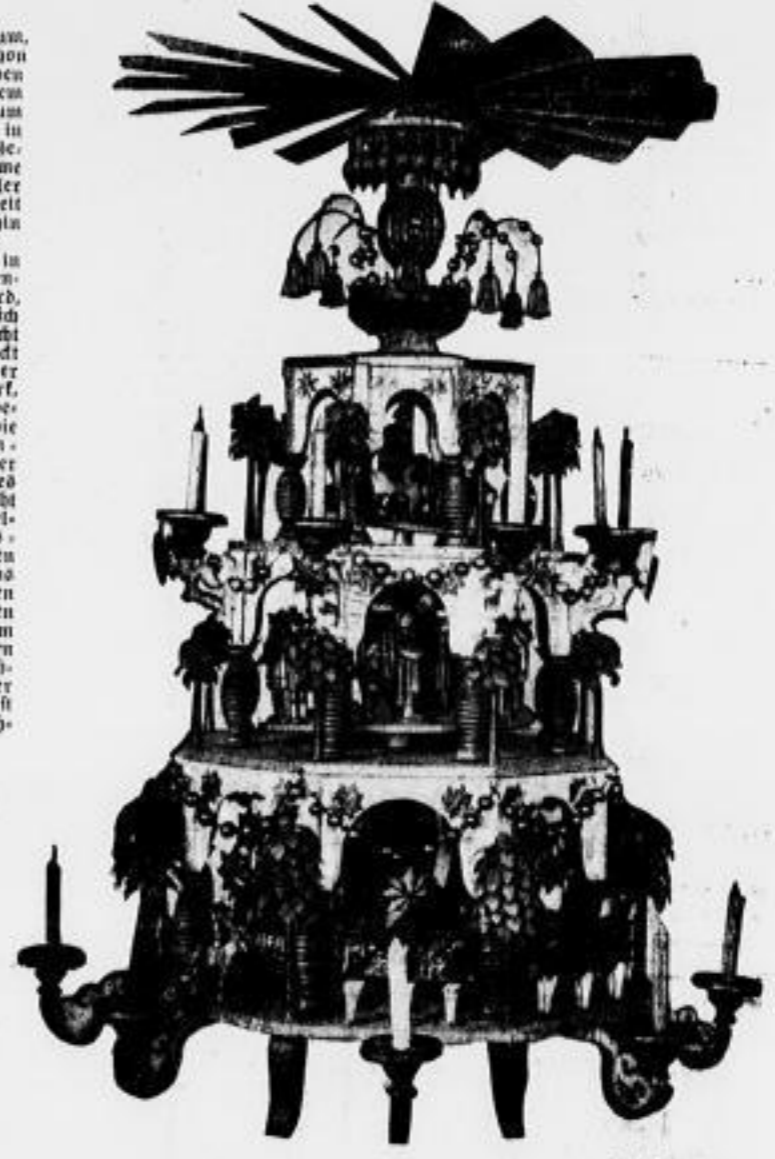
Eine große Weihnachtspyramide (aus dem Colar - Geffert - Museum)

den dickeren Tannenbaum, sondern man legt schon im jungen Stamm, aus einem Astlich- oder Weichelbaum in einer Kammerode in einen arden Topf. Gewöhnlich stehen diese Bäume die Weihnachtszeit in voller Blüte und dehnen sich weit an der Zimmerdecke hin aus. Aus diesem Bericht, in dem von dickeren Tannenbäumen gesprochen wird, sehen wir, daß anfänglich der Tannenbaum noch nicht mit Lichtern geschmückt wurde. Folgerung war er von Leber mit Zuckerwerk, Nüssen und Äpfeln behangen. Wodurch aber die Äpfel am Tannenbaum kommen, darüber läßt sich nichts Gewisses sagen. Eine Vermutung geht dahin, daß sie vom mittelalterlichen Paradiessozial übernommen worden sind. Bei diesem Spiel, das ursprünglich in den Kirchen aufgeführt wurde, bringen die Darsteller den Baum der Erkenntnis auf den Altarraum, wo die Himmelskrona steht. Dieser Baum der Erkenntnis ist seit Jahrhunderten ein Zehn-