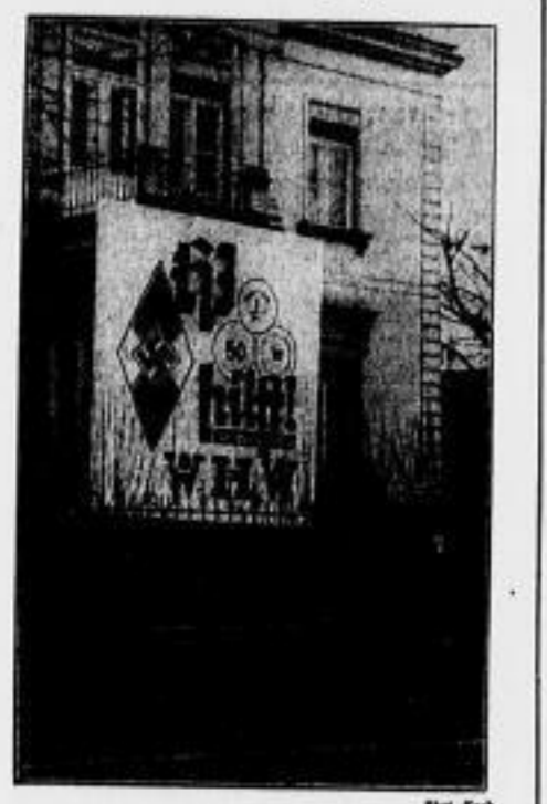
Das Haus der Kreisleitung der ROHM.