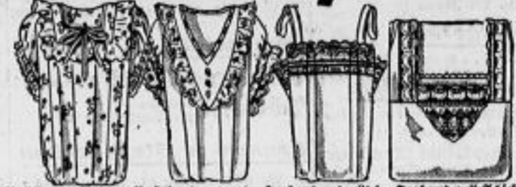
Nachthemd, Waidhühnerleder, durchgehend bunt geblüht, mit Puffarm... K 3.50