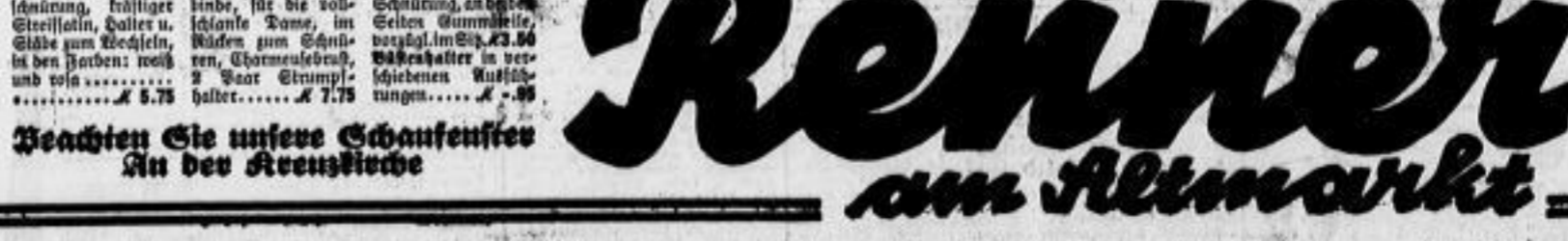
Korsett mit Rückenverzierungen, halbtüchtiger Steilkragen, Gürtel u. Gürtel zum Bedecken, in den Farben weiß und rosa... K 5.75