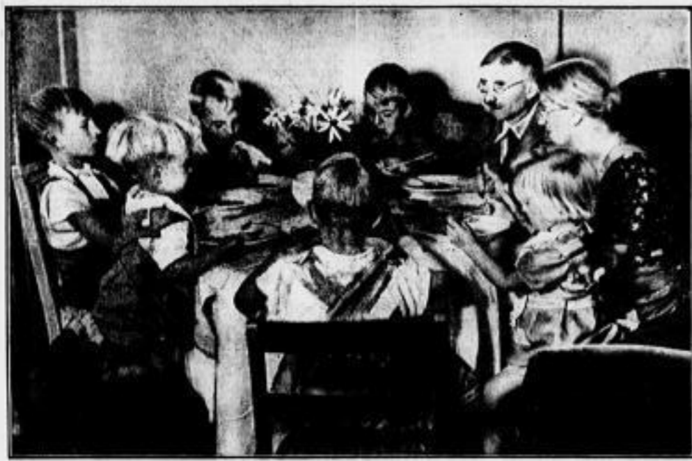
Die „Tafelrunde“ — ohne das Nesthäkchen im Bautzener Doktorhaus

ein tüchtiges Arbeitspensum hinter sich und noch ein sehr angenehmes vor sich liegen. Man begreift zunächst überhaupt nicht, wie es einer Mutter von fünf Kindern möglich ist, all die Aufgaben, die Haushalt und Erziehung mit sich bringen, in vierzehn Tagstunden zu erledigen, zumal in der Abgeschiedenheit eines kleinen Landortes, wo durchaus nicht alles, was man braucht, im Handumdrehen zu haben ist. Aber es geht, geht anscheinend ganz vorzüglich. Denn der Mann blüht und blüht, die Kinder sind gepflegt, rotwangig, nett gefeiert. Eine würdige Frau- und Väterlichkeit dampft auf dem Herd.