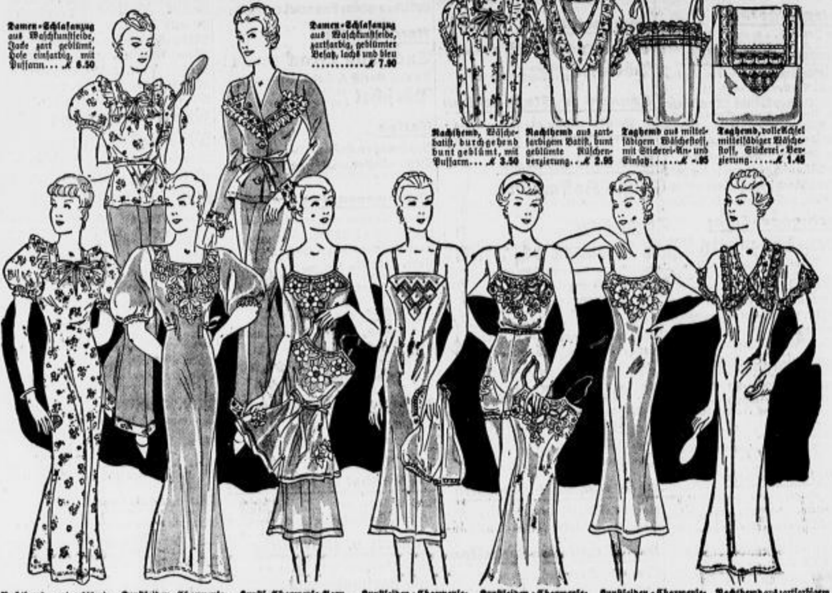
Damen-Nachthemd aus Waidhühnerleder, Farbe nach geblüht, Güte einfarbig, mit Puffarm... K 6.50