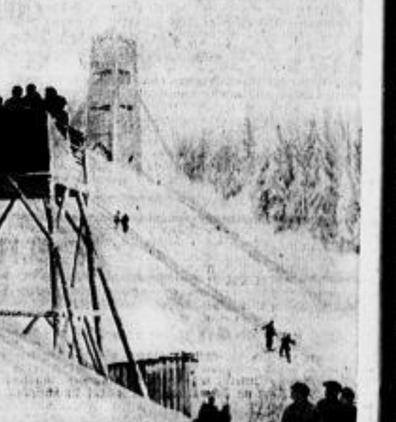
Wenn erst unsere Skijugend groß ist... Erstaunlich ist, was unser Skinachwuchs in jeglichen Skikämpfen leistet...

am Sonntag waren: Mittelklasse: Frauen, Klasse I: 1. G.