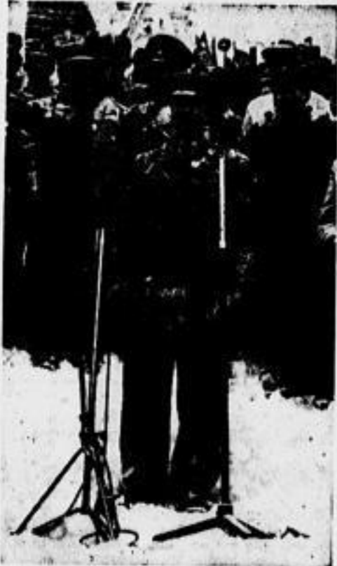
Der Reichsstatthalter und Gauleiter bei der Weihe der Martin-Mutschmann-Schanze