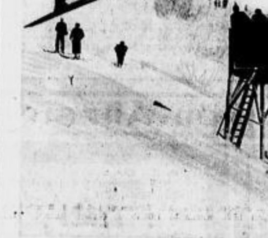
Wenn erst unsere Skijugend groß ist... Erstaunlich ist, was unser Skinachwuchs in jeglichen Skikämpfen leistet...