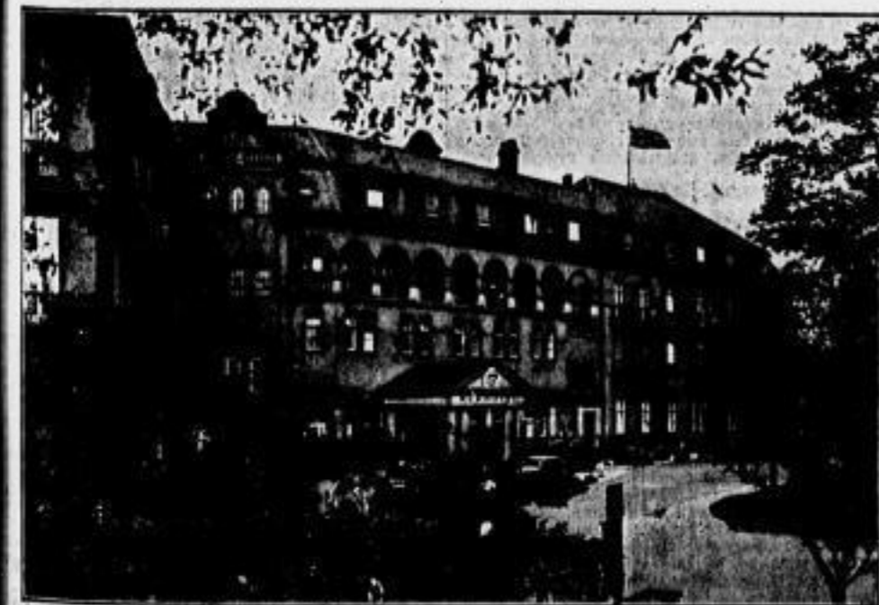
Kurhotel Petersberg bei Königswinter, gegenüber Godesberg, wo Premierminister Chamberlain Aufenthalt nehmen wird

„Der Ministerpräsident und der deutsche Führer und Reichkanzler haben beschlossen, ihre Unterhaltung, die sie in Vertretung begonnen haben, am Donnerstag, dem 22. Sep-