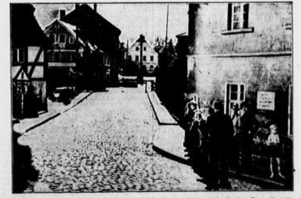
Das deutsche Grenzstädtchen Seidenberg, Stätte des unerhörten tschechischen Feuerüberfalls...