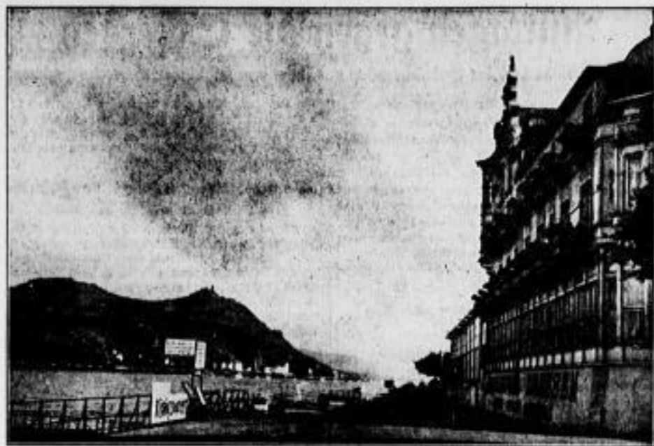
Das Rheinhotel Dreesen in Gaderberg, gegenüber dem Drachenfels...