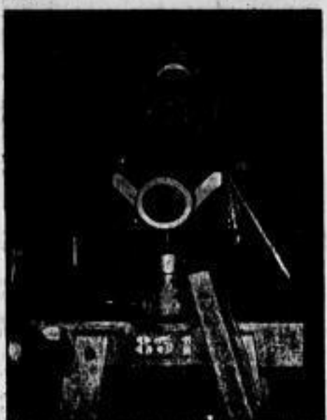
Rechts: Prüfung eines Geschützrohres. Links: Montage einer leichten Feldhaubitze. Unten: Stapel von Seelenrohren.