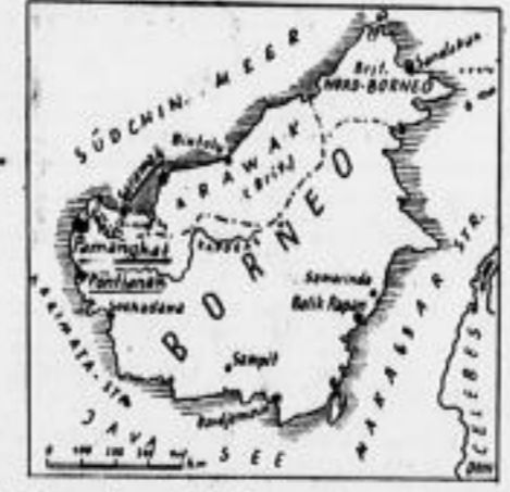
Die japanischen Truppen sind an allen Fronten weiterhin erfolgreich.