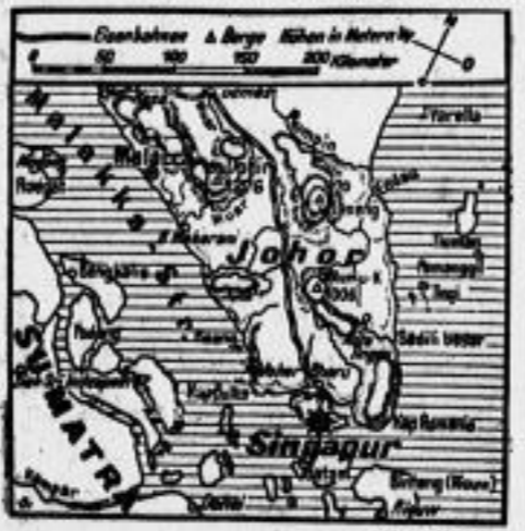
Die japanischen Truppen sind an allen Fronten weiterhin erfolgreich.

× Tokio, 30. Januar. Dem zunächst als vermisst gemeldeten Sultan von Johore, Ibrahim, ist es gelungen, dem Agenten des Secret Service zu entkommen. Wie Dorel von einem japanischen Staatsrat an der Malakka-Front berichtet, ist Sultan Ibrahim am 28. Januar bei Singapur in die Hände der japanischen Truppen gelangt. Sultan Ibrahim soll sich dem Sultan von Johore angeschlossen haben, um die japanischen Truppen zu unterstützen. Die japanischen Truppen sind in Singapur eingetroffen. Sultan Ibrahim soll sich dem Sultan von Johore angeschlossen haben, um die japanischen Truppen zu unterstützen.