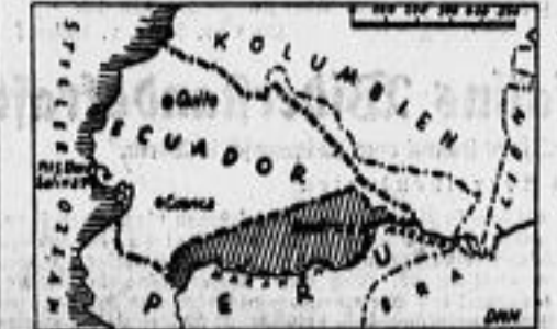
Das umstrittene Gebiet gestrichelt