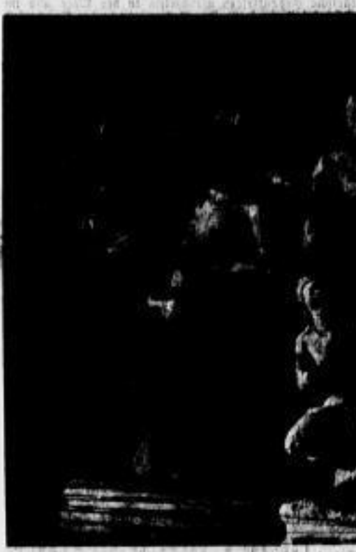
Aus dem Felsen gehauene Tempelplastik von Elephanta bei Bombay