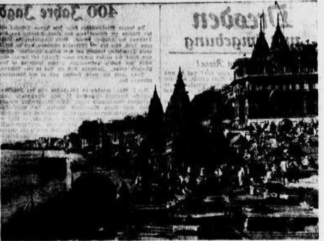
Am Ganges in Benares Jeder Hindu pilgert wenigstens einmal in seinem Leben nach Benares...