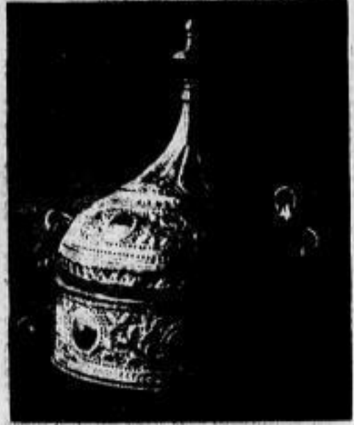
Gopriehener Behälter aus Kupfer (Dahli)