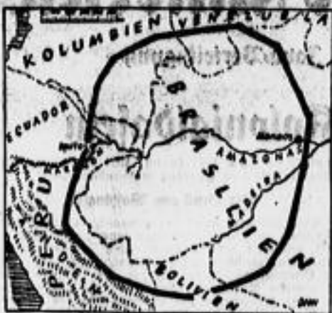
Die Ausdehnung des geplanten Amazonas-Imperiums

Und während nun die Lösung dieser Konflikte schon bevorzugen zu werden beginnt, während die Welt in der ersten Hälfte des Jahres 1942 im Stillstand stehen wird, während die Welt in der ersten Hälfte des Jahres 1942 im Stillstand stehen wird.