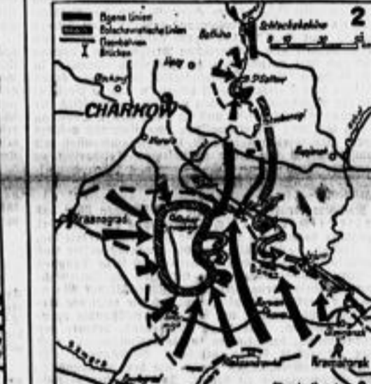
Der Verlauf der Schlacht bis zum 24. Mai, die am 29. Mai mit der völligen Vernichtung der südlich Charkow eingeschlossenen sowjetischen Armeen endete