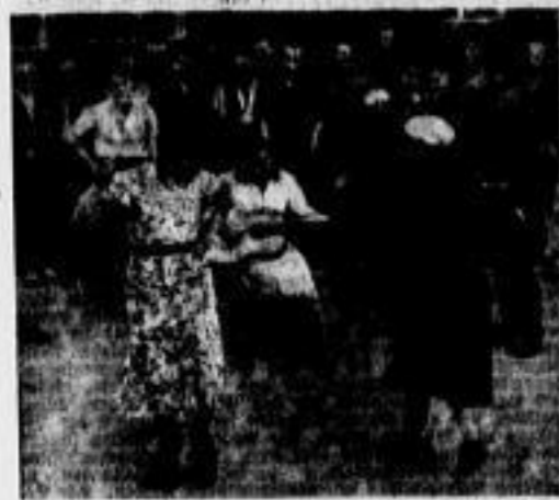
Ostarbeiterinnen zeigen ihre heimlichen Tänze

Die Arbeiterinnen aus ganz Europa schaffen für den Endkrieg, ihre Betreuung durch die Deutsche Arbeitsfront. Die Arbeiterinnen aus ganz Europa schaffen für den Endkrieg, ihre Betreuung durch die Deutsche Arbeitsfront.