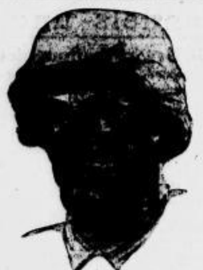
Antlitz eines Kämpfers

Die Ausstellung zeigt die Entwicklung der Kampfkunst von den Anfängen bis zur Gegenwart. Die Ausstellung zeigt die Entwicklung der Kampfkunst von den Anfängen bis zur Gegenwart.