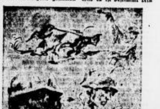
Petersen: Kämpfer der Waffen-SS

Die Ausstellung zeigt die Vernichtung sowjetischer Panzer im Kessel. Die Ausstellung zeigt die Vernichtung sowjetischer Panzer im Kessel.