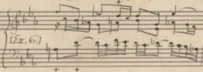
Table 18 (wie im Original bei Beccardis):

wird, nach meinem Gefühl corrigiert, bei Beccardis aufgeführt sein mit falscher Fingering.