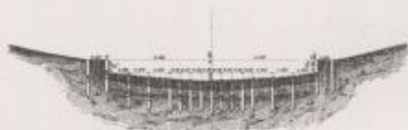
Fig. 6.— Clayonnage transversal, élévation. Coupe suivant cd du plan fig. 1.