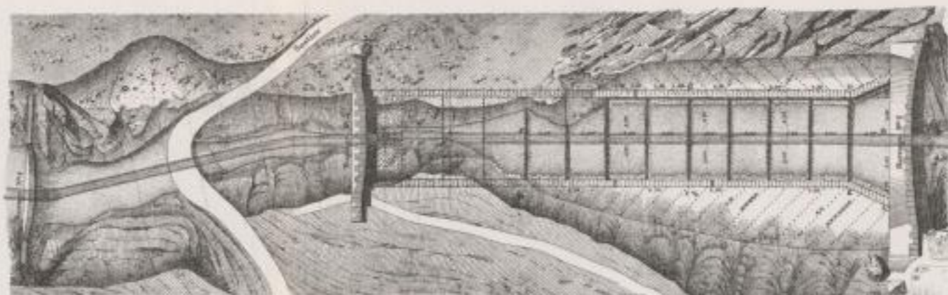
Fig. 1.— Plan du torrent du Bourgot, entre les barrages n° 2 et 4.