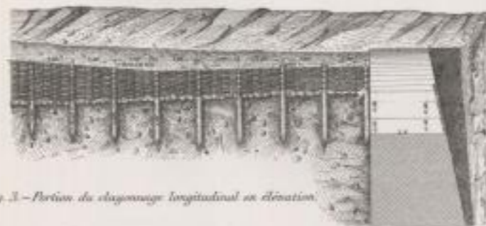
Fig. 3.— Portion du clayonnage longitudinal en élévation.