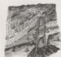
Fig. 6. — Barrage en clayonnage (coupe sur l'axe).