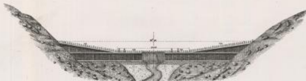
Fig. 4. — Élévation.