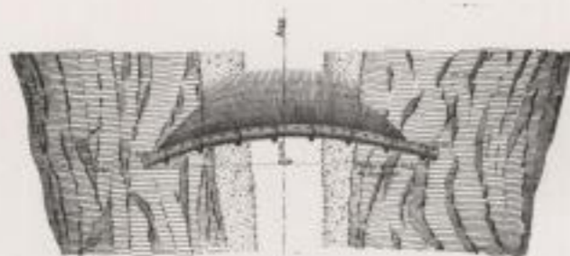
Fig. 2. — Plan.