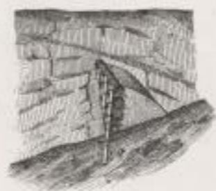
Fig. 3. — Barrage en fascinage (coupe suivant AB).