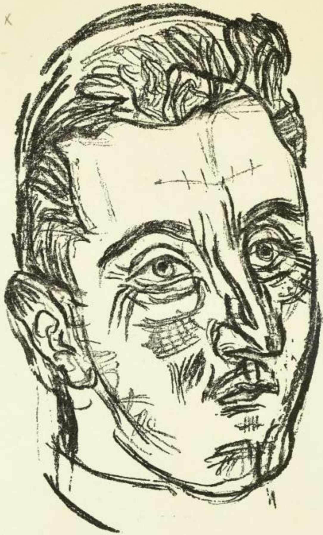
NACH EINER LITHOGRAPHIE VON OSKAR KOKOSCHKA