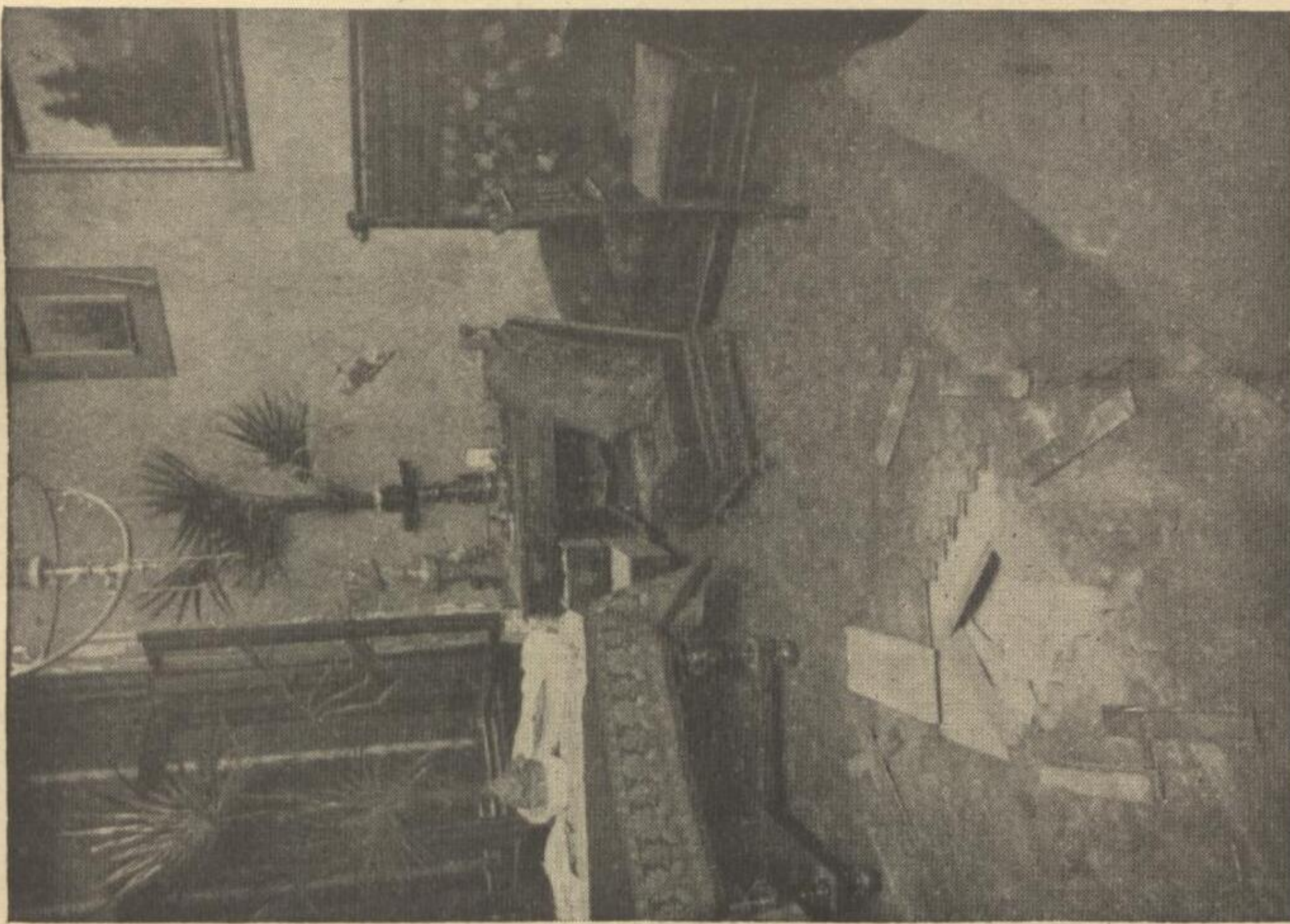
Fig. 7. Einbruch durch Trepanation des Plafond.

hat schon im Jahre 1839 in der Pairekammer von Frankreich in seinem Berichte, mit welchem er der Regierung den Ankauf der Erfindung Daguerres empfahl, gesagt: