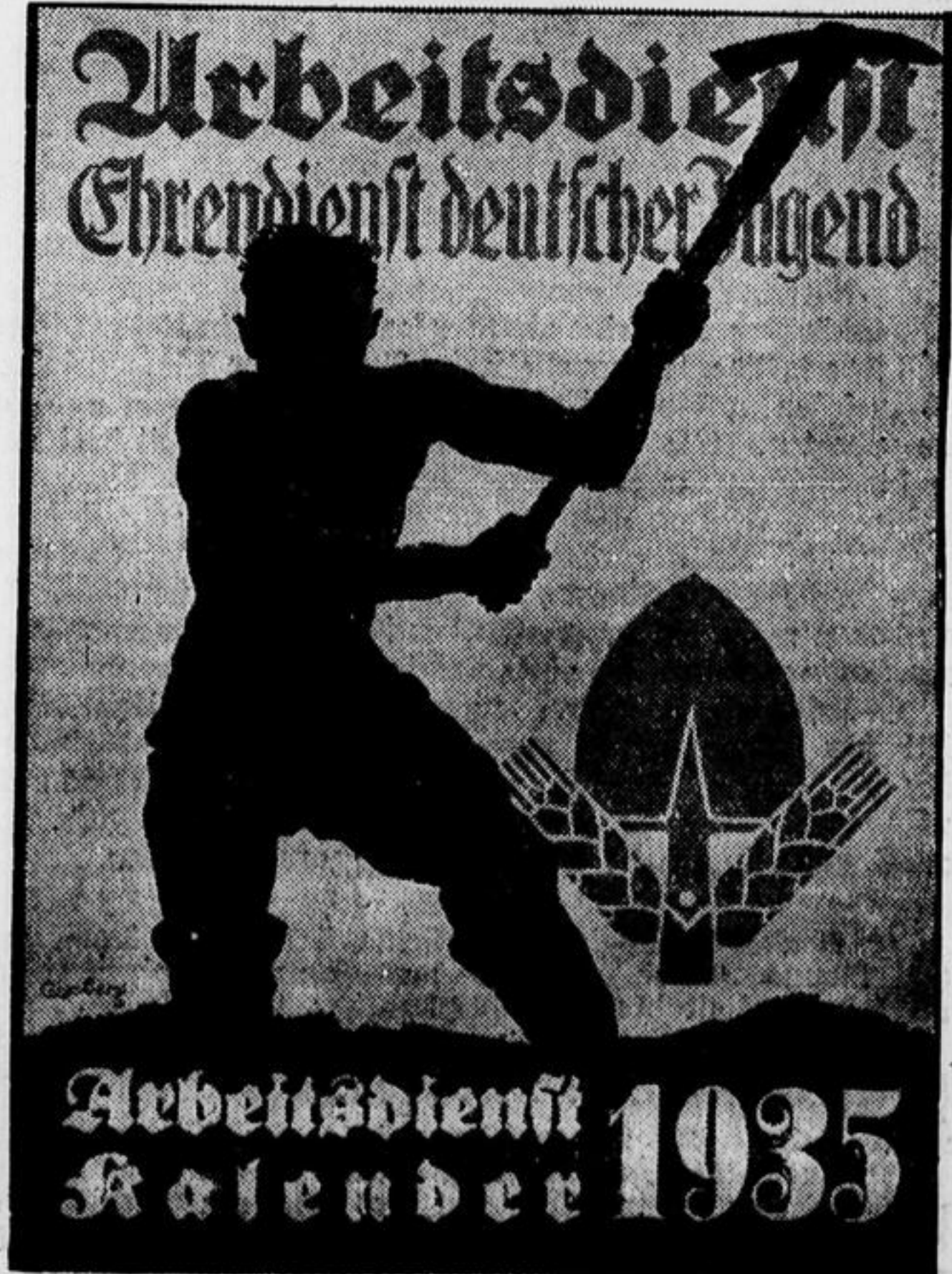
Der Arbeitsdienstkalendar 1935 wurde mit Genehmigung des Reichsarbeitsführers geschaffen und kommt demnächst als Arbeitskalender heraus.