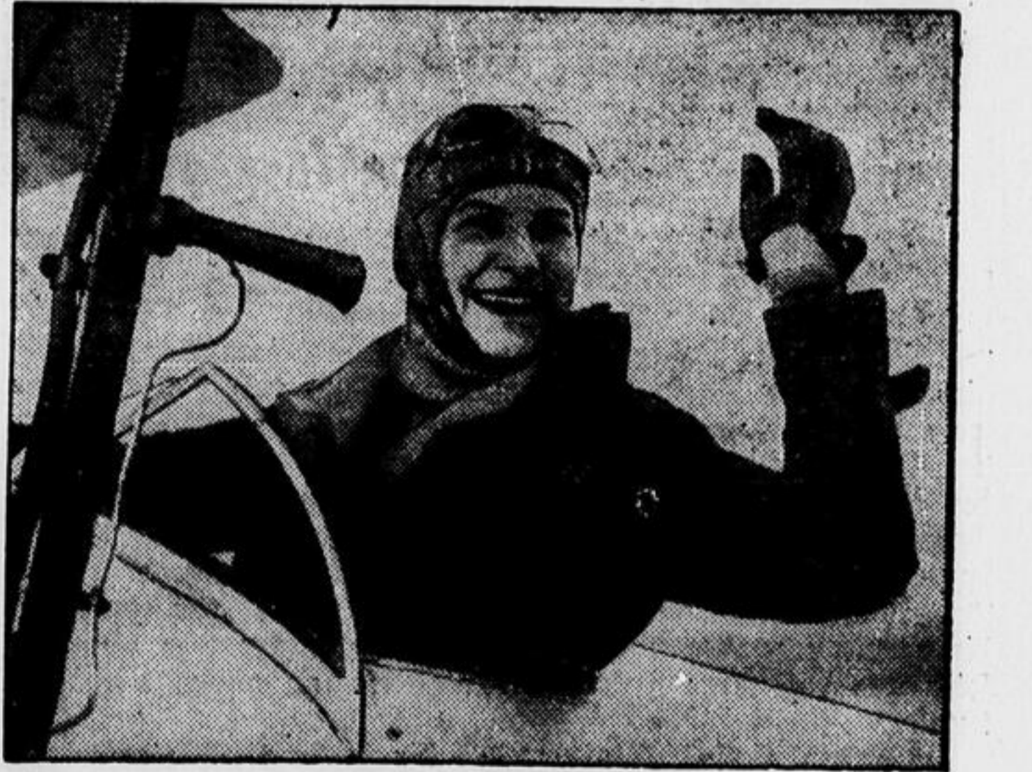
Die bekannteste französische Pilotin, die 26jährige Helen e Boucher, ist beim Abflug ihres Flugzeuges unweit Versailles ums Leben gekommen.

„Wissen Sie auch, daß es dabei um Juges Leben ging?“ fragte Wolf ernst. „Nein!“ Der Attache erschrak bei diesen Worten. „Was ist geschehen?“