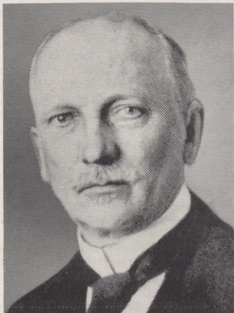
Oberkirchenrat Zenker 1916—1931