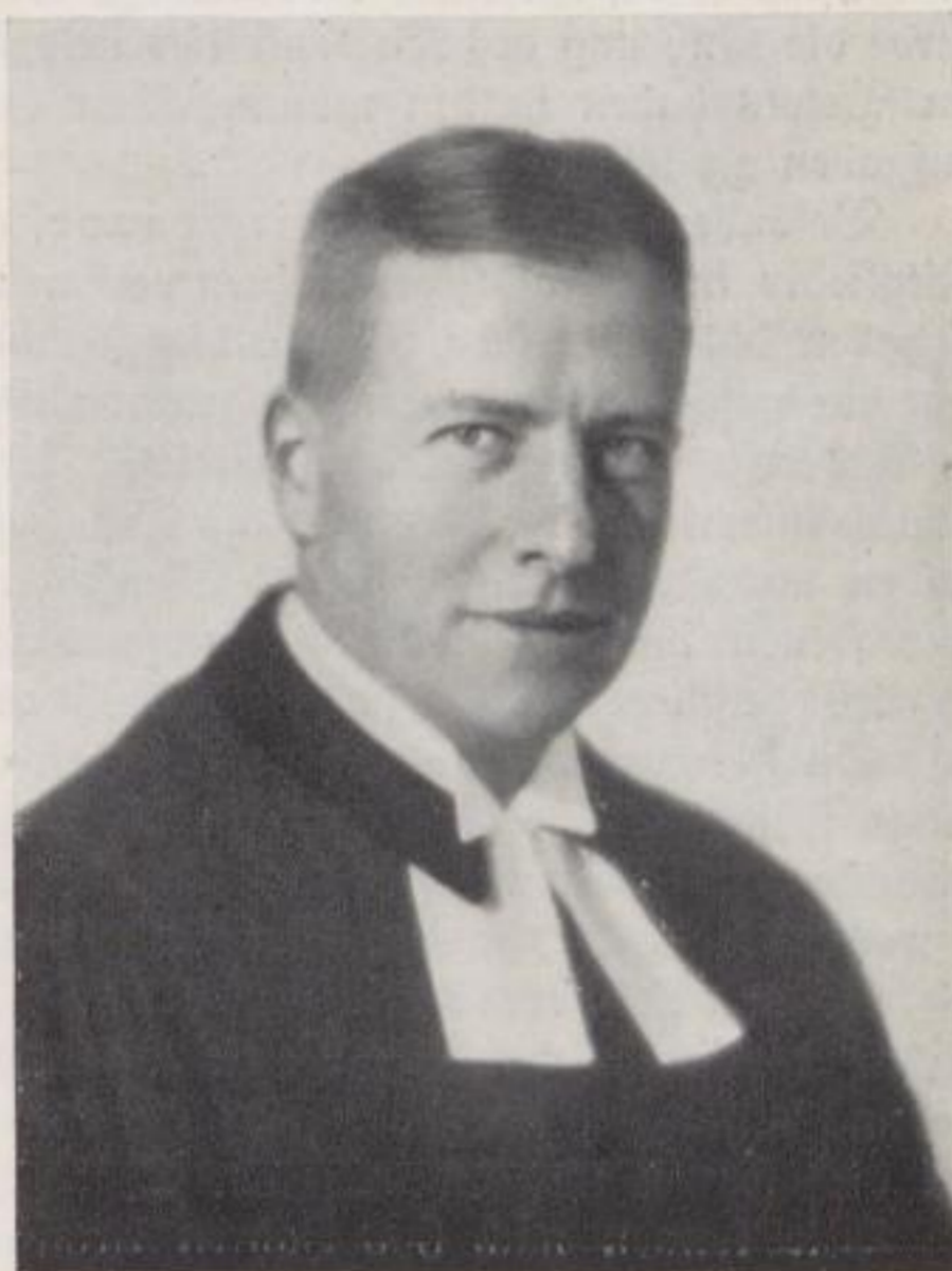
Oberkirchenrat Fröhlich 1932. bis zur Gegenwart