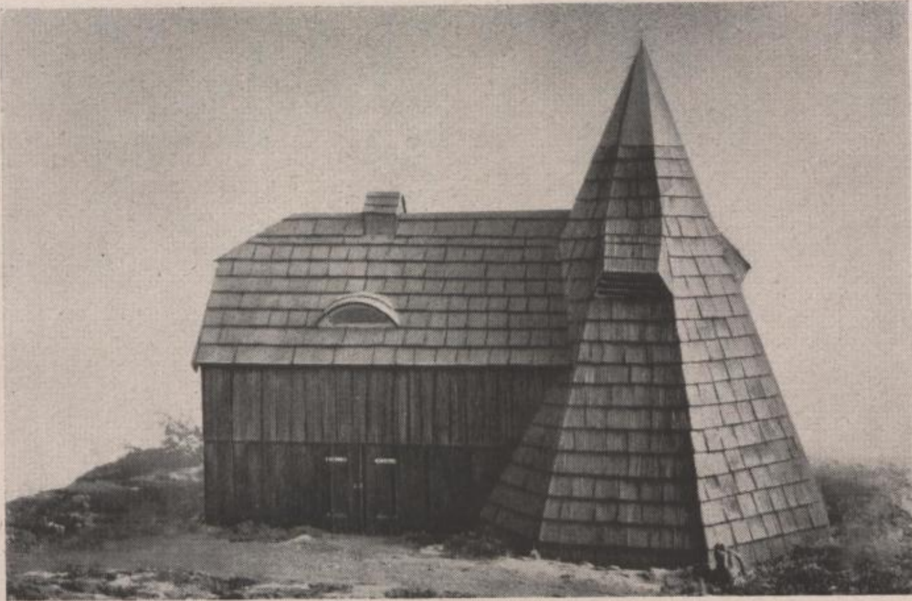
Modell: Alter Pferdegöpel bei Johann-Georgenstadt im Erzgebirge