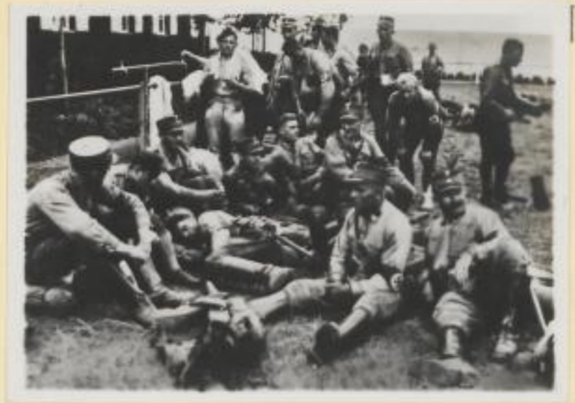
92. Rast im Lager