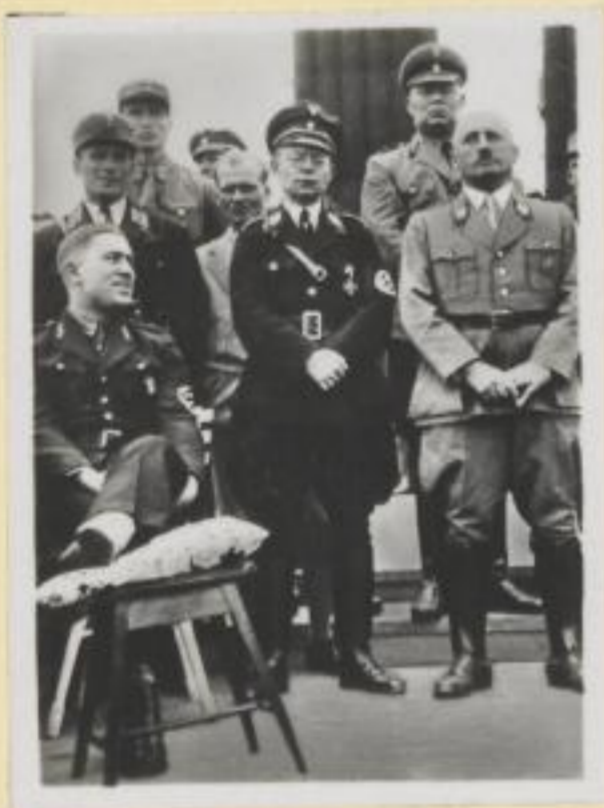
21. Julius Streicher, links der verwundete Gauleiter Hofer