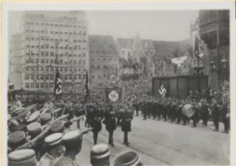
125. Vorbeimarsch der schlesischen SS. vor Stabschef Röhm