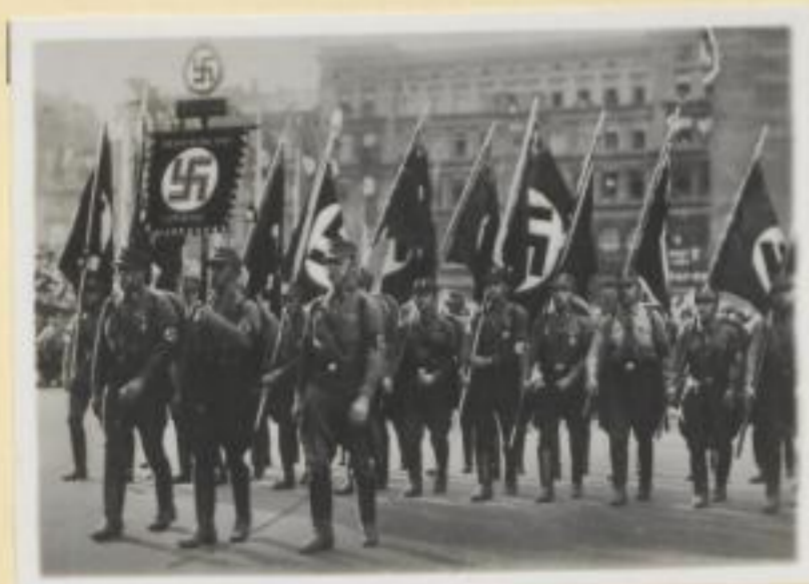
129. Die Breslauer Fahnen