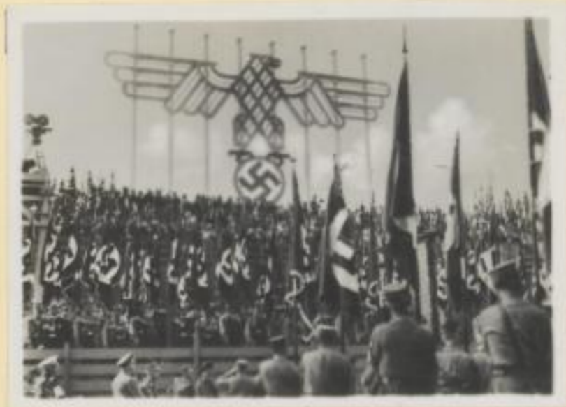
56. Das Riesenhoheitszeichen