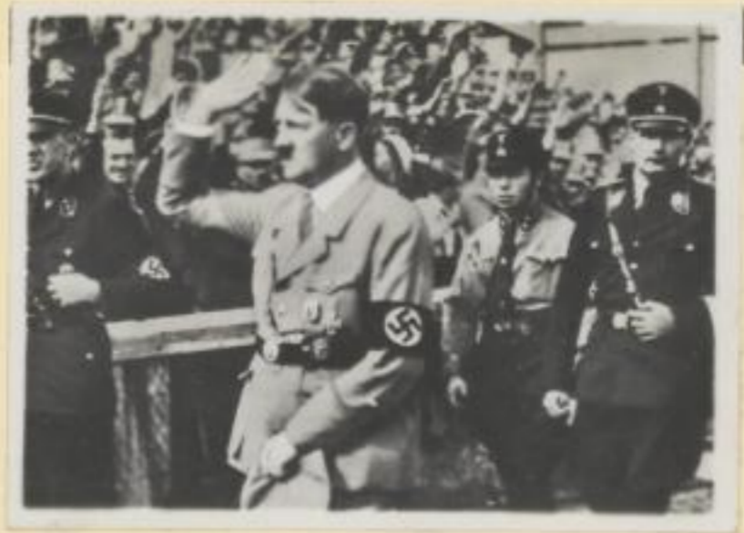
8. Der Führer bei den Amtswaltern