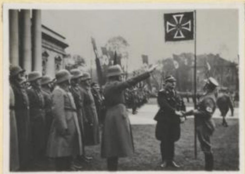
133. Feierliche Übergabe der Fahnen der ehemaligen Freikorps an die SA. / Stabschef Röhm übergibt die Fahne des Freikorps Anlock an SA.-Obergruppenführer Kühme.