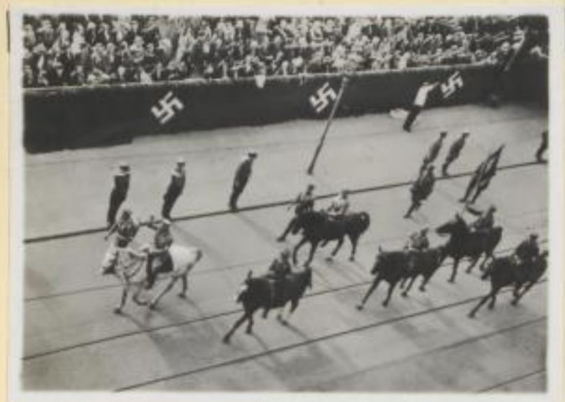
127. Stabschef Röhm und sein Stab