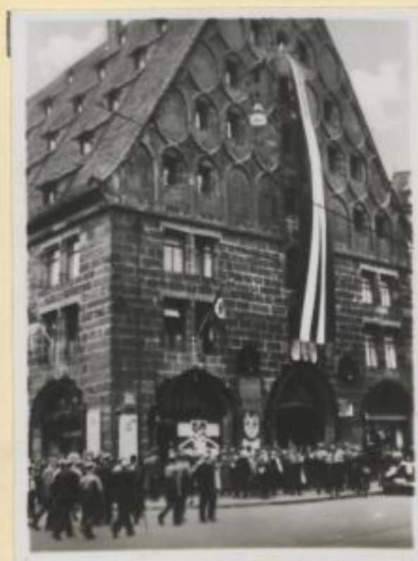
36. Das Mauthaus