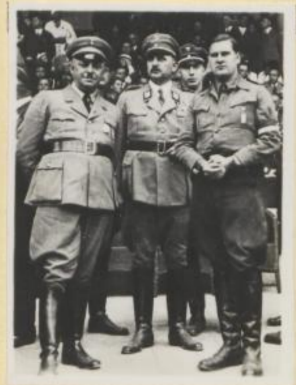
30. Justizminister Kerl, Kultusminister Rust und Reichsjugendführer Baldur v. Schirach