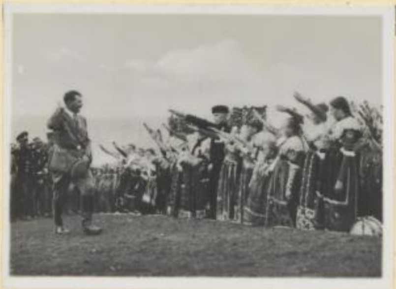
113. Der Reichskanzler schreitet das Spalier der Bauern ab