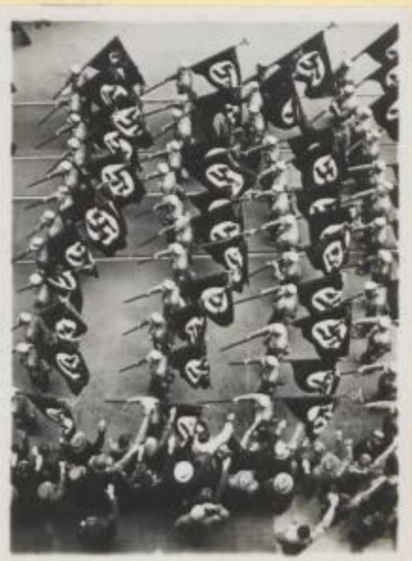
39. In Zwölferreihen durch die engen Gassen Nürnbergs