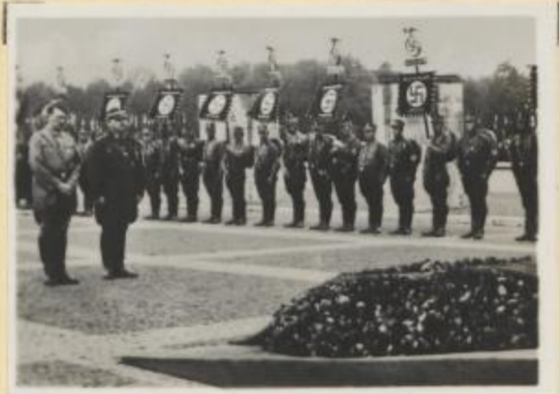
52. Der Führer mit Hauptmann Röhm auf dem Wege zur Gedenkfeier am Heldenkranz