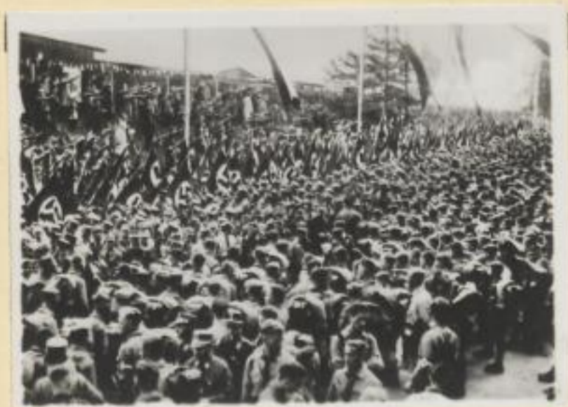
81. An- und Abmarsch der SA.