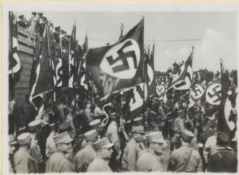
72. Wehende Fahnen