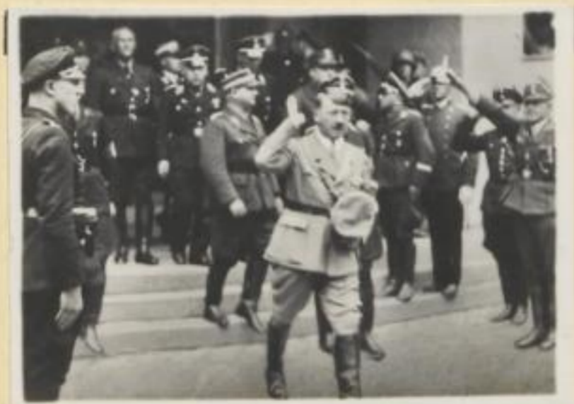
5. Der Führer verläßt die Kongreßhalle