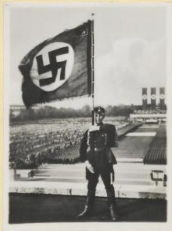
48. Die Hakenkreuzfahne III/36 über dem Luitpoldhain