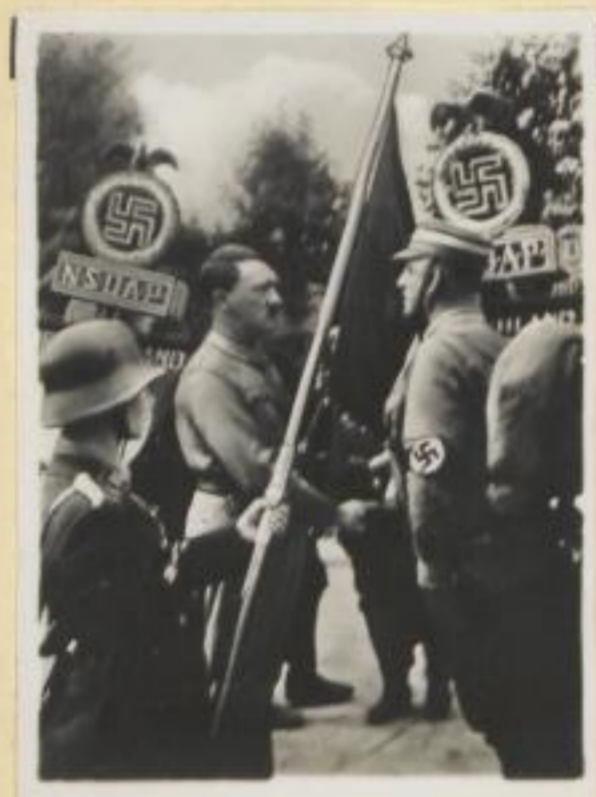
6. Der Führer weihet mit der Blutfahne die Standarten