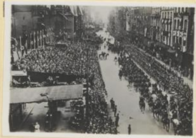
124. Vorbeimarsch der schlesischen Reiterstürme vor Stabschef Röhm