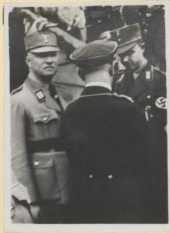
15. Statthalter Mutschmann