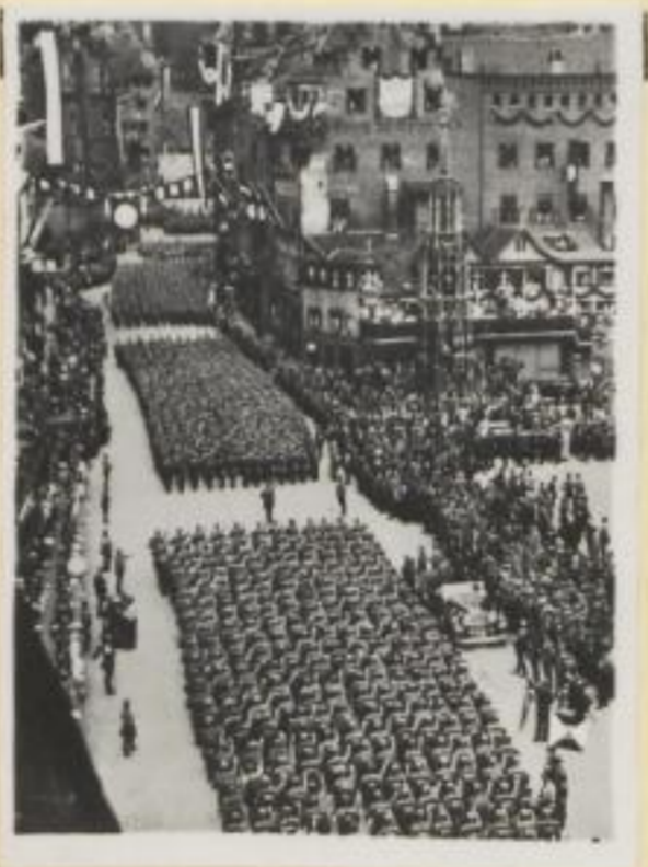
41. Endlose Zwölferreihen