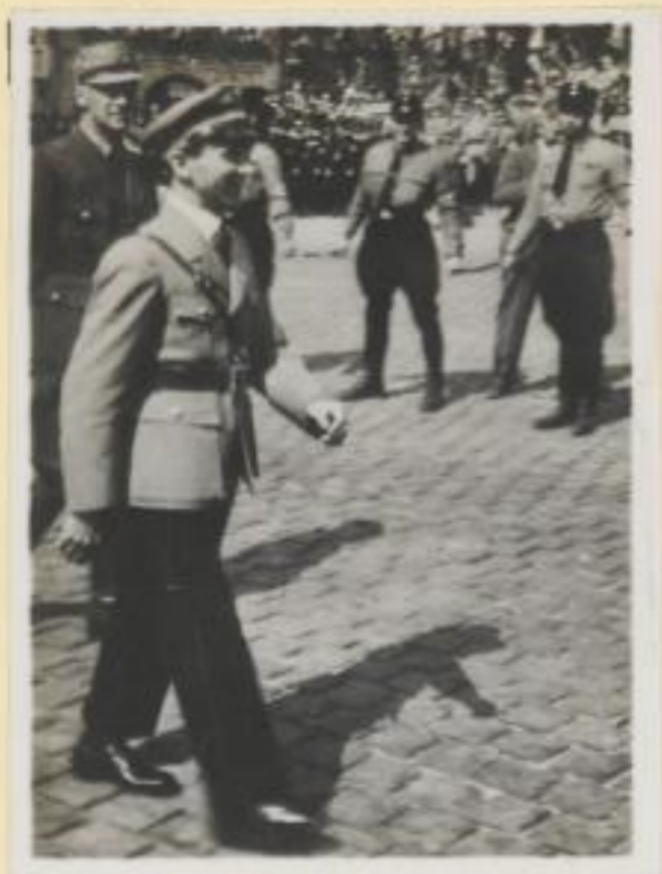
103. Minister Goebbels und Minister Frick auf dem Wege zur Tribüne