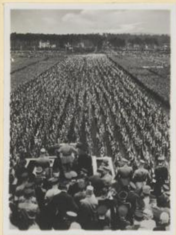
57. 120 000 Mann angetreten Der Führer spricht