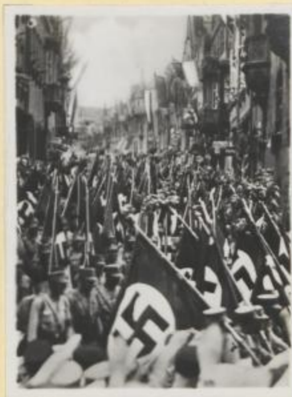
74. Fahnen, nichts als Fahnen!