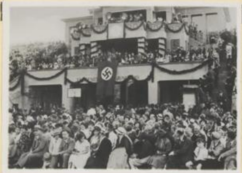
121. Feier im Stadion, Staatsrat Görlicher spricht