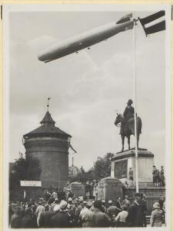
101. Zeppelin über Nürnberg