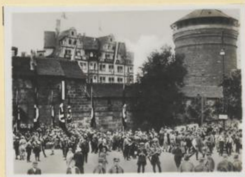
32. Das Königstor mit Frauenturm in Nürnberg