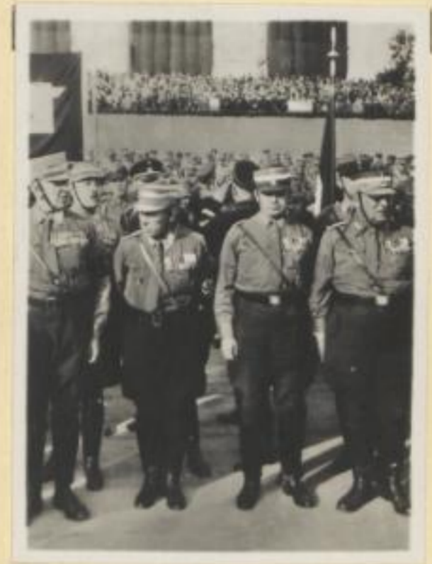
26. Eine Gruppe von Führern