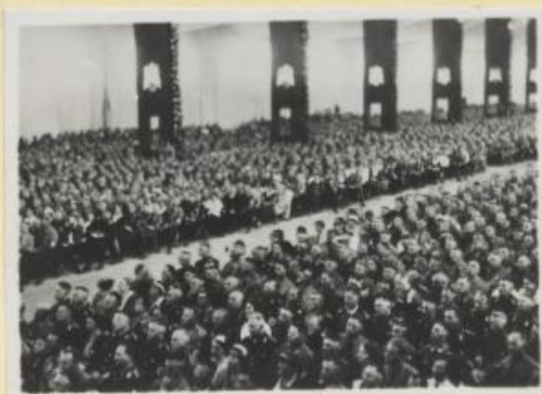
70. Blick in die Kongreßhalle während der Protokollberlesung