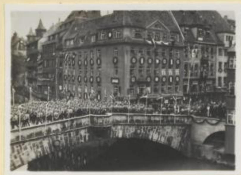
34. Der Festzug auf der Fleischbrücke