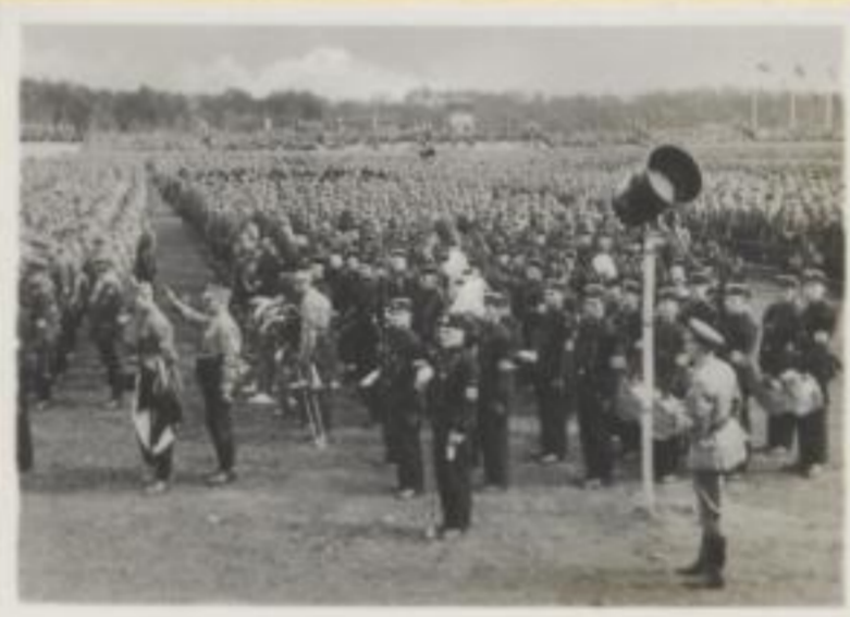
64. Die Oberschlesier auf der Zeppelinwiese