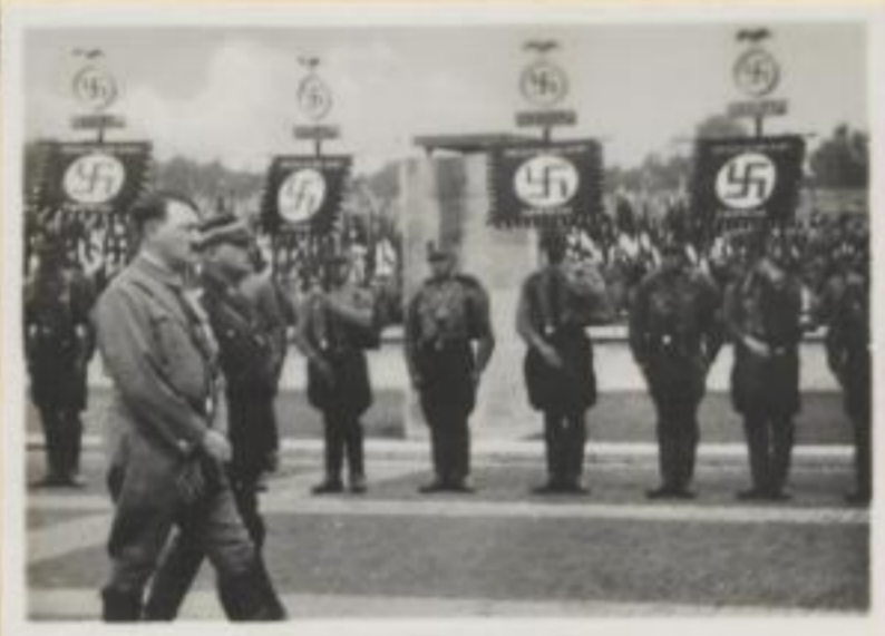
51. Der Führer mit Hauptmann Röhm auf dem Wege zur Gedenkfeier am Heldenkranz