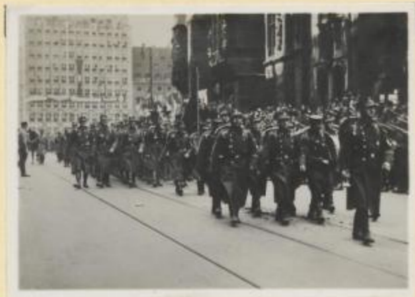
132. Der Horst-Wessel-Sturm