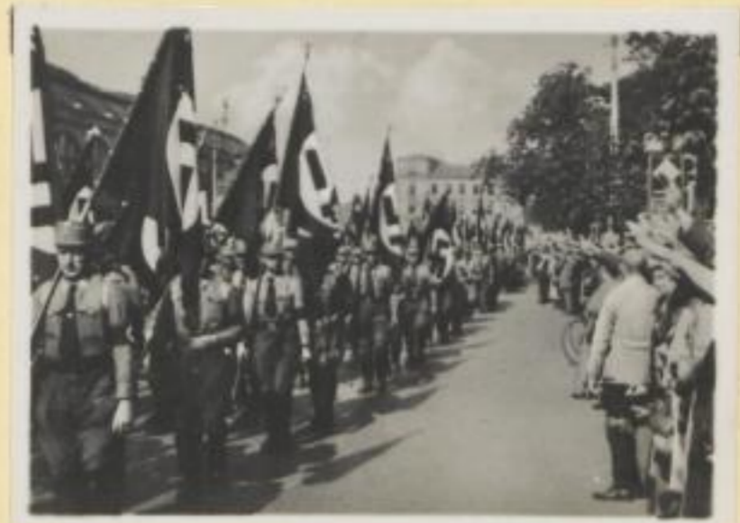
98. Heimkehr der Fahnen