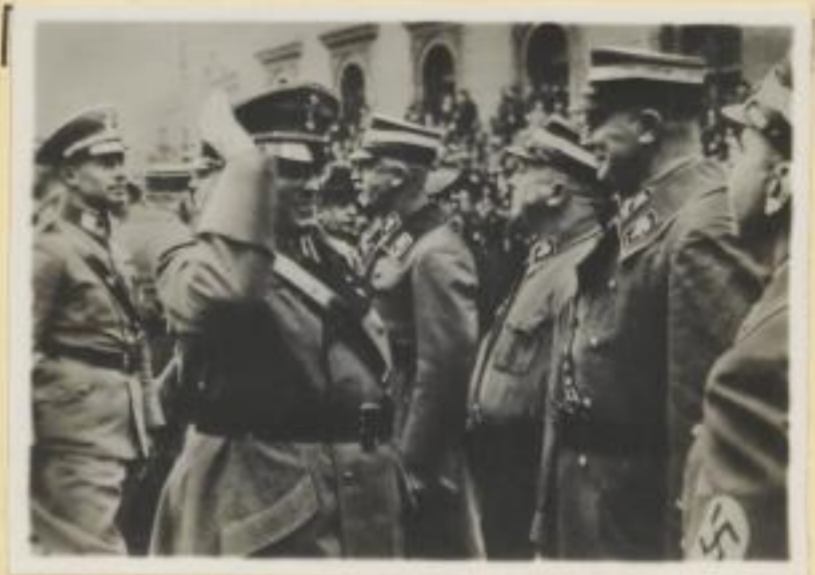
150. Stahlhelmsführer Franz Seldte begrüßt die SA.