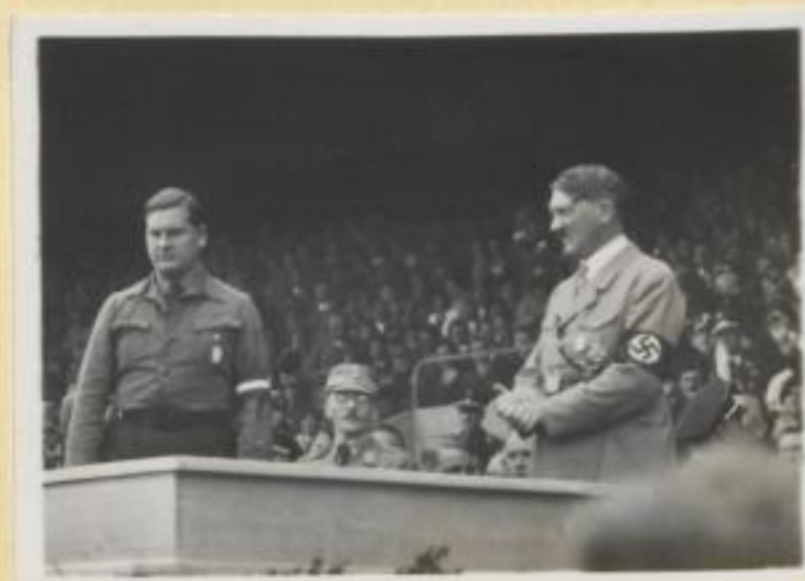
78. Der Führer und Baldur von Schirach sprechen zur Hitler-Jugend