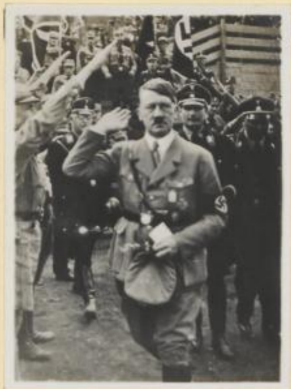
2. Begrüßung des Führers