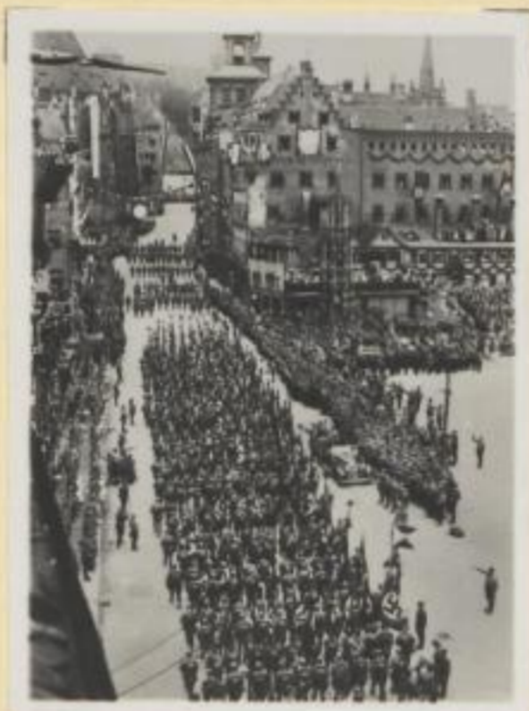
38. Heimkehr der Fahnen