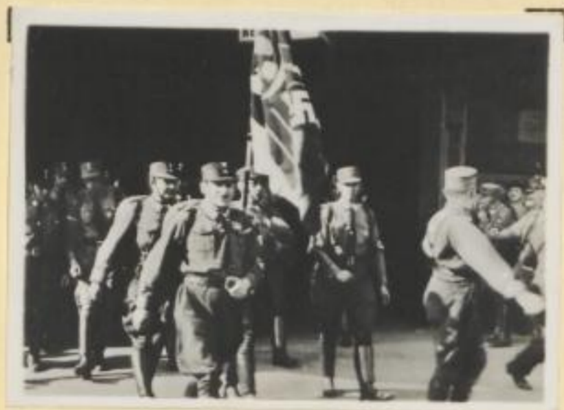
100. Die Schlesier am Dresdner Hauptbahnhof