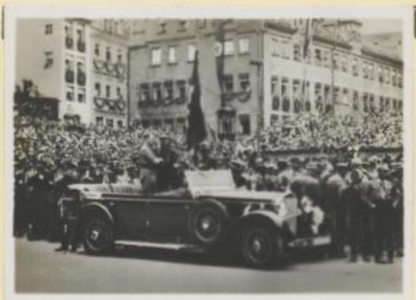
43. Der Führer und Hauptmann Röhm im Auto auf dem Adolf-Hitler-Platz