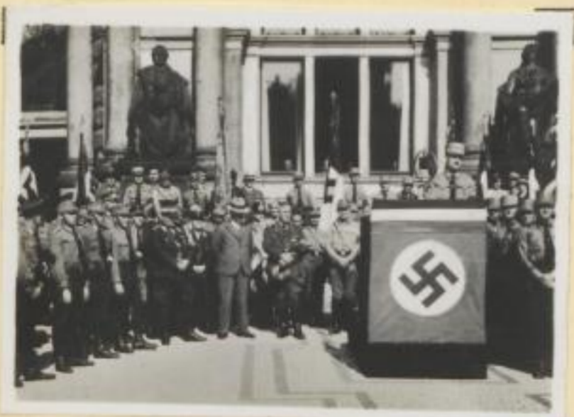
95. Empfang der Heimkehrer auf dem Adolf-Hitler-Platz in Dresden