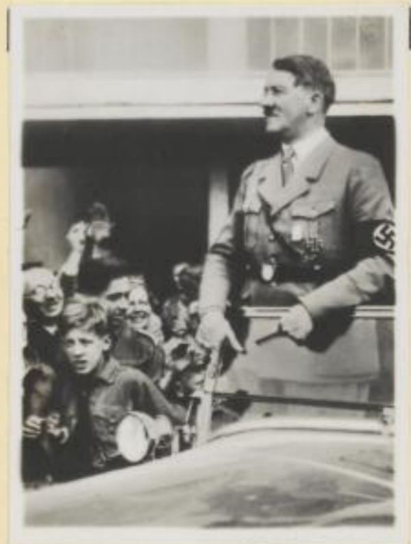
7. Der Führer im Auto bei der Hitler-Jugend