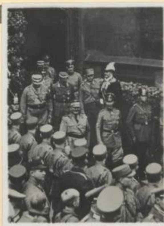
126. Stabschef Röhm und der deutsche Kronprinz verlassen das Rathaus