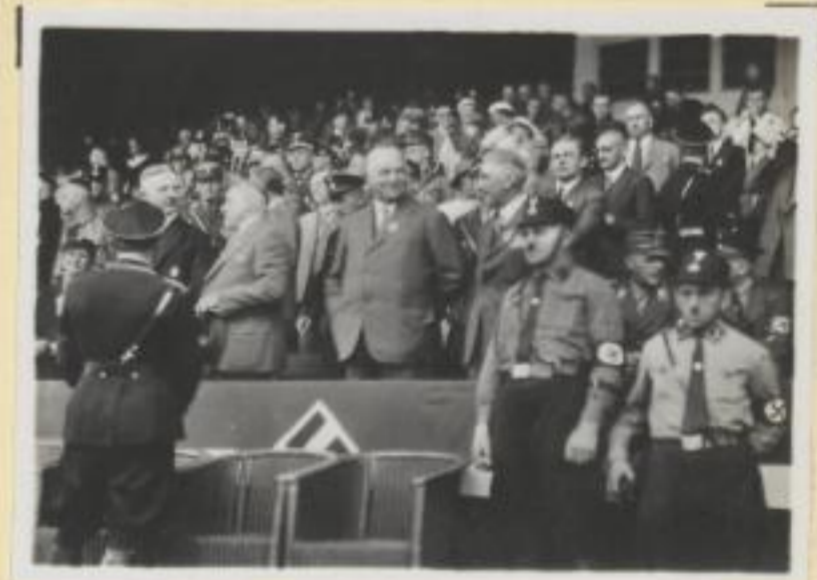
11. Die Ehrenloge mit Dr. Schacht, v. Neurath, v. Papen