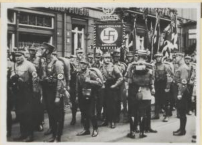
63. Die Dresdner SA. stellt