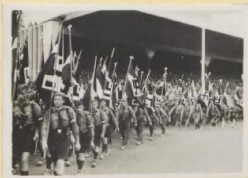
77. Hitler-Jugend marschiert im Stadion auf