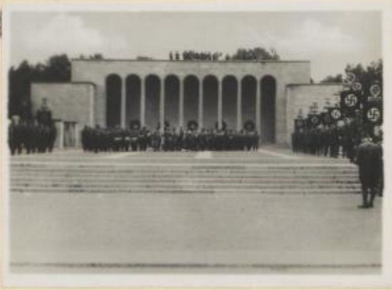
49. Aufmarsch der Standarten im Luitpoldhain