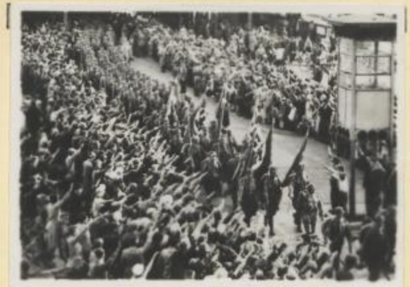
94. Heimkehr der Sächsischen SA.