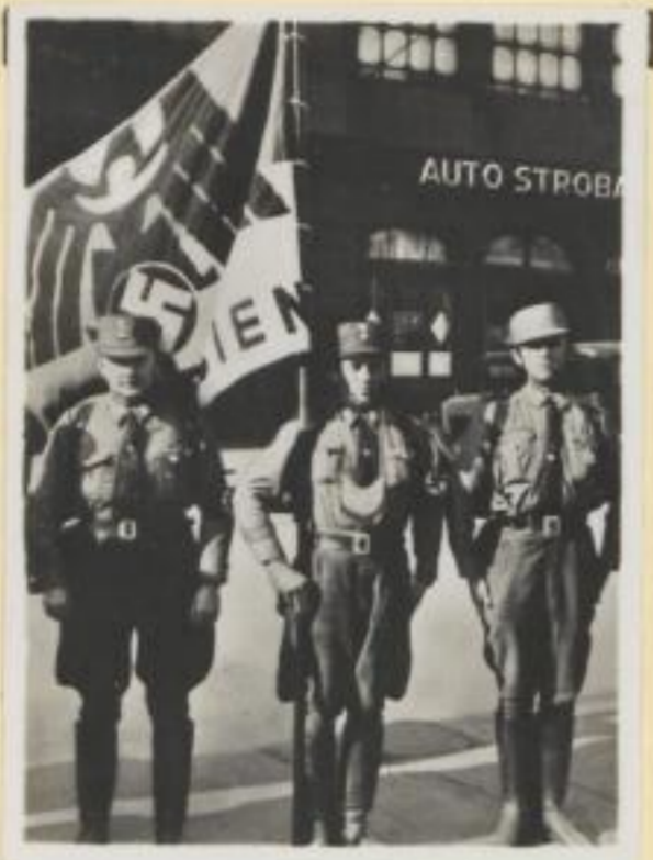
97. Die Fahne der Schlesier