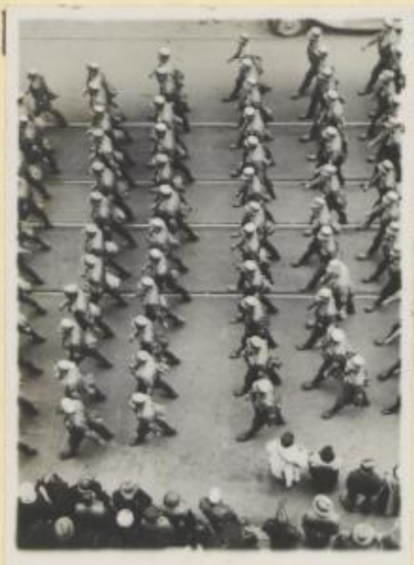
37. In Zwölferreihen durch die engen Gassen