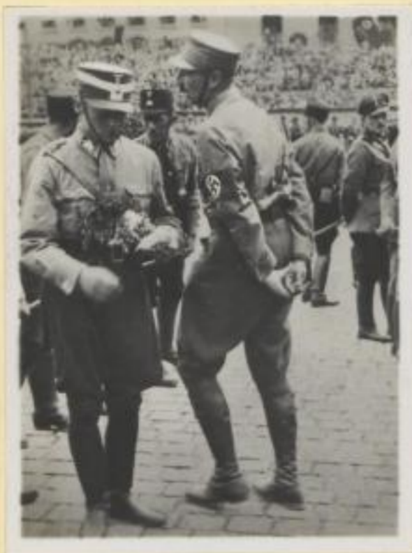
108. Prinz August Wilhelm von Preußen