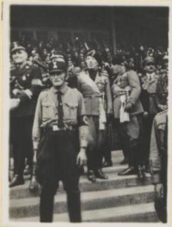
27. Die faschistischen Ehrengäste