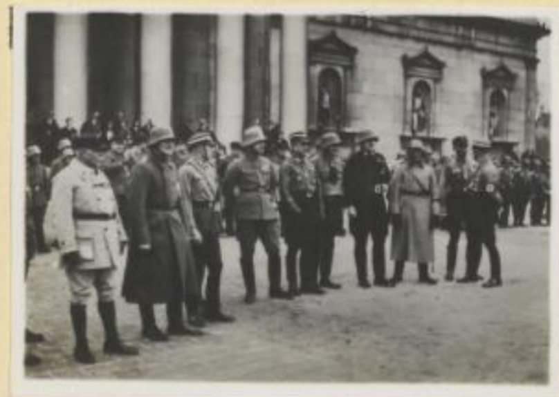
137. Alle Freikorpsführer von Pfeffer bis General Achter