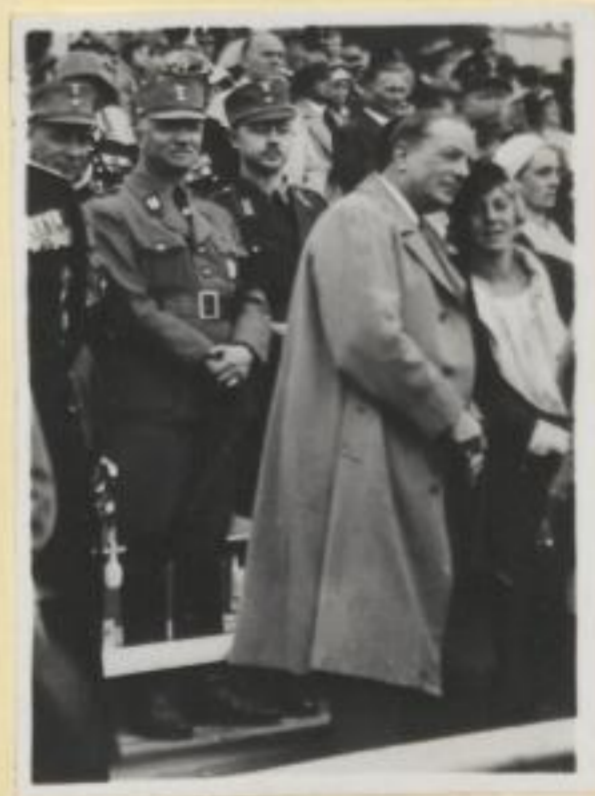
24. Statthalter Mutschmann und Diplomaten