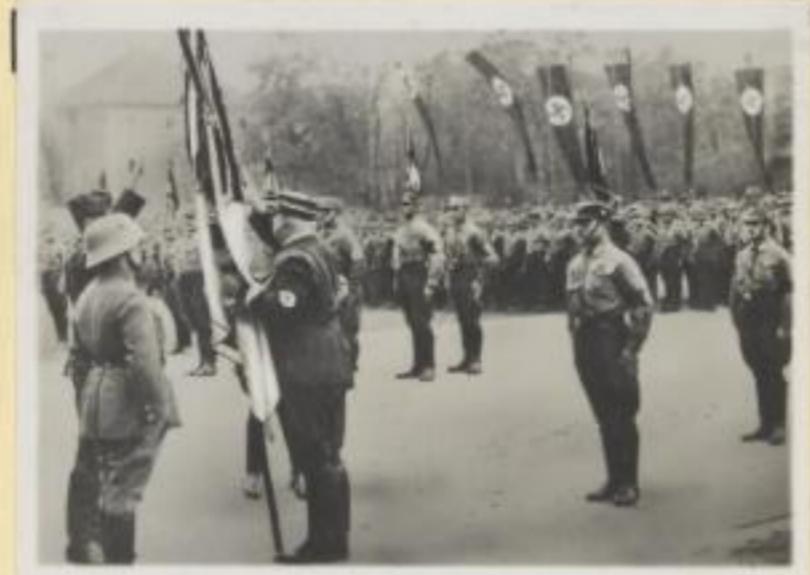
134. Stabschef Röhm übernimmt die Fahne eines ehemaligen Freikorps