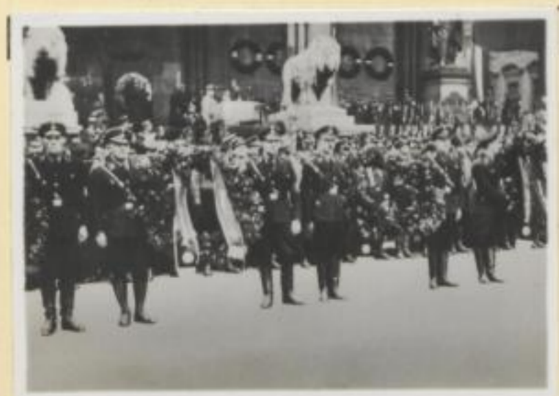
143. Kranzniederlegung durch die SS. an der Feldherrnhalle