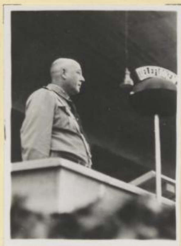
69. Major Bulcke spricht zur Hitler-Jugend