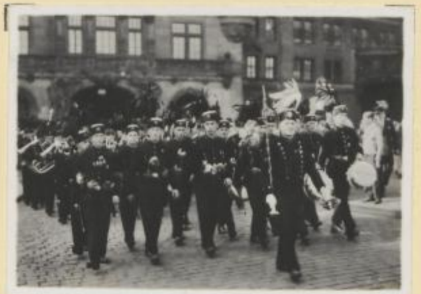
96. Die heimkehrenden Oberschlesier ziehen durch Dresden