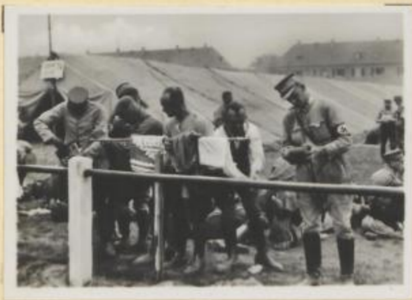
87. Große Wäsche bei der SA.