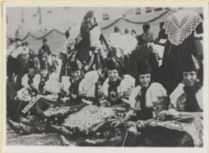
115. Büdeburgerinnen in ihrer malerischen Tracht