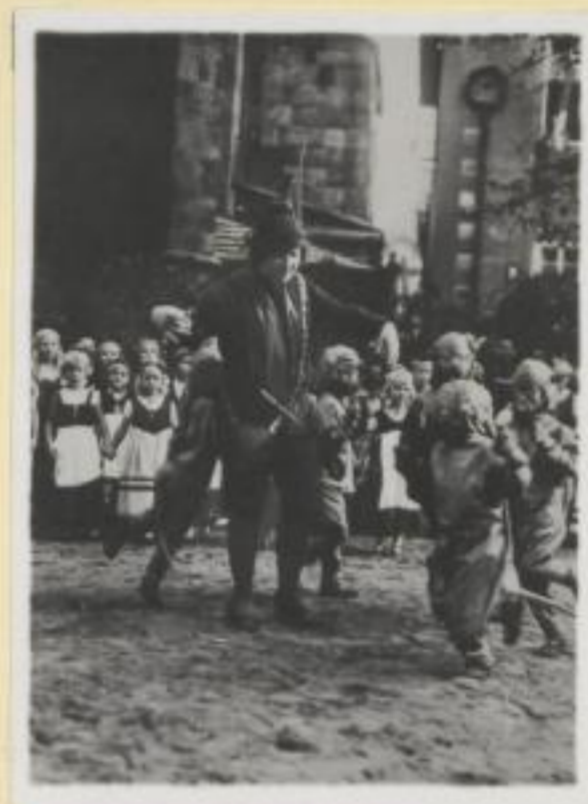
116. Rattenfänger Spiele auf dem Marktplatz in Hameln