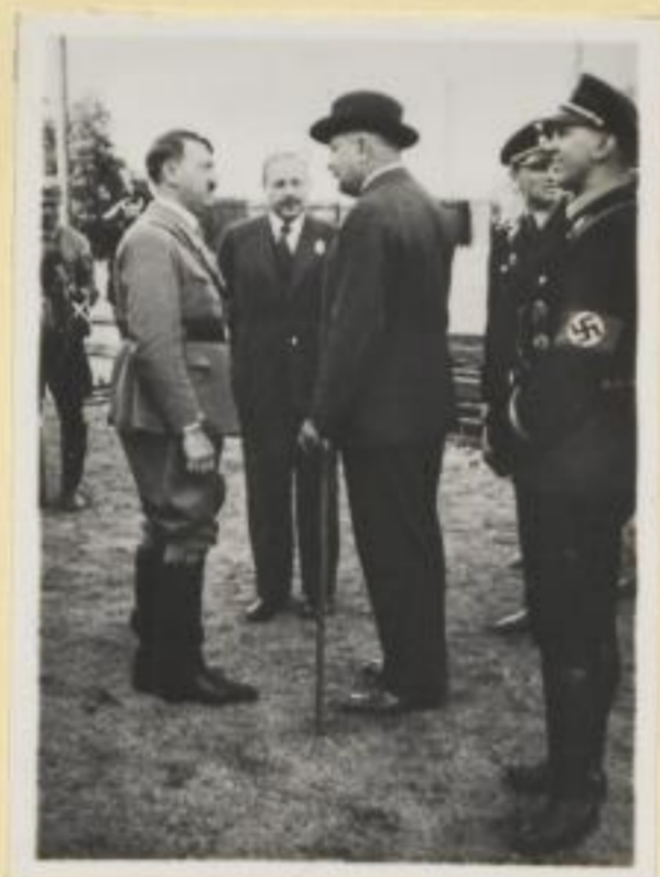
110. Der Führer im Gespräch mit Reichsaußenminister v. Neurath