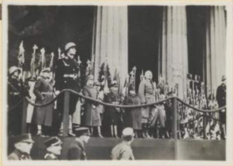
145. Innenminister Wagner vereidigt die Bürgermeister Bayerns auf dem Königsplatz