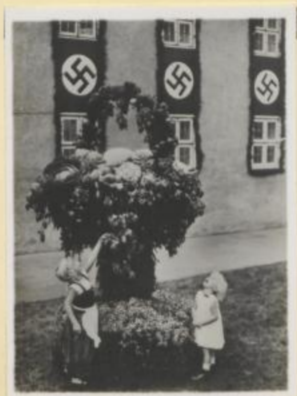
117. Ein Riesenfruchtkorb in Hameln