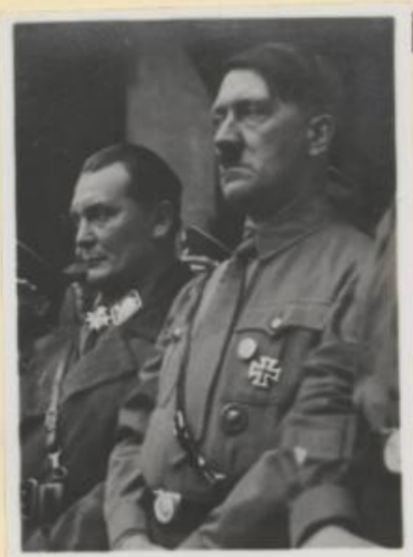
140. Reichskanzler Hitler und Ministerpräsident Göring an der Feldherrnhalle