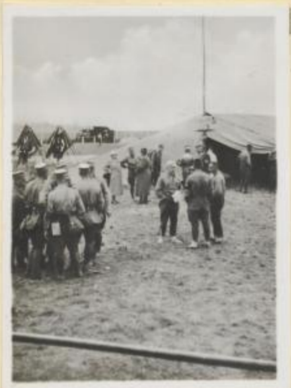
83. Zeltlager der Obergruppe IV