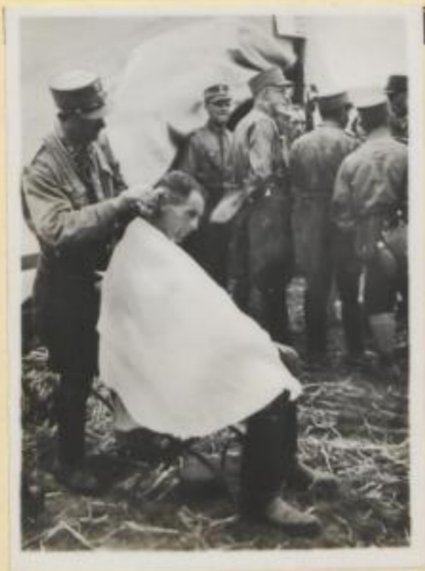
89. Der Lagerfriseur