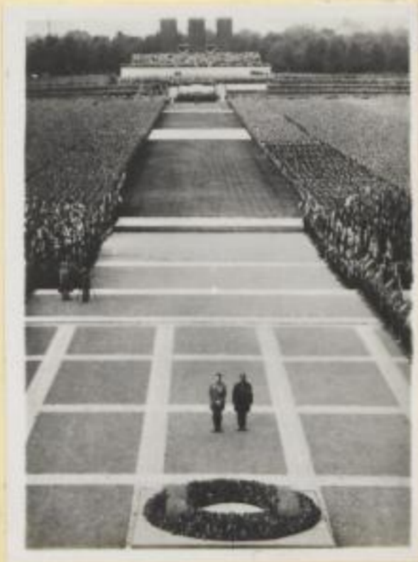
53. Der Führer und Hauptmann Röhm vor dem Heldenkranz