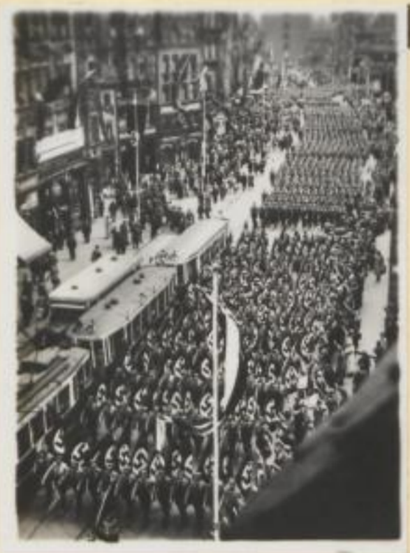
40. In Zwölferreihen durch die engen Gassen Nürnbergs