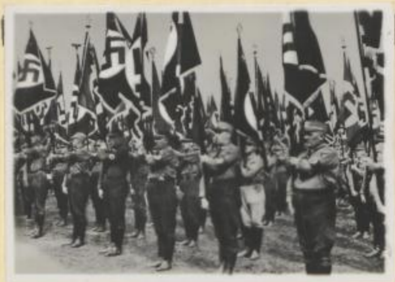
73. Der Fahnenwald