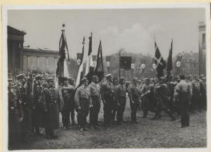
139. Die Fahnen der ehemaligen Freikorps werden an die SA. übergeben.