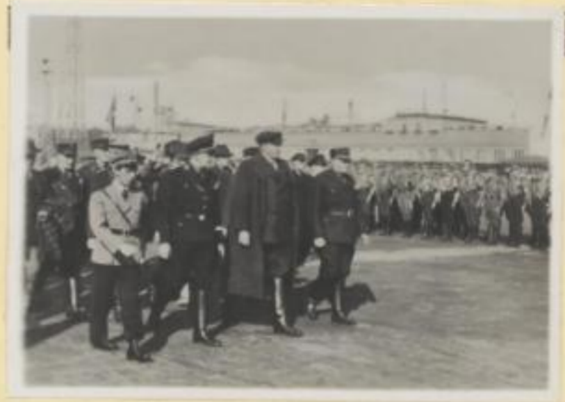
120. Ankunft der Bauernvertreter, im Vordergrund Dr. Goebbels