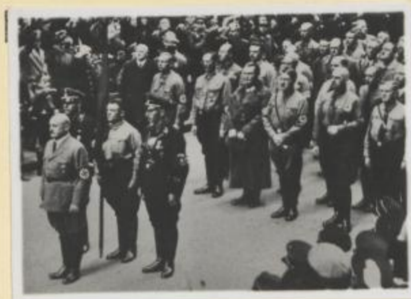
142. Kurzes Schweigen der Kämpfer von 1923 vor der Feldherrnhalle