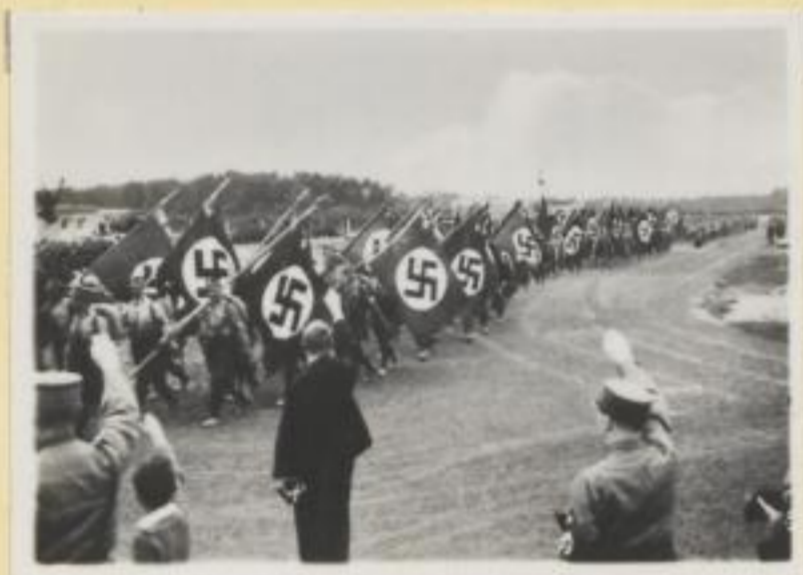
111. Marschbrigade Sachsen an der Nürnberger Stadtgrenze