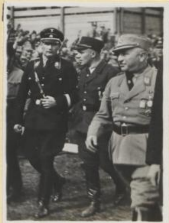
18. Rudolf Heß, Stellvertreter des Führers u. Dr. Rob. Ley, Führer der Deutschen Arbeitsfront