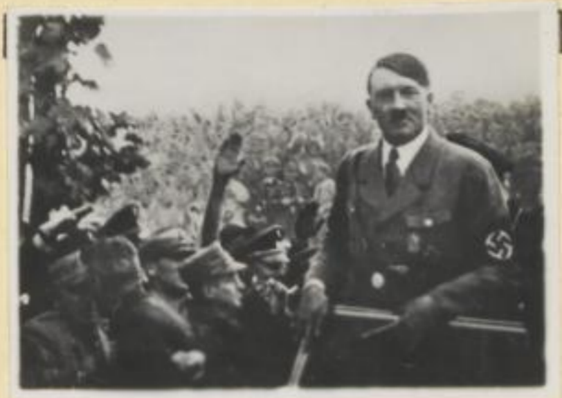
1. Die Ankunft des Führers