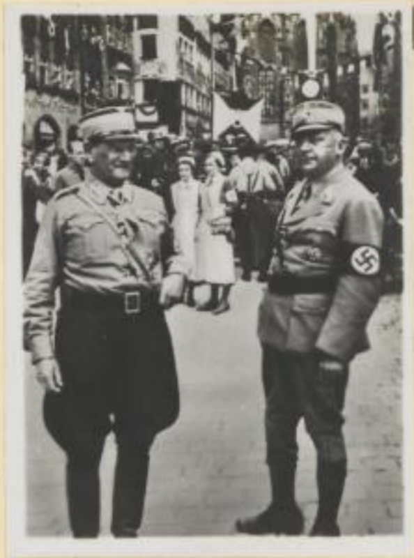
14. Statthalter Ritter v. Epp und Bayr. Staatsmstr. d. I. A. Wagner