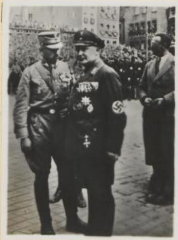
17. Ministerpräsident Göring im Gespräch