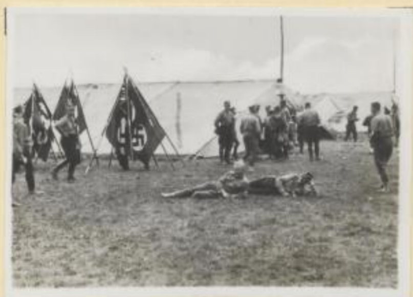
84. Das Zeltlager