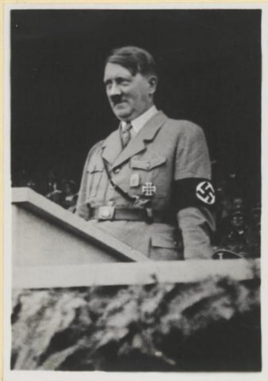
3. Der Führer spricht zur Jugend