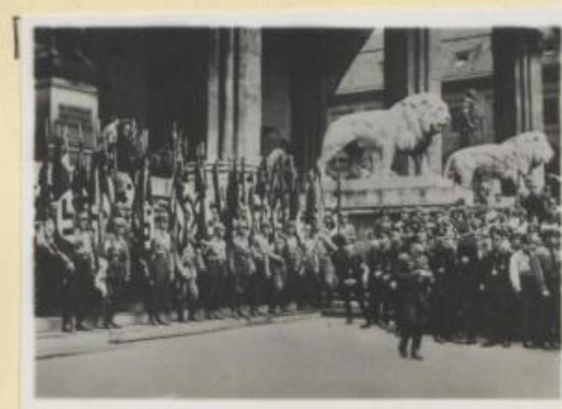
144. Die alten Hakenkreuzfahnen vor der Feldherrnhalle.