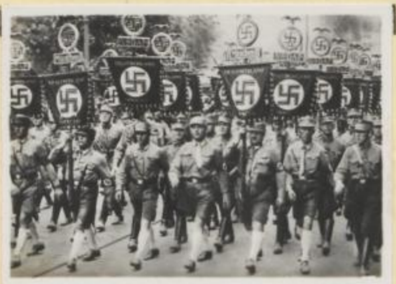
65. Die bayerischen Standarten