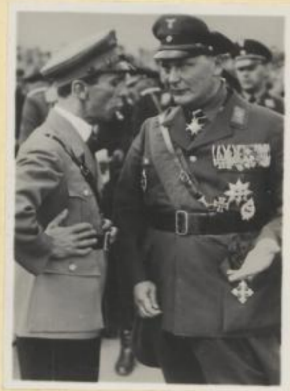
13. Propagandaminister Dr. Goebbels und Ministerpräsident General Göring