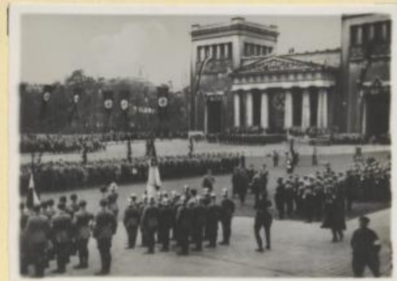
136. Stabschef Röhm schreitet die Front der ehemaligen Freikorps ab