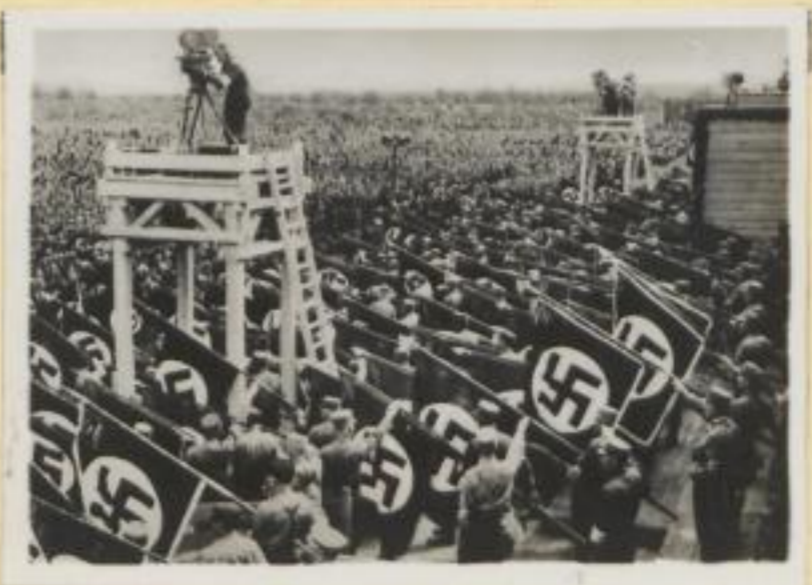
54. Gefallenenehrung auf der Zeppelinwiese