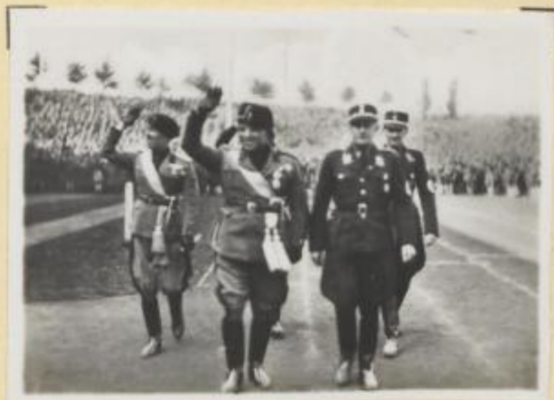
29. Faschistische Gäste grüßen