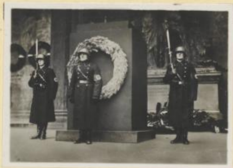
146. SS.-Ehrenwache in der Feldherrenhalle