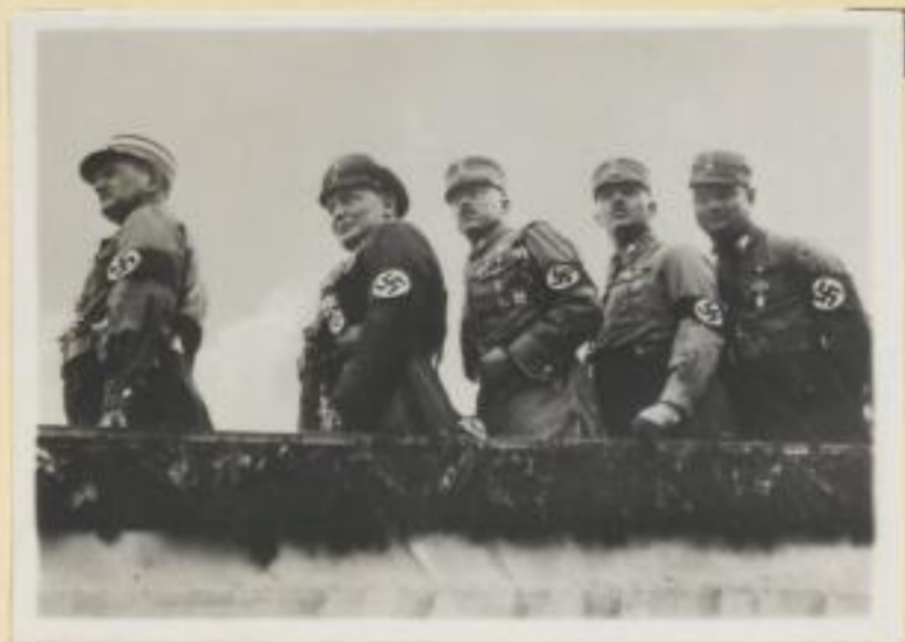
10. Reichsstatthalter v. Epp, Ministerpräsident Göring, ehem. Osaf v. Pfeffer-Kassel