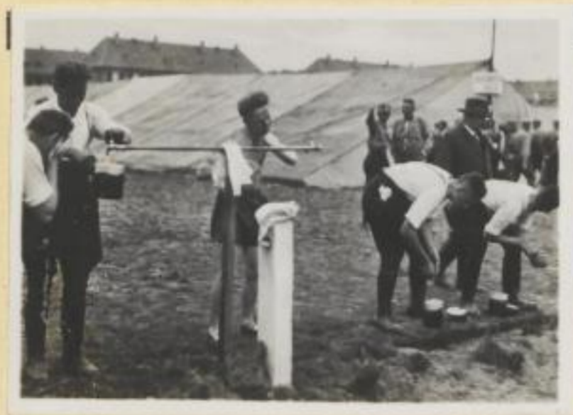
90. Große Wäsche bei der SA.