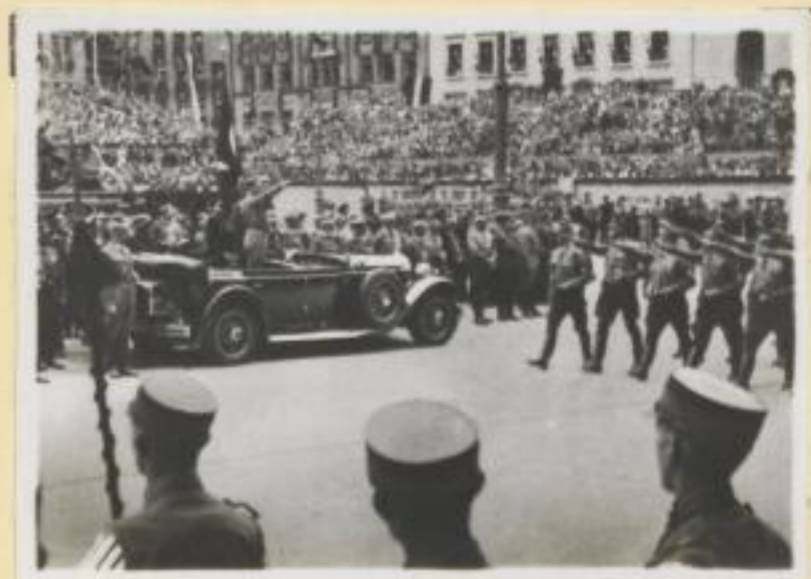
107. Der Führer grüßt die SA.