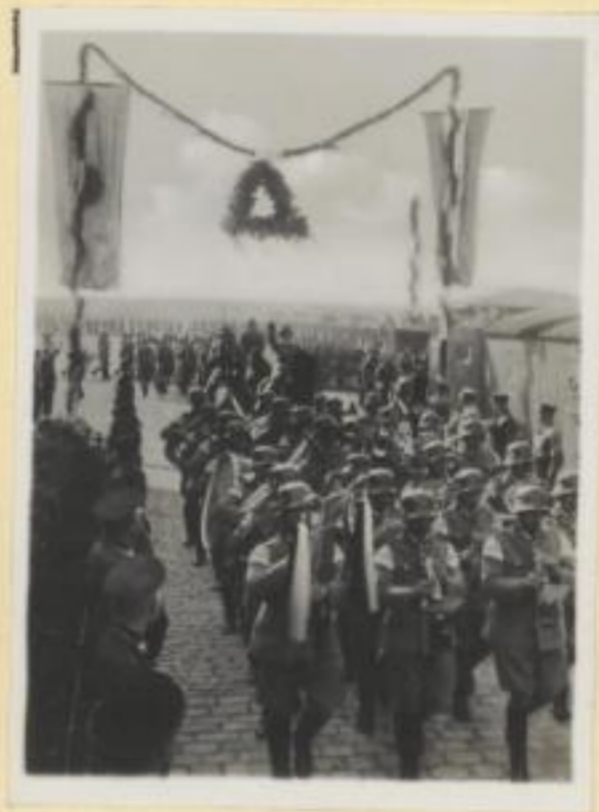
122. Aufmarsch der Polizei.