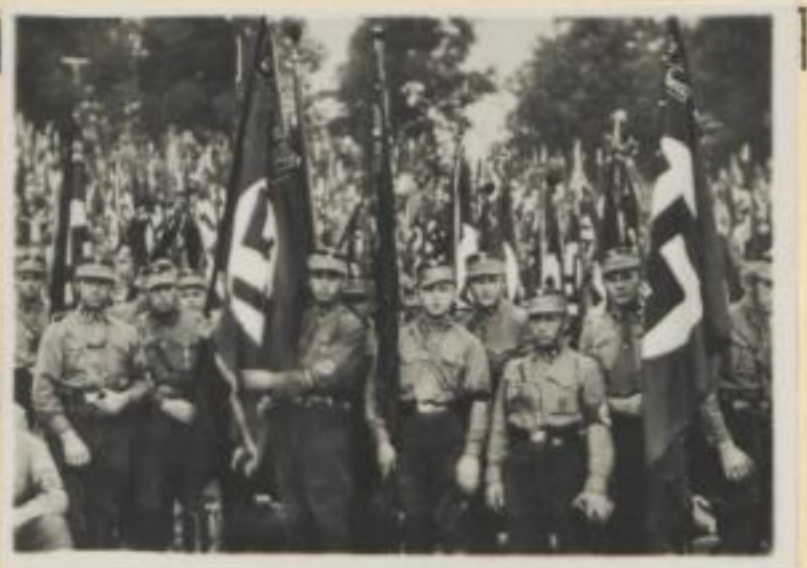
61. Der Horst-Wessel-Sturm