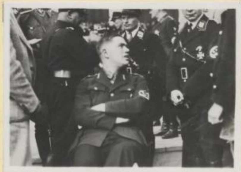
20. Gauleiter Hofer, Österreich