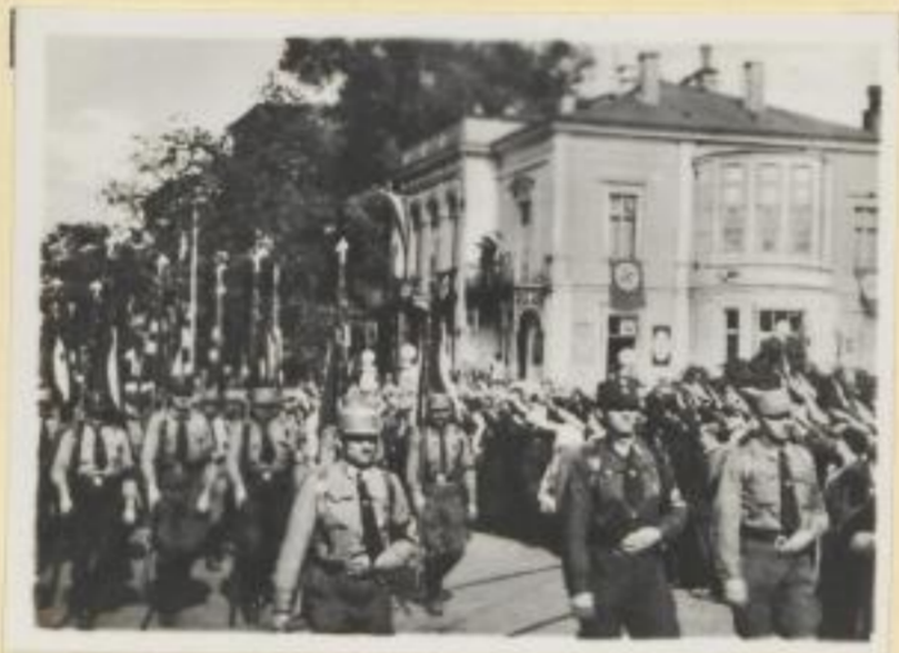
93. Die begeistert empfangenen Heimkehrer