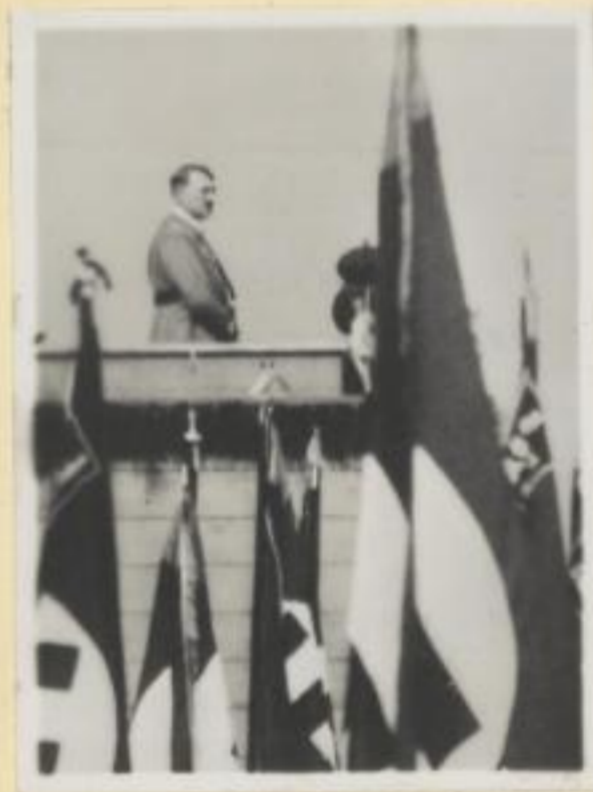
58. Der Führer spricht