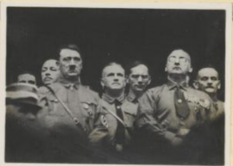
147. Der Führer und seine Getreuen in der Feldherrenhalle.