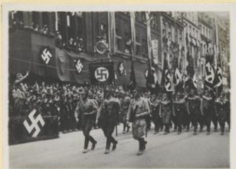
131. Vorbeimarsch der Standarte Schweidnitz