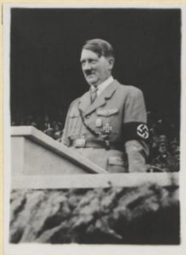
3. Der Führer spricht zur Jugend