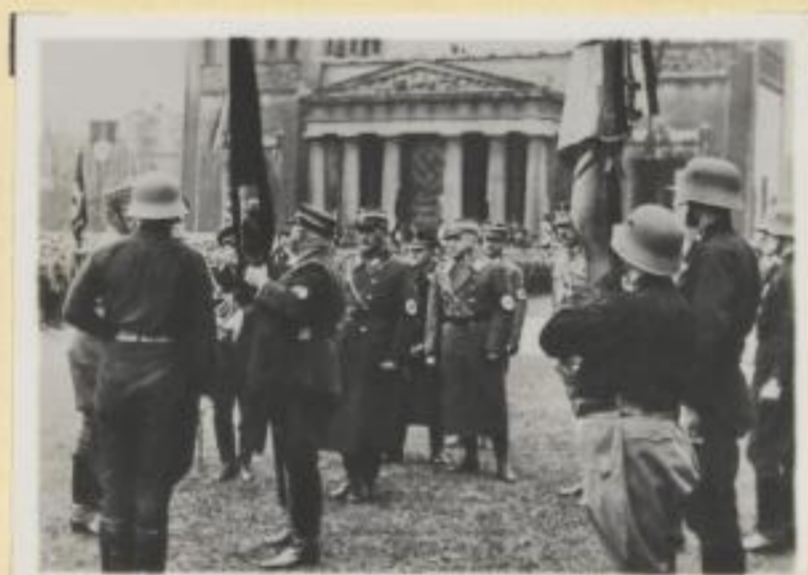
135. Stabschef Röhm übergibt die Fahne eines ehemaligen Freikorps an die SA.