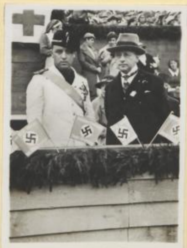
112. Der Vertreter Mussolinis