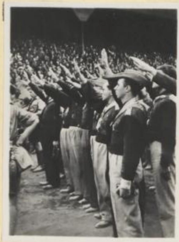
28. Faschistische ital. Studenten