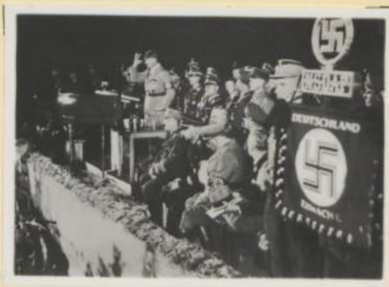
118. Der Führer spricht zu 500 000 Bauern