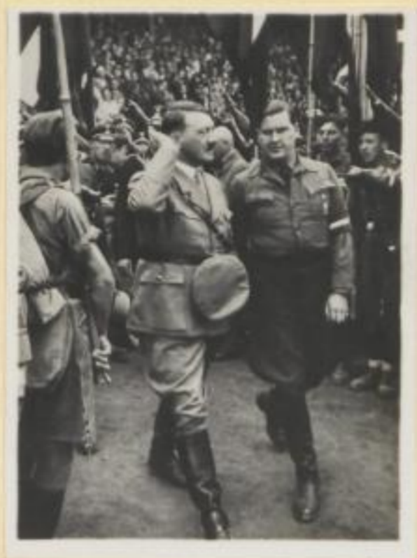
4. Der Führer mit Baldur von Schirach