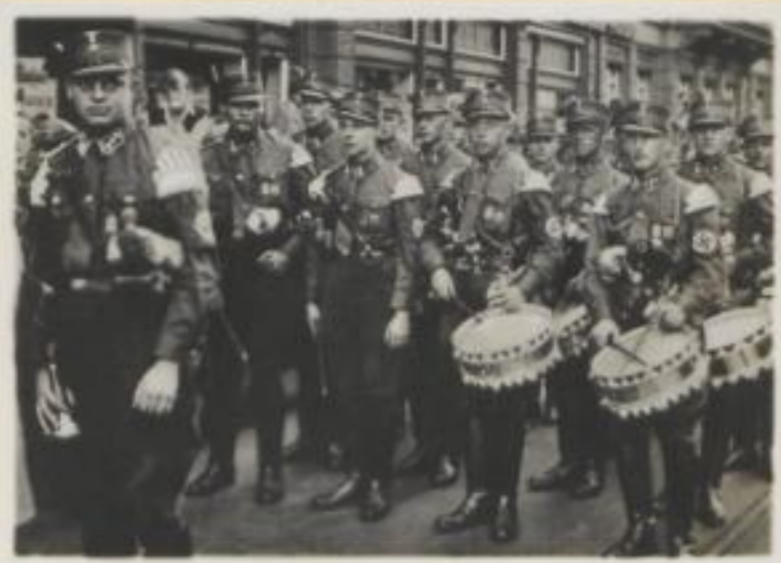
62. Spielmannszug der Sächsischen SA.