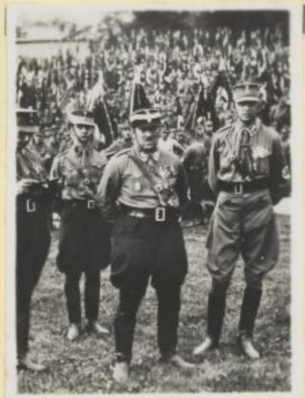
23. Obergruppenführer Minister- präsident Manfred v. Killinger mit Major Kob