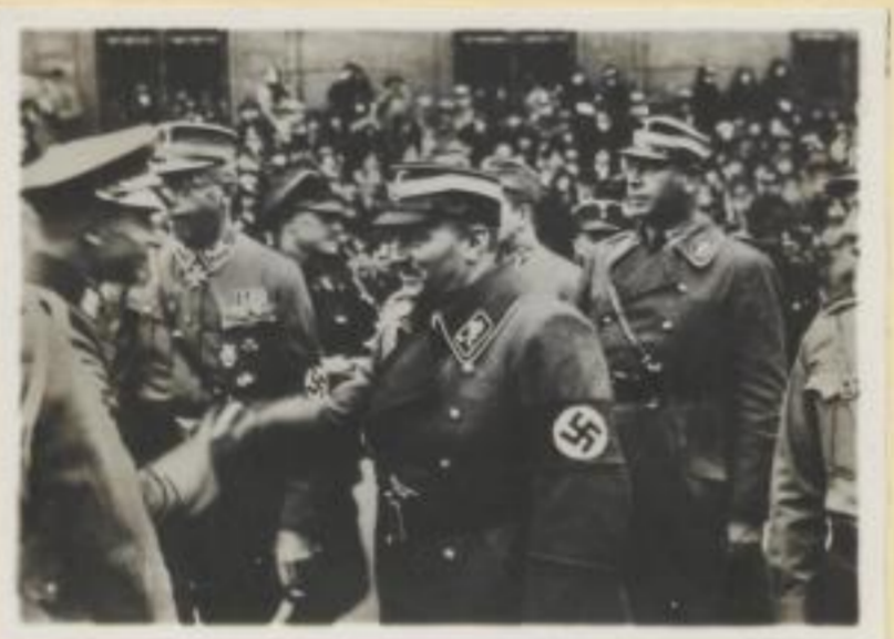
149. Ministerpräsident von Killinger im Ge- spräch mit einem Reichswehroffizier