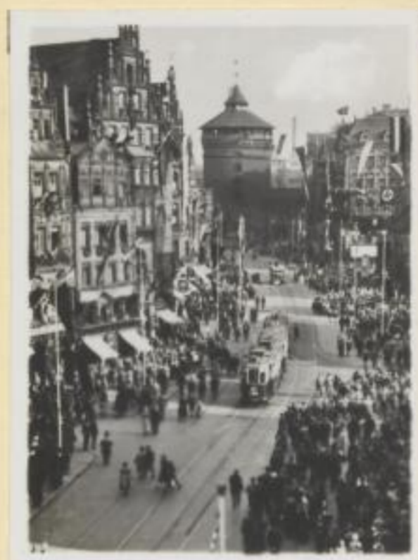
33. Die festlich geschmückte Königstraße in Nürnberg