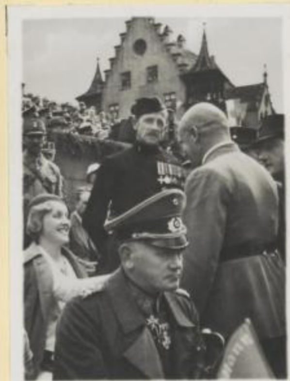
105. Ehrentribüne. Julius Streicher begrüßt eine amerikanische Journalistin. Reichs- wehrminister v. Blomberg, eng- lische Faschisten-Vertreter