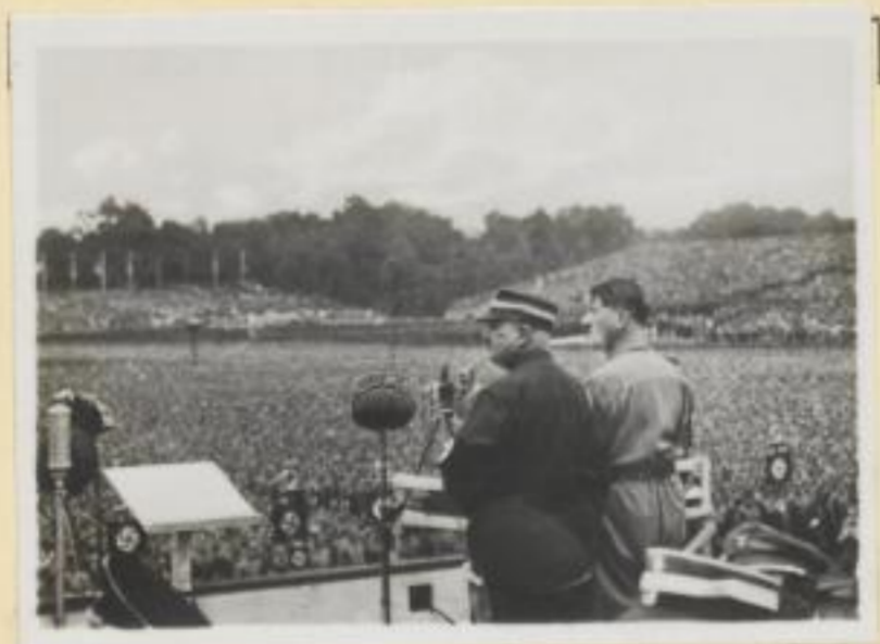
55. Der Führer und Hauptmann Röhm