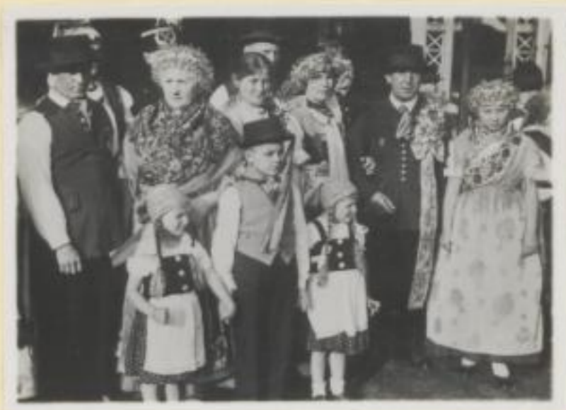
114. Trachtengruppe der Schlesier