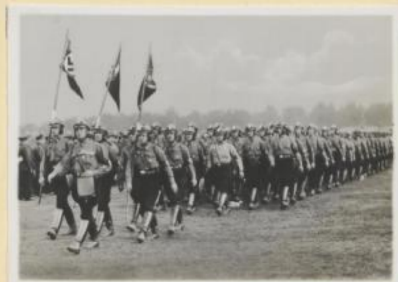
130. Aufmarsch des Motorsturmes auf dem Flugplatz