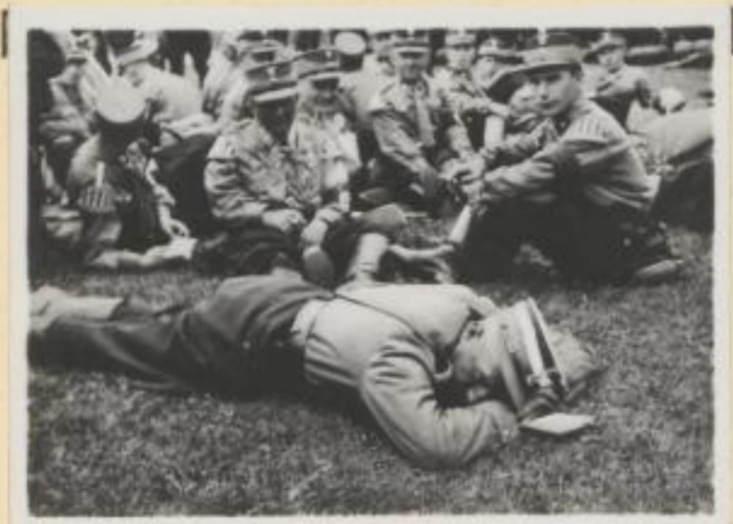
85. SA. im Lager