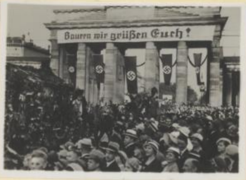
119. Einzug der Bauern durch das Brandenburger Tor