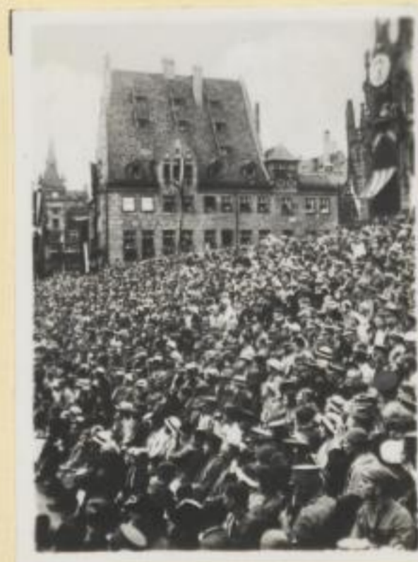
35. Begeisterte Zuschauer