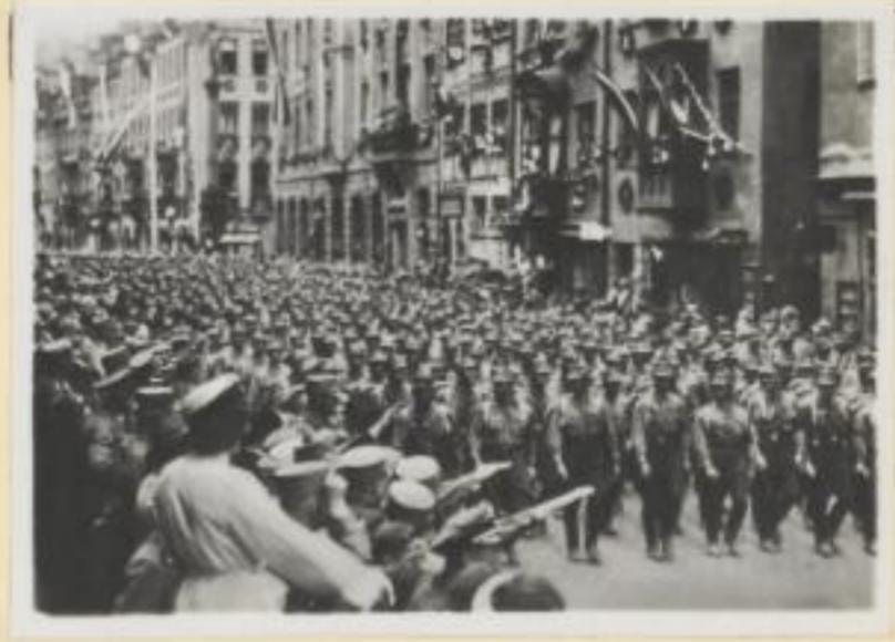
46. Vorbeimarsch der Sachsen