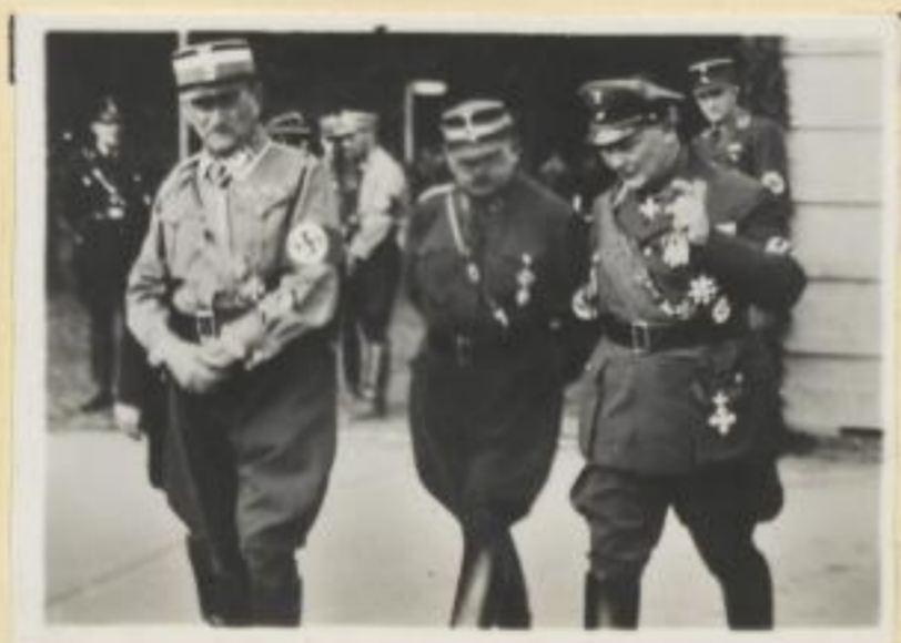
12. Statthalter v. Epp, Hauptmann Röhm, General Göring