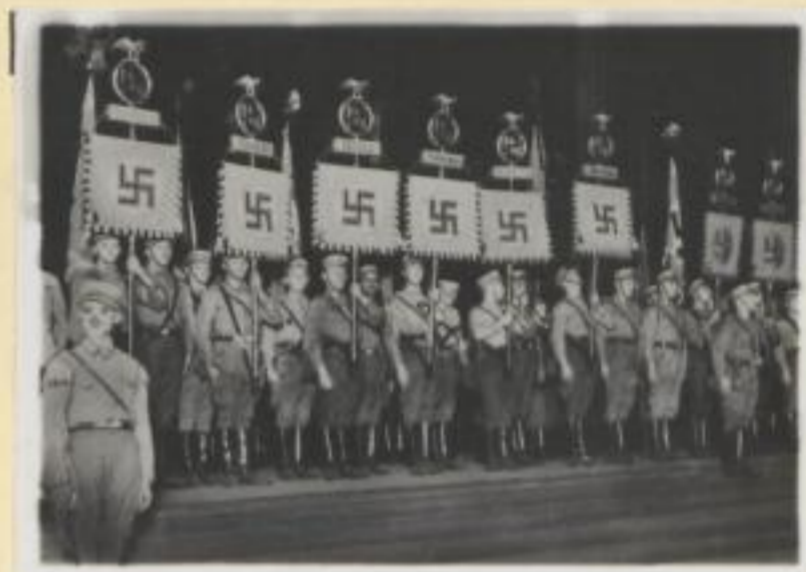
128. Die schlesischen Standarten