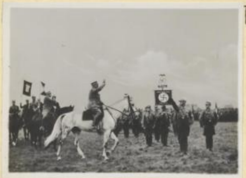
123. Stabschef Röhm mit Obergruppenführer Heines auf dem Sandauer Flugplatz