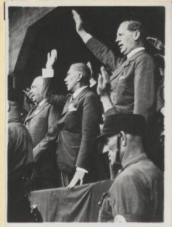
9. Minister v. Neurath und Vizekanzler v. Papen