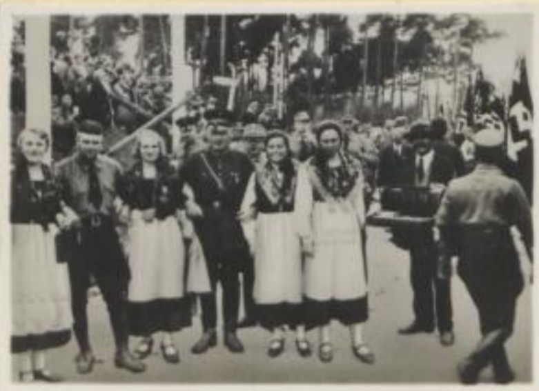
66. Die Oberschlesier auf der Zeppelinwiese