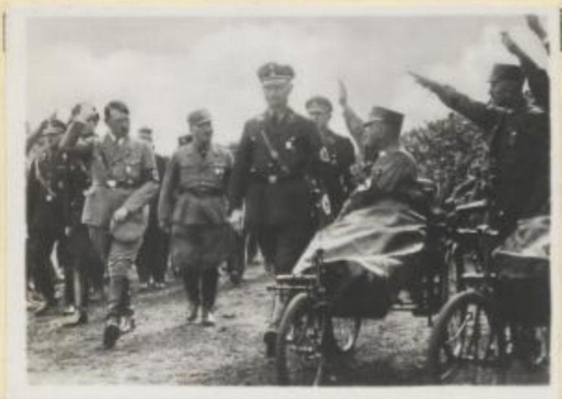
47. Der Führer begrüßt die Schwerverkriegsbeschädigten