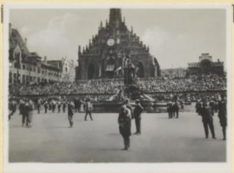
31. Der Adolf-Hitler-Platz