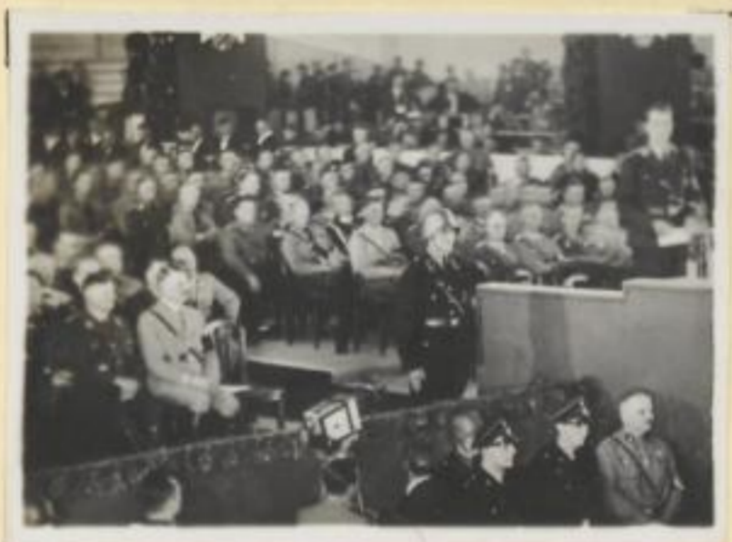
71. Der große Kongreß in der Festhalle Der Stellvertreter des Führers, Rudolf Heß, spricht