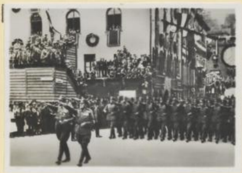
45. Vorbeimarsch des Stahlhelms