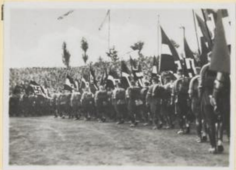
80. Hitler-Jugend marschiert im Stadion auf