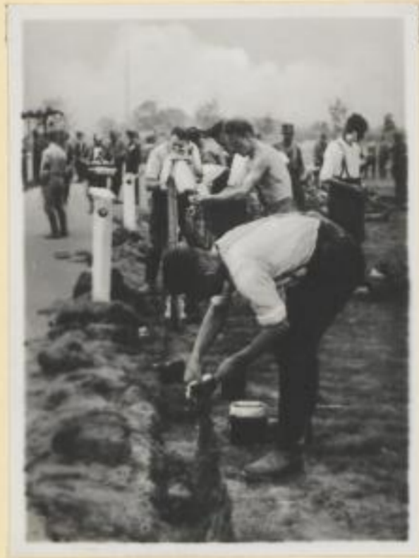
91. Fröhlichmorgens, wenn die Hähne krähen!