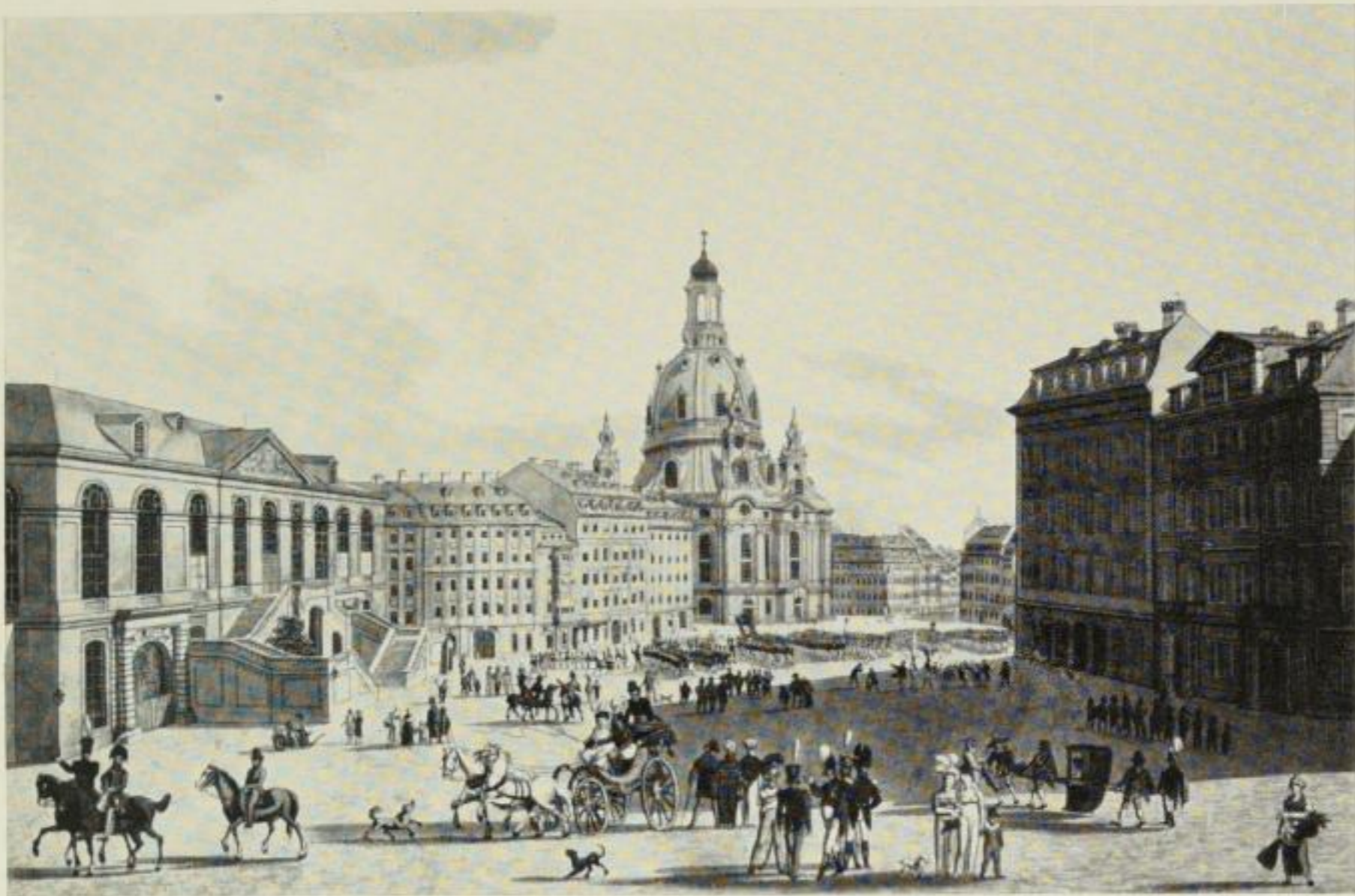
Regimentshaus (rechts) und Stallgebäude (Johanneum, links) am Neumarkt um 1800