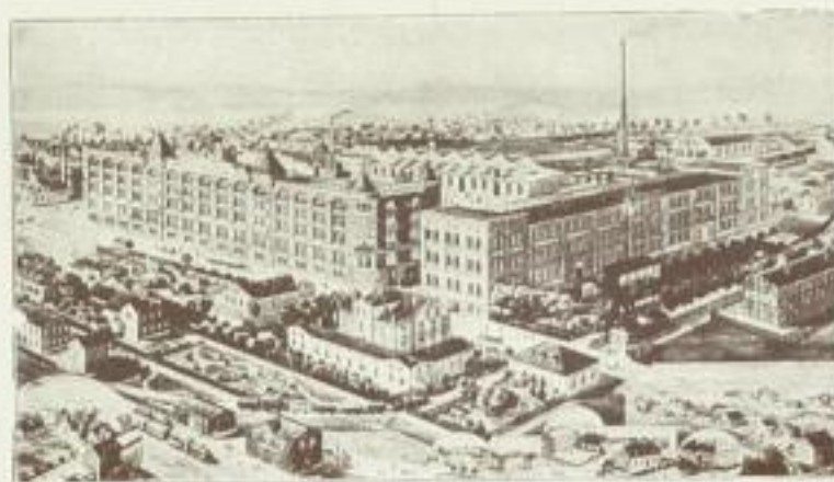
Flemmings Fabrik im Jahre 1897.