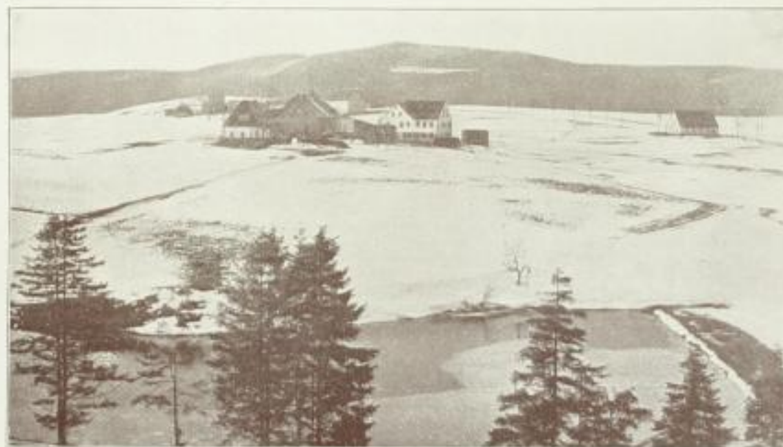
Neuheide, östlicher Teil.