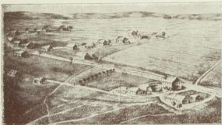
Oberschönheide im Jahre 1847.