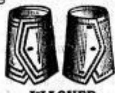
WAGNER Dtsch.-Paar M. 1.20.