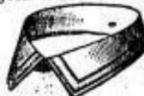
LINCOLN B Dtsch. M. - 55.