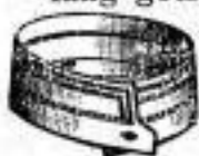
FRANKLIN Dtsch. M. - 60.