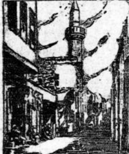
Bilder aus Ägypten. Oben: Der Suez-Kanal. links: Straße in Kairo. Zum englisch-ägyptisch. Konflikt.