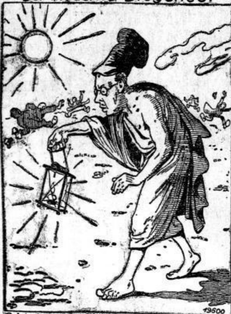
Reichskanzler Müller: Wo finde ich bloß die grabe Koalition!?