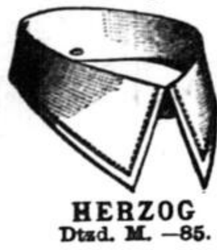
HERZOG Dtsd. M. -85.

Jeder Kragen kann eine Woche lang getragen werden.