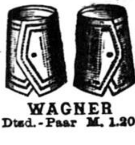
WAGNER Dtsd.-Paar M. 1.20.

Fabriklager von Mey's Stoffkragen in Freiberg i. S.: