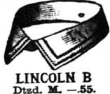
LINCOLN B Dtsd. M. -55.