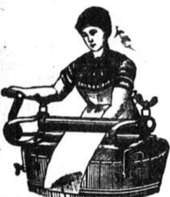
Bringmaschinen v. R. 12 an.