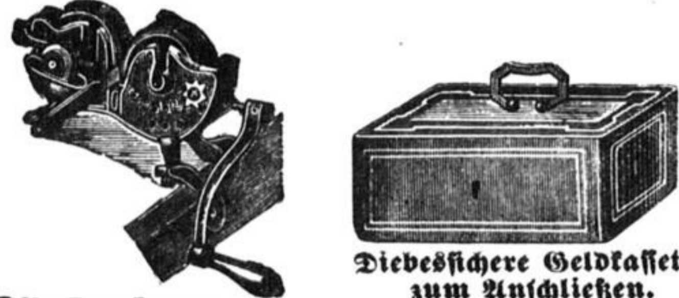
Diebstahlsichere Geldkassette zum Anschließen. Messerputz-Maschine.