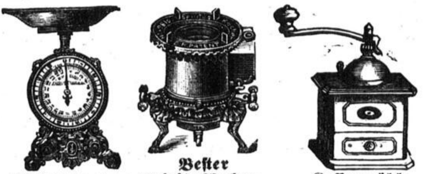
Küchenwaage. Spirituskocher. Kaffeemühle.