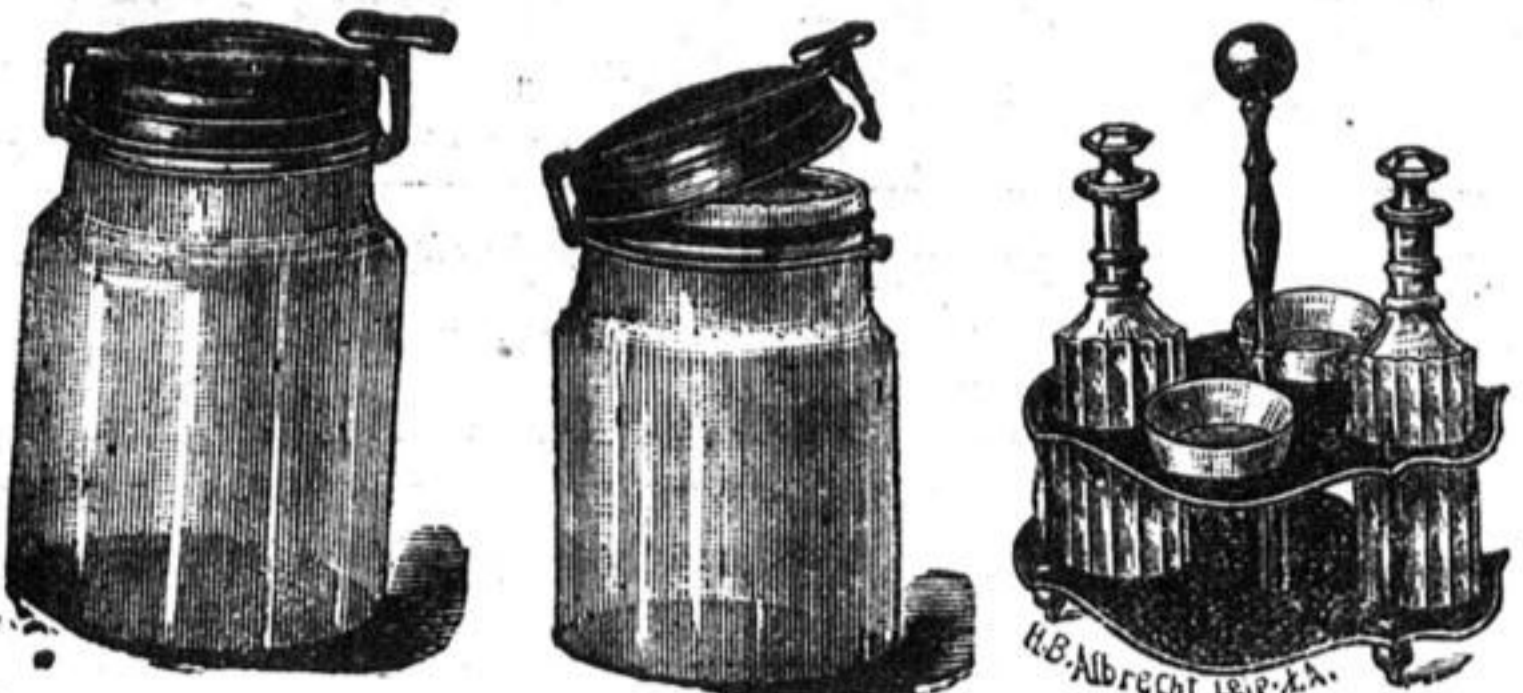
Geschlossen. Offen. Essig- und Delmenagen. Erzellen; Einmachebüchse.

Anerkannt beste Fabrikate zu Fabrikpreisen.