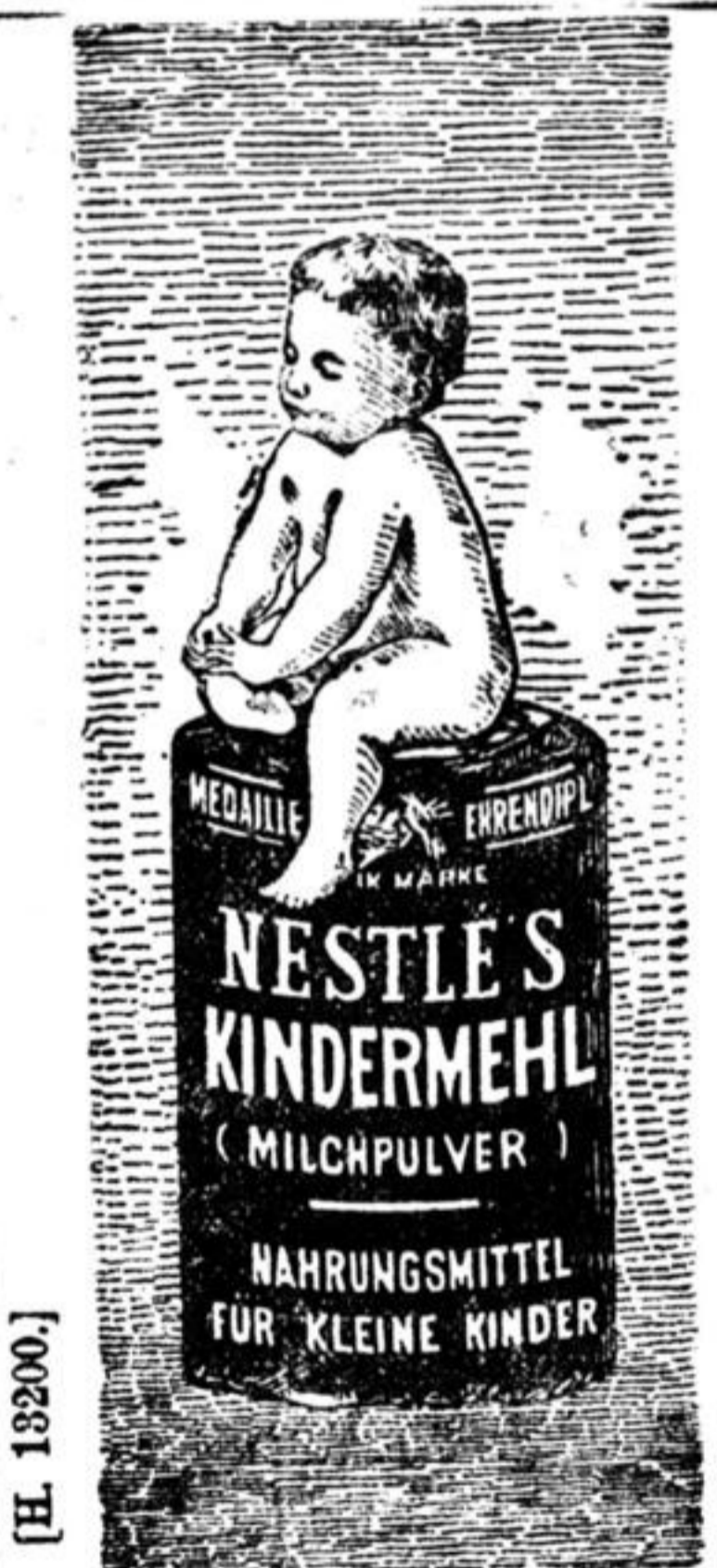
NESTLÉ'S KINDERMEHL (MILCHPULVER) NÄHRUNGSMITTEL FÜR KLEINE KINDER