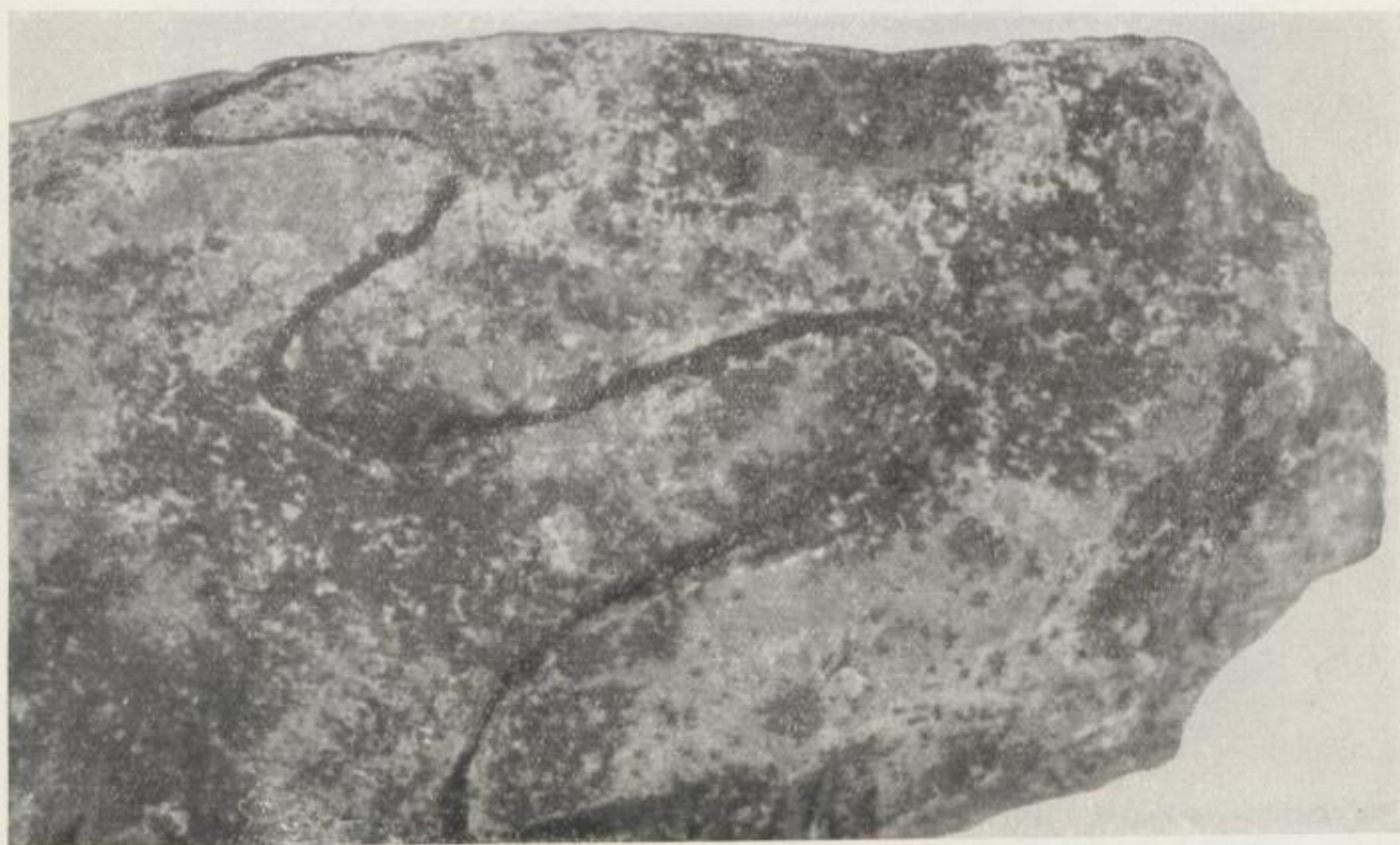
Bild 4. Bruchstück von Kalloclymenia subarmata MSTR. mit präparierter Lobenlinie. Oberdevon VI a Ehemaliger Kalkbruch am Kulm bei Oberlosa. 0/2