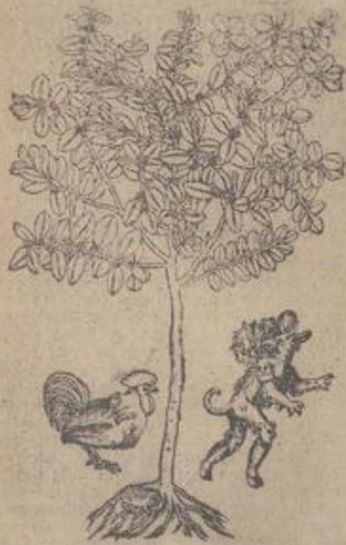
Ein Teufel steht vor dem Buchsbaum und dem Hahn...