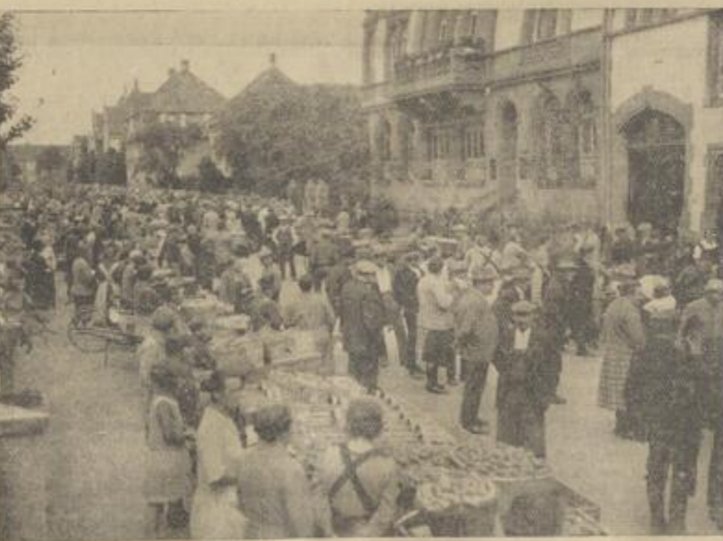
Der frühere Obstmarkt in Bahl auf offener Straße