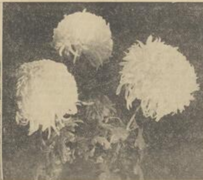
Chrysanthemum „Cubine“ bei Binz-Kastatt