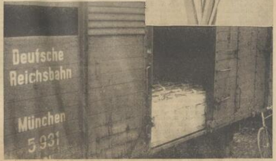
Mübler Zwetschen in den jetzt vorgeschriebenen 20-Pfund-Einheitspacken; rechts Waggoladung