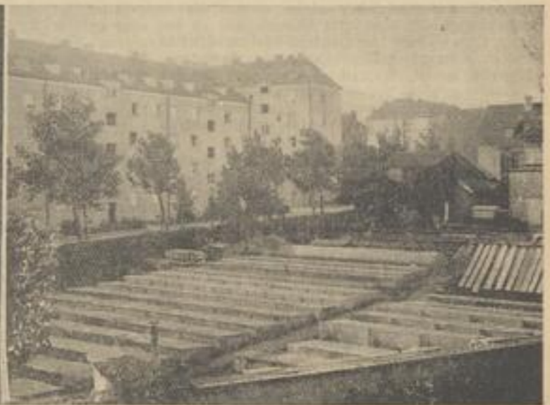
Kastenanlage der Firma Hofmann, Freiburg