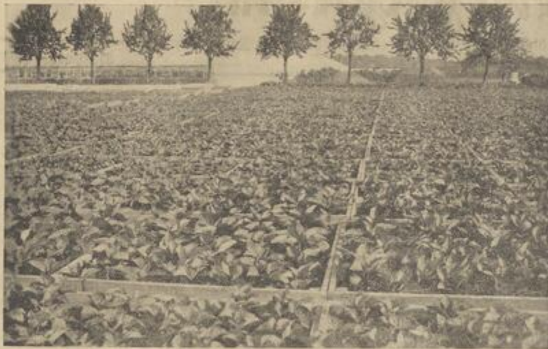
Kastenanlage mit Hortensien bei Binz-Kastatt

(Zu dem Artikel „Ein Querschnitt durch den badischen Gartenbau“)