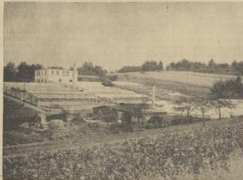
Gartenbaubetrieb Dinsler, Löffelburg