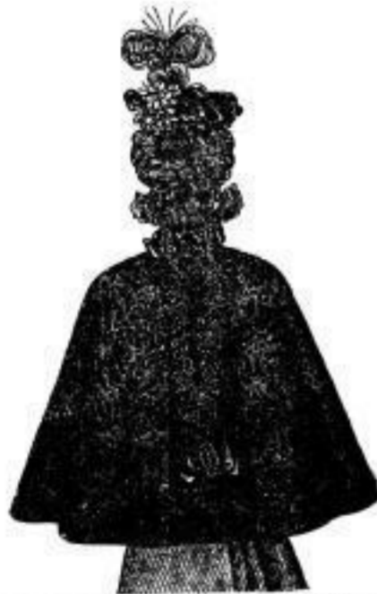
Marie anliegendes Frauen-Cape aus ramagierten Stoffen von M. 10.75 an.

Plissé-Kragen von M. 3.00 an. Gemust. Kragen mit Futter von M. 4.50 an.