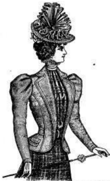
Eduna aus schwarzem Kammgarnstoff von M. 10.— an in coul. Farben von M. 7.50 an.

Staub-Mäntel in carrirten Stoffen von Mk. 8.50 an