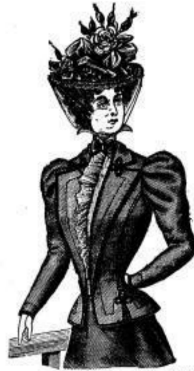
Helena flottes Jaquett aus schwarz. Kammgarnstoff mit Noire-Besatz von M. 12.00 an in farbigen Stoffen von M. 9.00 an.