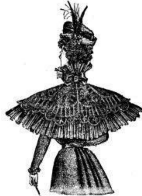
Wilhelmine à jour Kragen, jugendliches Façon von M. 10.00 anfangend.

Kinder-Kleidchen in allen Grössen. Kinder-Mäntel von M. 4.00 an. Kinder-Jaquettes von M. 3.00 an.