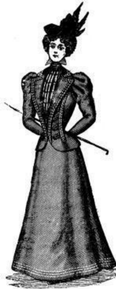
Jaquett-Costume in allen Farben von M. 8.75 an. Obiges Façon ist besonders praktisch für Radlerinnen.